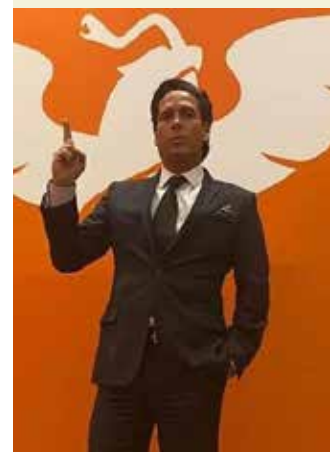
Roberto Palazuelos, precandidato a la gubernatura por Q. Roo.

"Hay una clara oposición a la precandidatura de Palazuelos por parte de quienes estamos, y creemos, en un proyecto de paz, verde, justo e igualitario en MC", dijo en Twitter la secretaria de Desarrollo Urbano con el alcalde de MC en Monterrey, Luis Donaldo Colosio Riojas.