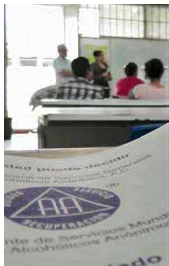
■ Dan más pláticas a la semana de AA en 'El Torito'.

"El alcoholismo es una enfermedad de negación, la gente a veces se le pregunta ¿usted bebe? y en automático dicen no, yo no bebo alcohol, pero bebo cerveza, entonces desde ahí ya viene la negación, esta enfermedad es muy compleja, por eso nosotros no podemos alcanzar cantidades mayores".