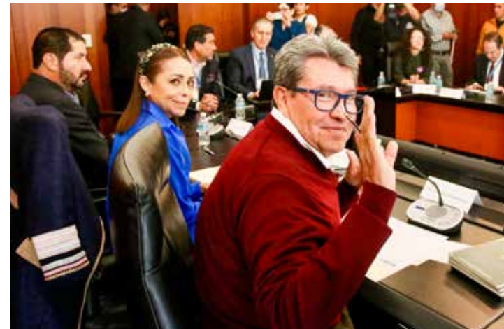
Ricardo Monreal 'aclara' dudas sobre el 'Plan B' de reforma electoral.

El presidente Andrés Manuel López Obrador presumió a Miguel Díaz-Canel, presidente de Cuba, uno de los principales proyectos de la 4T en el sureste mexicano: el Tren Maya.