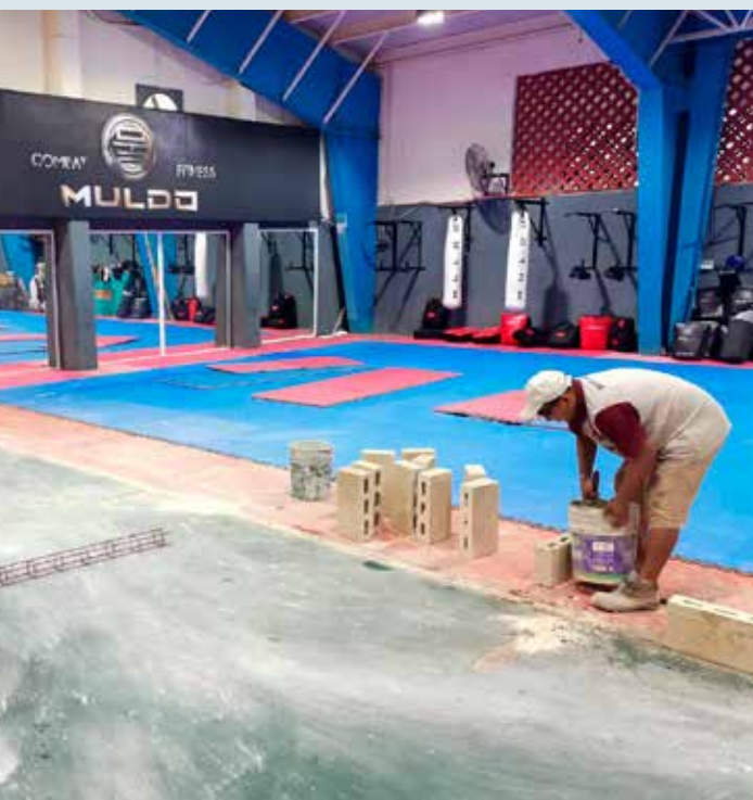
Este 2023 se espera invertir cerca de 2 millones de pesos para cambiar las oficinas, área de boxeo e instalar un área de rehabilitación.

Al final Harrison Butker metió la patada para dejar el 38-35 y ocho segundos para Filadelfia.