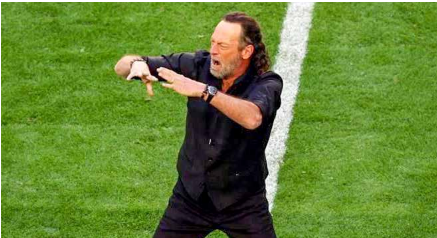
■ Troy Kotsur, actor sordo ganador del Oscar, interpretó el himno nacional de EU previo al Super Bowl, al mismo tiempo que Chris Stapleton.