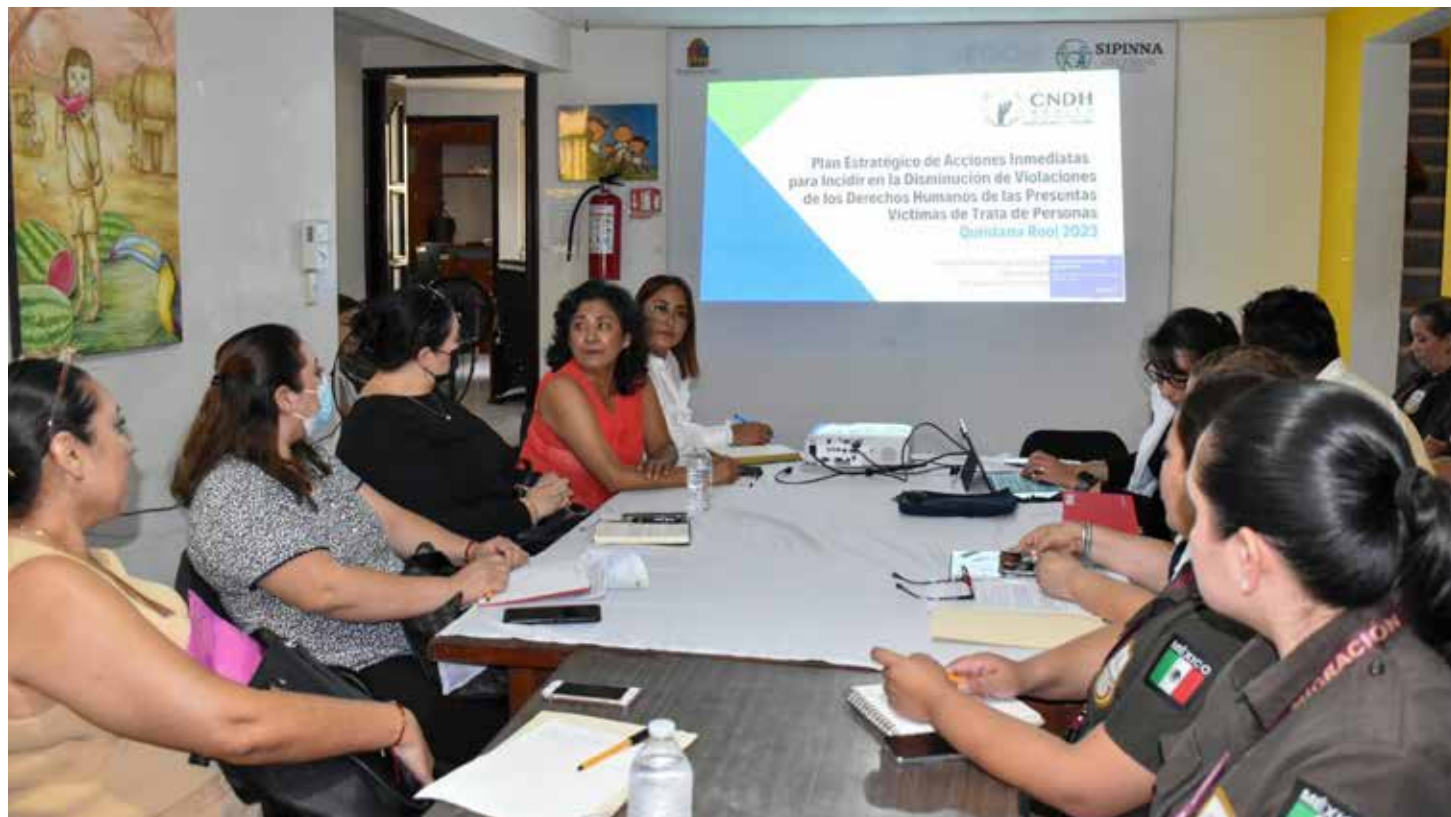
■ Se busca capacitar a servidores públicos en materia de trata de personas.