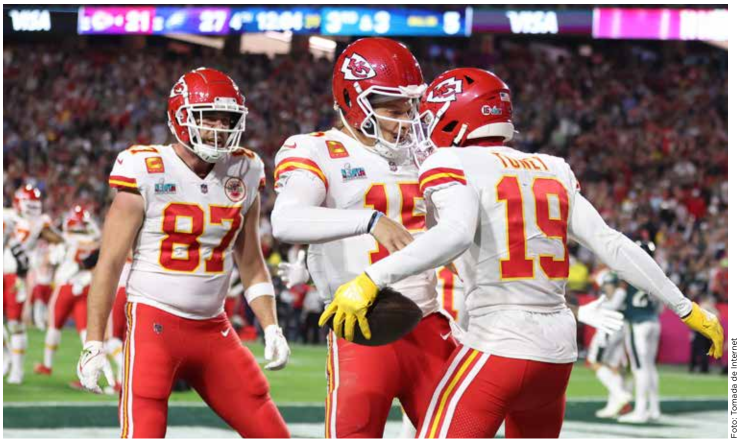
Patrick Mahomes ganó su segundo Super Bowl en menos de cinco años.

El funcionario dijo que "cada 15 días vamos a levantar una unidad deportiva" y en algunos casos son para ver "temas menores, como tableros, soldaduras, y pintura". A finales de febrero se inaugurarán las canchas en la región 252, donde se contó con inversión de la empresa Aguakán y la Dirección de Ecología de Benito Juárez, donde se colocaron nuevas porterías, bancas alrededor de la pista para correr y un circuito donde pueden trotar.