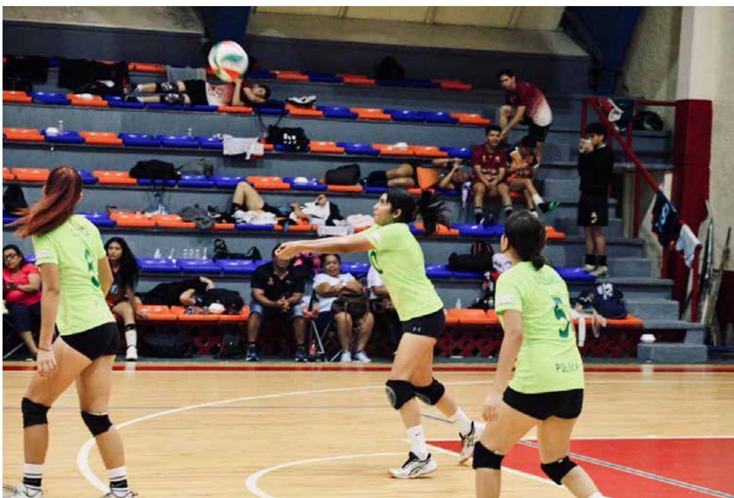
Cancún fue sede de las eliminatorias en voleibol, natación artística y fútbol.

La etapa nacional de los Juegos CONADE se llevará a cabo entre mayo y junio, con Tabasco y Jalisco como sedes principales.