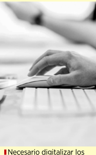
■ Necesario digitalizar los servicios, indica el Iqit.