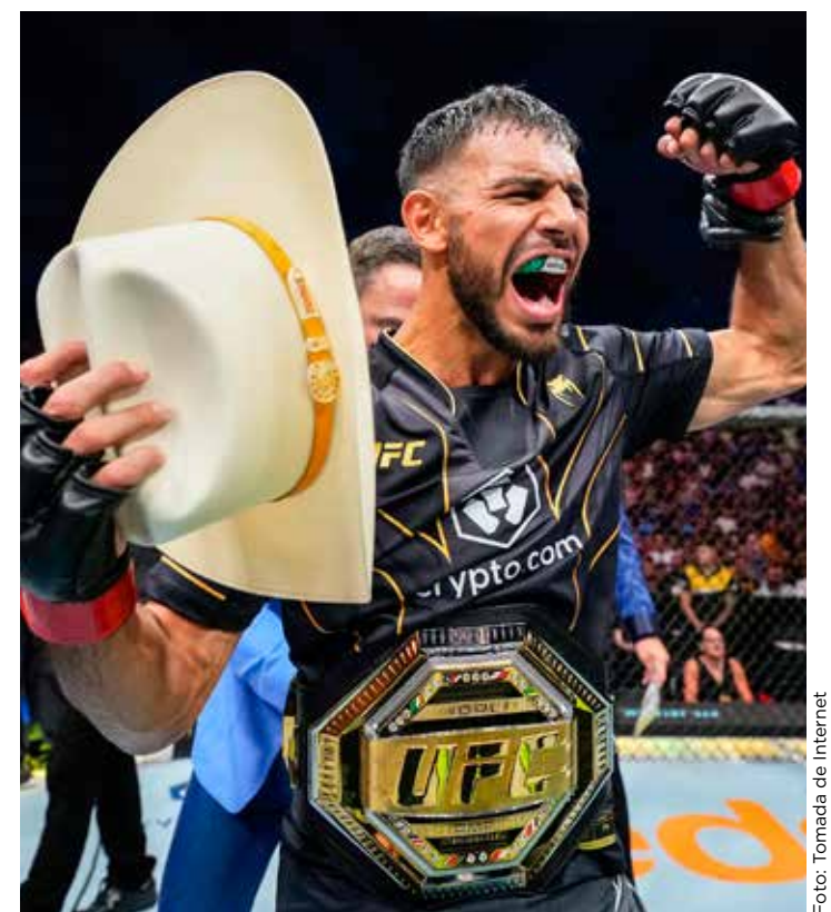
Yair Rodríguez se convirtió en el segundo campeón nacido en México de la UFC.

El boxeador Saúl Álvarez peleará el próximo 6 de mayo en Jalisco. Según ESPN, el rival del 'Canelo' será John Ryder, campeón interino de peso supermediano.