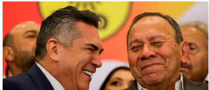
Los dirigentes del PRI y PRD unidos 'en defensa del INE'.

"Hay una mujer que está bien puesta, como dicen las mujeres, 'con las faldas bien puestas', por lo que tenemos muchas probabilidades de echar abajo esa