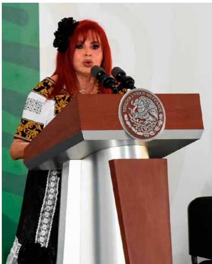
En la denuncia se solicita la comparecencia de la gobernadora Layda Sansores.

Una de las denuncias cita el artículo 295 del Código Penal del Estado de Campeche, alusivo a peculado, para señalar que "comete el delito de peculado el servidor público que, para usos propios o ajenos, utilice o distraiga de su objeto, dinero, valores, fincas o cualquier otra cosa perteneciente al Estado, municipios, poderes legislativo y judicial del Estado, dependencias