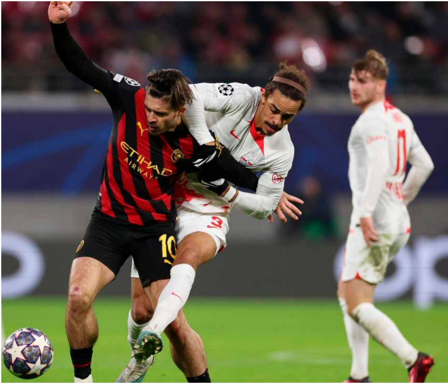
Manchester City no se queda en Octavos de la Champions desde la campaña 2016-2017, la primera de 'Pep' Guardiola como su técnico.

En la otra llave, Inter ganó con gol solitario de Romelu Lukaku, sin embargo, el Porto sabe lo que es forzar los tiempos extra para avanzar en Cuartos de Final, como lo hizo en 2018-2019 ante Roma y en 2019-2020 contra Juventus.