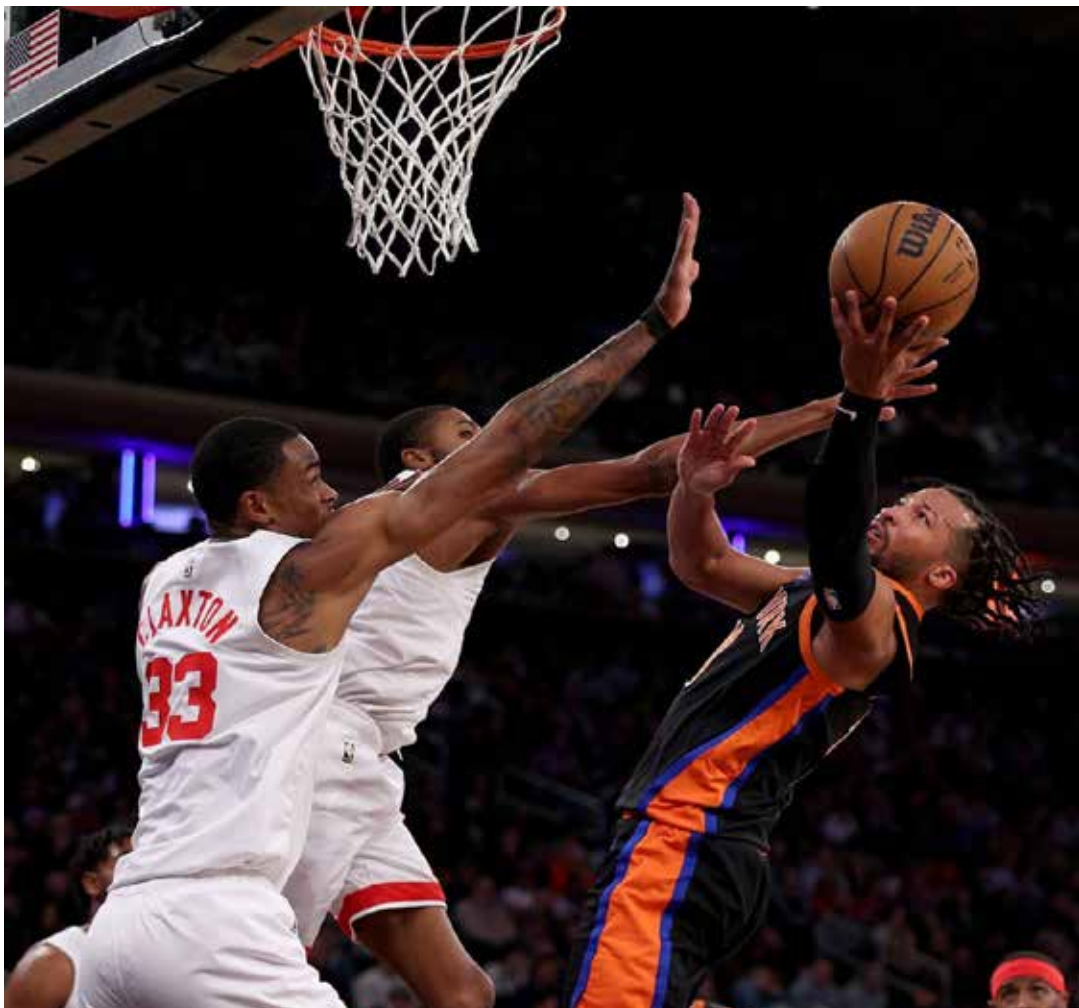
Desde que comparten ciudad, Nets y Knicks han avanzado ambos a playoffs dos veces en la misma campaña.

La convocatoria para participar en el Abierto Mexicano en Cancún se abrirá el 1 de abril y cerrará el 27 mayo, en la página de WAKO México. Los participantes deberán contar con un certificado médico que los certifique como aptos para pelear y durante el torneo se aplicarán pruebas antidopaje.