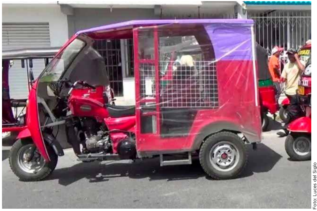
■ Actualmente se realiza un censo para saber cuántos mototaxis hay.

Finalmente, sobre la aplicación del programa de alcoholímetro, indicó que por la Ley de Movilidad y Seguridad Vial federal todos los municipios tendrán que comenzar a desarrollar sus programas, algo en lo que el Imoveqroo estará insistiendo, pues considera que es también parte de las estrategias para fortalecer la educación y seguridad vial.