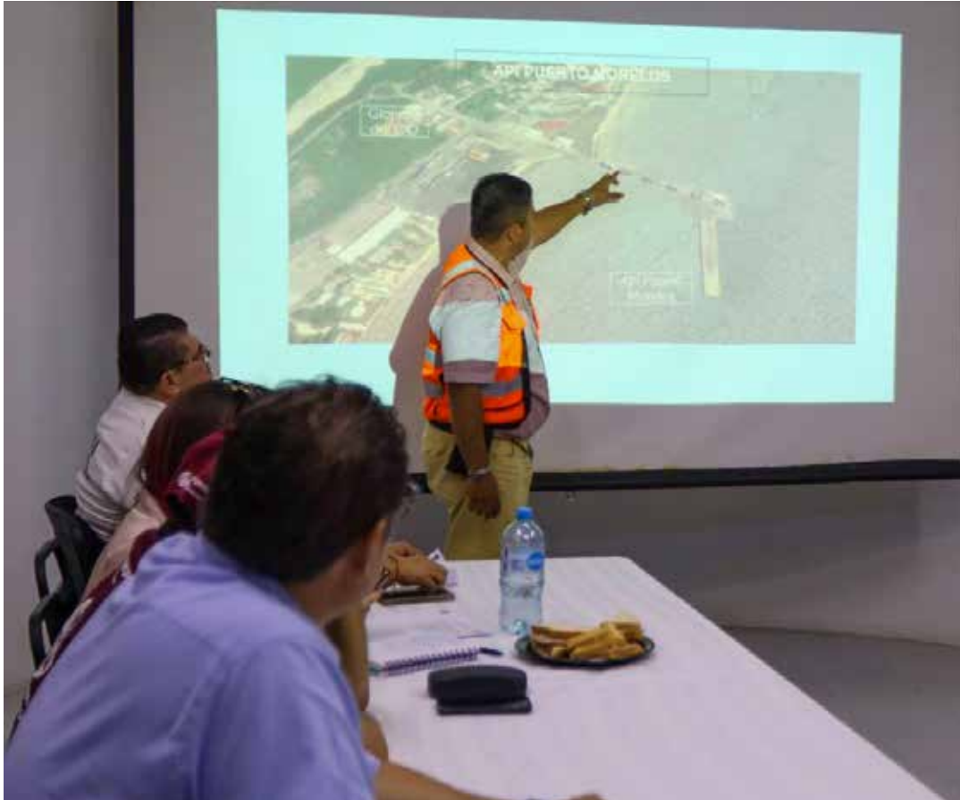
■ Autoridades detallan el operativo de descarga de balasto en Puerto Morelos.

En ese sentido, el Ayuntamiento de Puerto Morelos informó que este lunes se llevó a cabo una reunión entre auto-