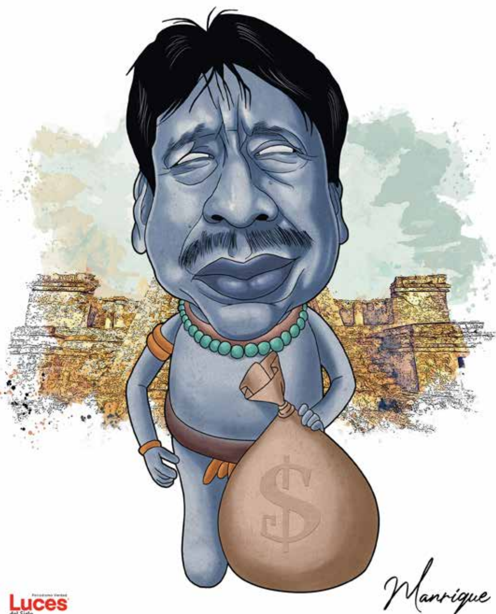
Figura hallada en los vestigios del Erario de Tulum. Data de hace más de 115.5 millones de pesos. Fue creada durante el clásico periodo de la Dinastía Mas Tah.