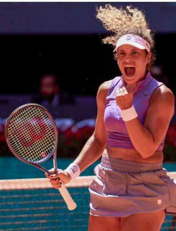
La egipcia se convirtió en la revelación del torneo, tras eliminar a la quinta del ranking en la tercera ronda.

"No pienso mucho lo que he hecho o dónde estoy, solamente me centro en mi próximo partido, en mi próxima rival. Lo llevo haciendo así toda la semana y así voy a seguir. Me siento bien jugando ante este tipo de rivales, el otro día ya me pasó jugando contra Caroline