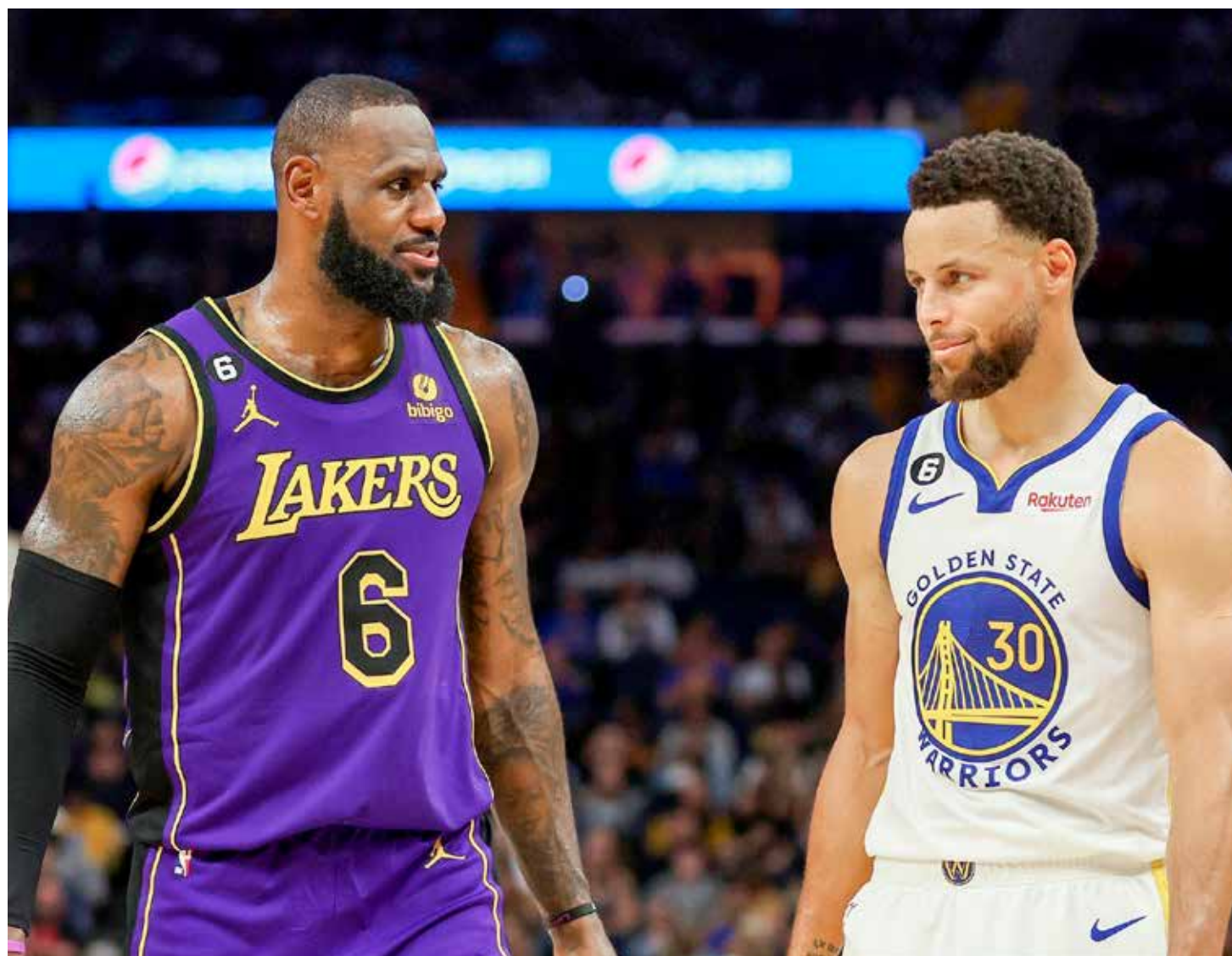
Desde las Finales de 2018, LeBron no jugaba contra los Warriors. Cabe aclarar que el play in de 2021 no se considera parte de playoffs.

James enfrenta por primera vez a GS con Los Ángeles