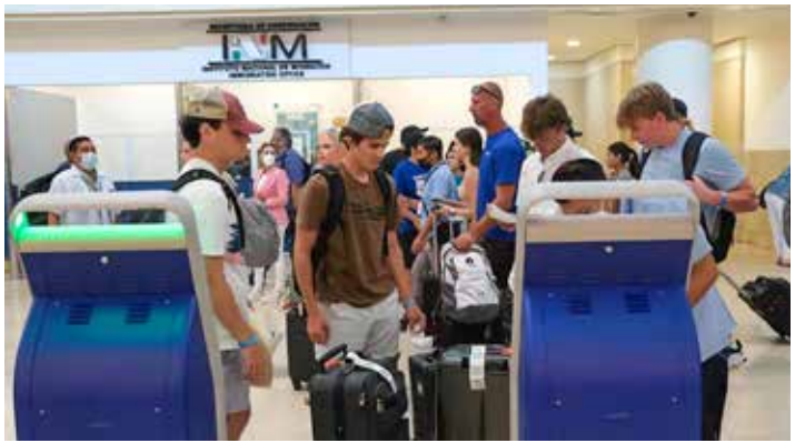
Preocupan a hoteleros malas prácticas migratorias que merman al turismo.