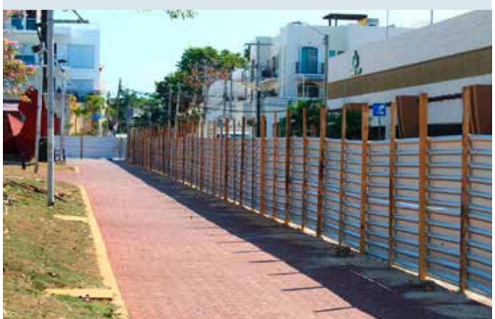
En 15 días iniciarán las obras en la Plaza 28 de Julio.