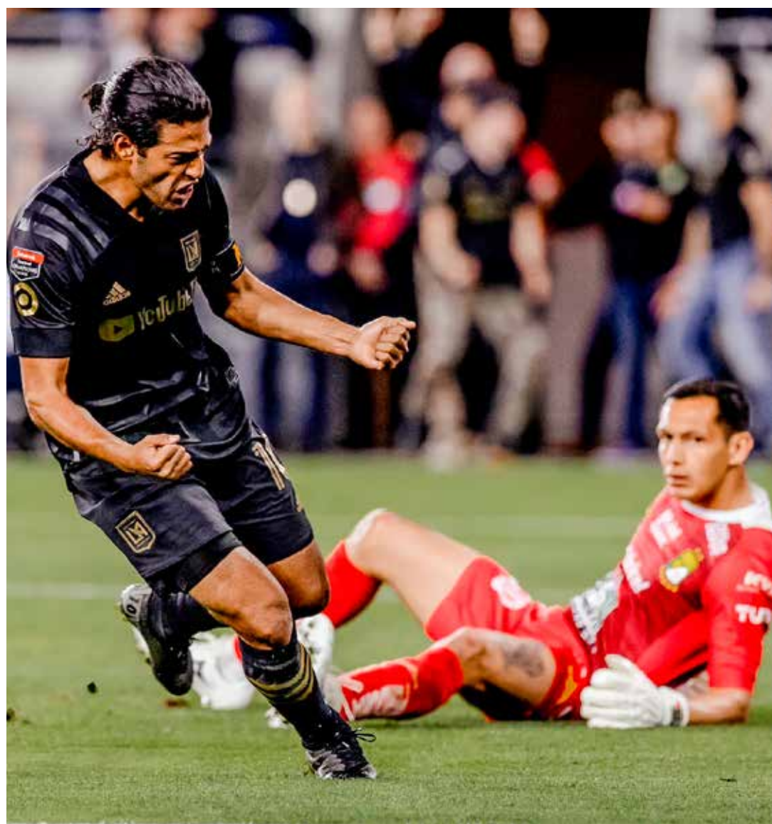
El cancenense ha marcado tres goles en la edición 2023 de la Concachampions y está a dos tantos de su marca en 2020.