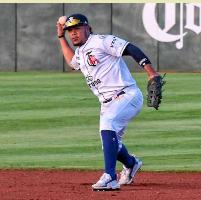
La novena felina intentará escalar posiciones en la Zona Sur ante un rival directo.

Cuando terminen su serie contra Campeche, la novena de bengala viajará a casa de los campeones vigentes, los Leones de Yucatán.