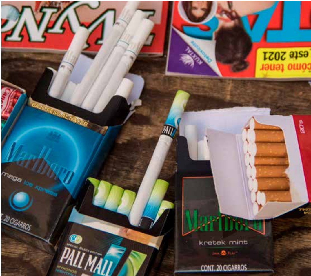
El 'Reglamento antitabaco' sigue perdiendo ante amparos de empresarios.