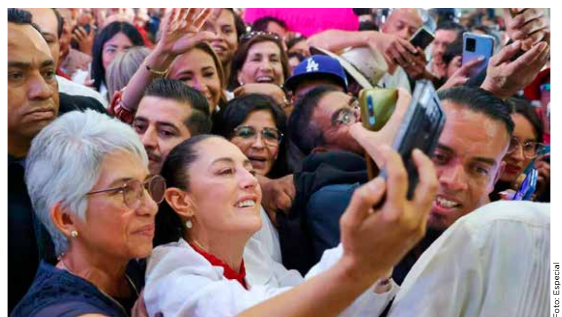
Claudia Sheinbaum destacó la importancia de las mujeres en la democracia.

El titular del Ejecutivo federal se mostró despreocupado ante futuras impugnaciones a sus reformas por parte de la Oposición y finalizó diciendo que "ya se verá".