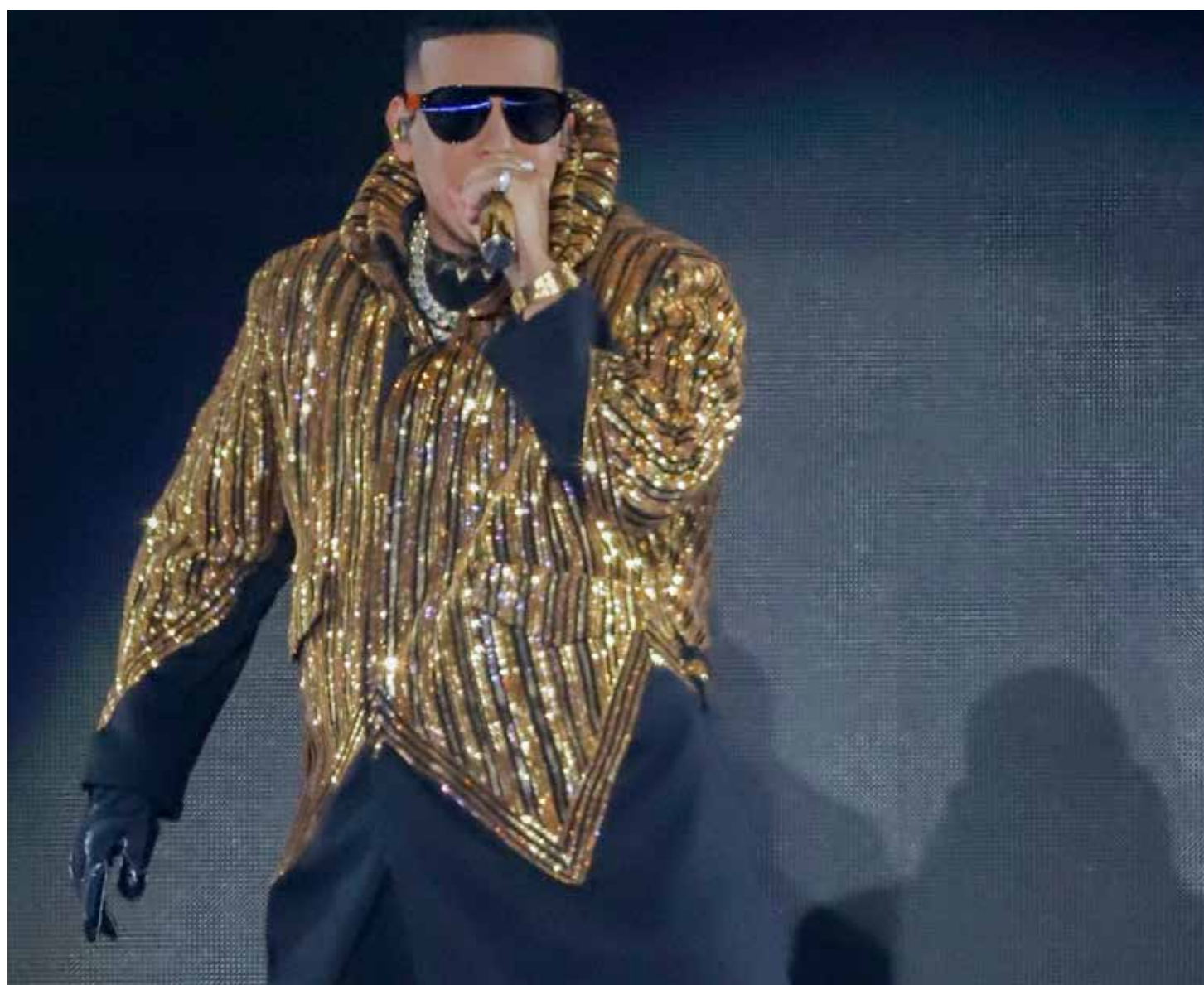
Ramón Ayala, mejor conocido como Daddy Yankee, será productor ejecutivo de la serie Neon que realizará Netflix.