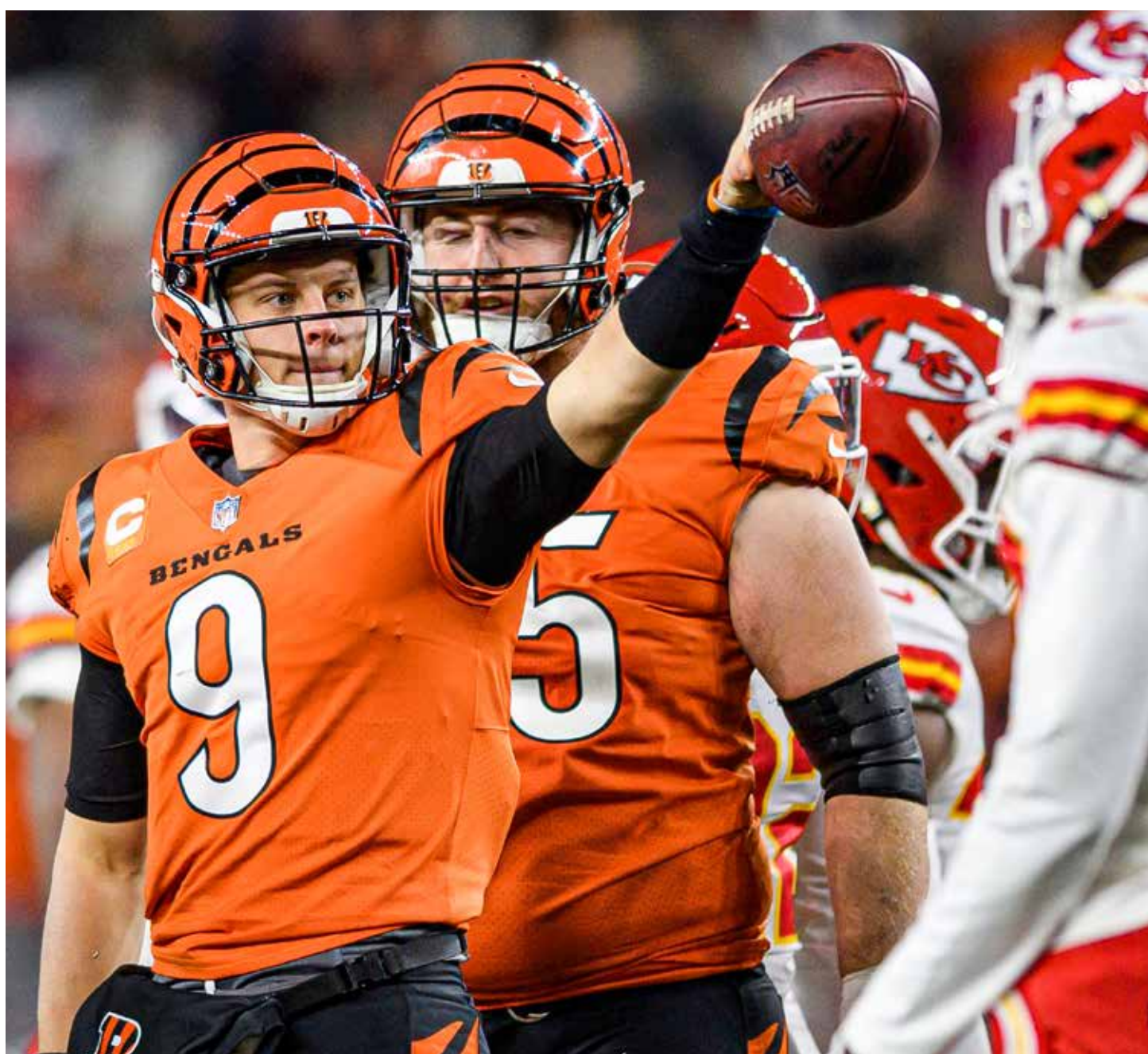
■ Mahomes fue el líder en yardas y touchdowns la campaña pasada, el segundo lugar fue para Joe Burrow.

Cincinnati comenzó sus campeonatos de pretemporada, con Burrow al frente del equipo.