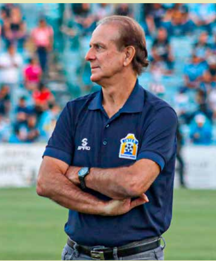
■ El director técnico estará por cuarta temporada consecutiva al frente de los playenses.