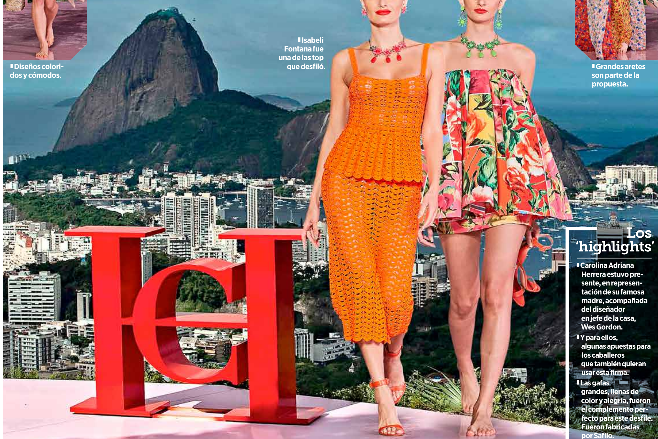
Grandes aretes son parte de la propuesta.