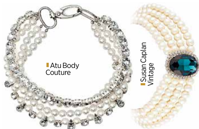
Atu Body Couture