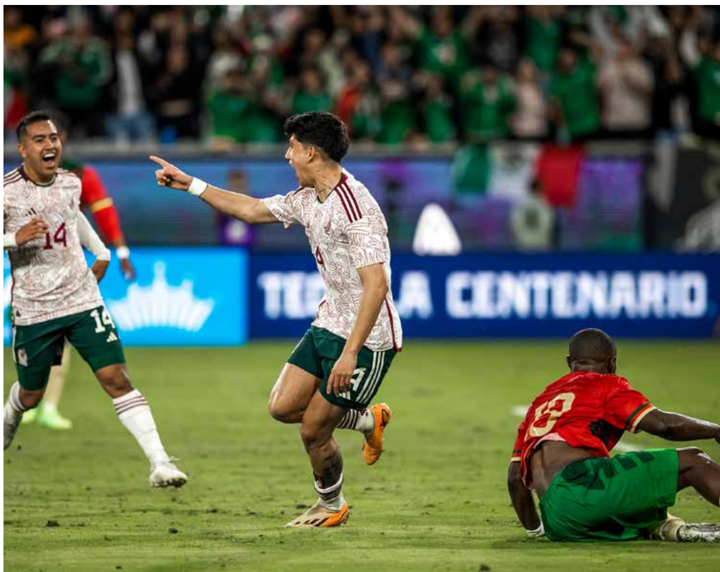
■ México tiene cinco partidos consecutivos sin ganarle a Estados Unidos.

Selección Mexicana enfrentará a Estados Unidos