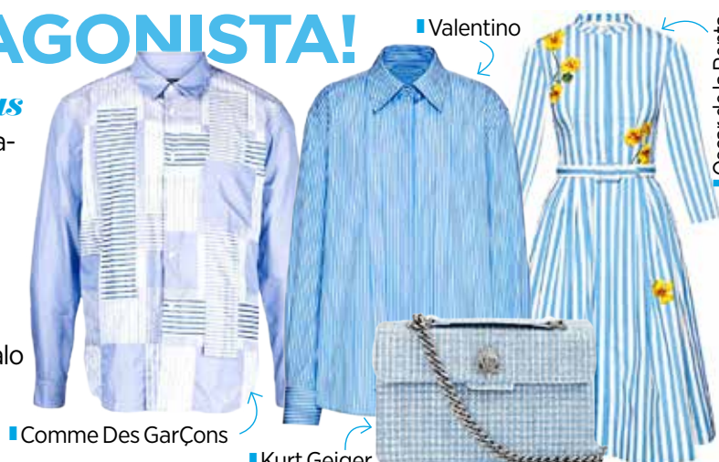
Comme Des Garçons

Lo mismo para damas que para caballeros, el estampado a rayas con fondo azul cielo es el favorito para llevar en los días de verano. Puedes usarlo en camisas y bermudas hasta en vestidos camiseros y faldas, dale el sí a este print y combínalo con un par de sandalias que estén en tendencia.