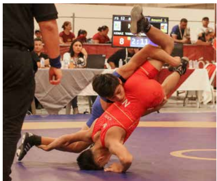
■ Las actividades de luchas asociadas continuarán durante la semana en la modalidad grecorromana.