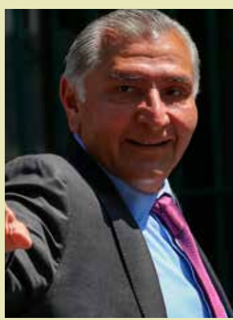
El secretario de Gobernación dejará el cargo este viernes.

“No sé cómo le vayan a hacer, de todas maneras voy a mantener así, lo he hecho toda mi vida, pues yo siempre llevo un registro contable de mi haber y de mis gastos. Después daré un (informe)”, contestó. El funcionario aseguró que