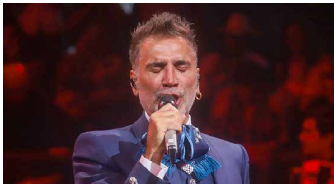
A menos de 24 horas del lanzamiento del tema, internautas criticaron que Alejandro Fernández se una con Grupo Firme.

Aunque el Potrillo no se ha pronunciado al respecto, ha estado compartiendo en su cuenta de Instagram el videoclip.