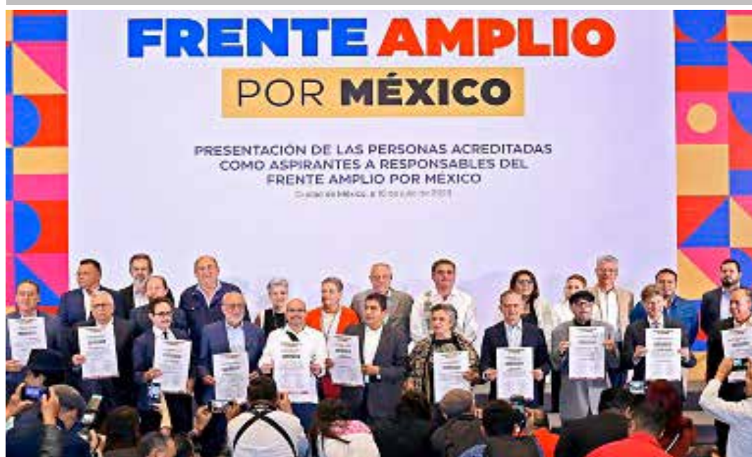
Tras varias bajas, actualmente quedan 12 aspirantes registrados para encabezar a la Alianza opositora que hará frente a la 4T en las urnas.