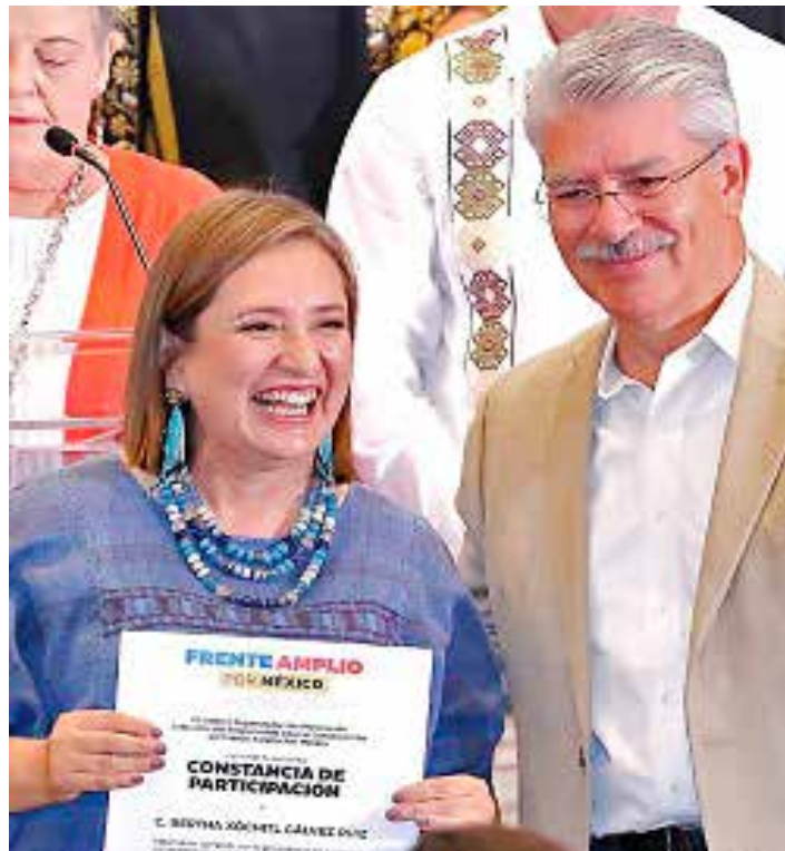
El registro de Xóchitl Gálvez revolucionó el ambiente político, tanto entre aliancistas como con integrantes de la 4T.

En acuerdo con los dirigentes del PAN, PRI y PRD, Gurriá fue reclutado para