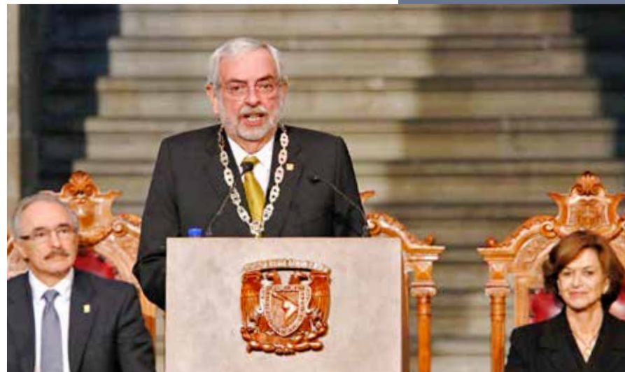
Tras ocho años en el cargo, Enrique Graue dejará la Rectoría en el mes de noviembre.

“Es importante que en la Universidad se ponderen sobre la mesa muchas opciones, pero lo cierto es que la normatividad no es algo que se pueda cambiar de la noche a la mañana. En este momento no podríamos cambiar las