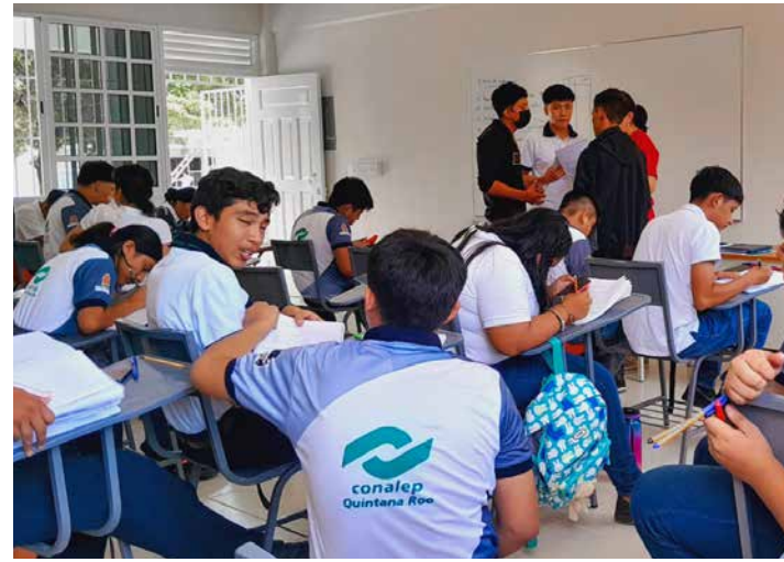
■ Iniciaron clases alumnos de la nueva carrera Técnico en Transporte Ferroviario.

"Tenemos 121 hombres, 74 mujeres estudiando esta carrera en Técnico Ferroviario que sin duda alguna van a tener mucho trabajo, el Tren Maya es una realidad, estamos por verlo ya andar en unas semanas más, y en la inauguración ya como todos ustedes saben en diciembre".