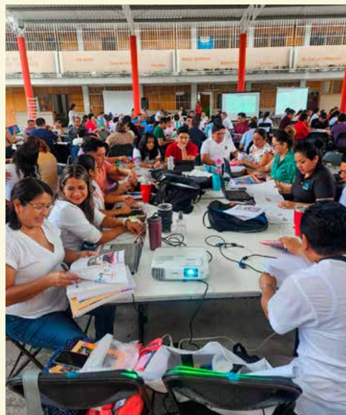
Con el curso de formación continua los docentes regresaron a las escuelas.

El subsecretario detalló que están trabajando a marchas forzadas para el próximo lunes que es el inicio de un nuevo ciclo escolar, por lo que están