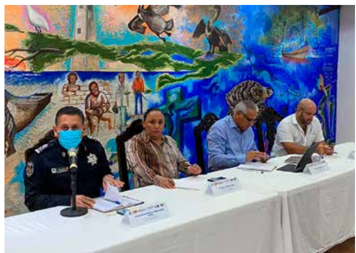
La conferencia del Gabinete de Seguridad se realizó en Isla Mujeres.

La exhortó a utilizar los programas que se han puesto a su disposición para mejorar su calidad de vida.