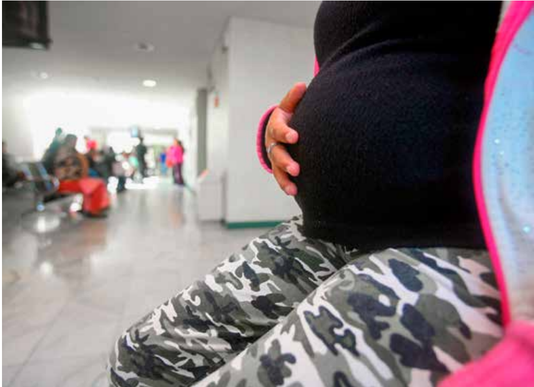
El Fondo de Población de la ONU llamó a reforzar los programas contra el embarazo adolescente.

"Además de eso, ha habido un esfuerzo de articulación institucional a todos los niveles de gobierno para poder realmente llevar adelante, traducir esta estrategia en planes de acción concretos, y con un esfuerzo intersectorial que nos refleja una clara comprensión de que el embarazo adolescente no es solamente una cuestión de salud pública".