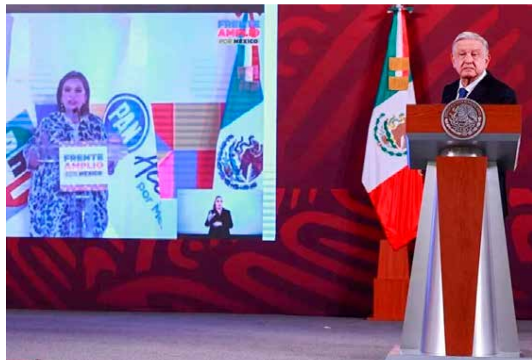
En conferencia matutina AMLO puso el video donde Gálvez critica al sureste.

En ese entorno, los panistas le escribieron a Creel para advertirle que las dirigencias nacional y estatales del PRI habían anunciado "el respaldo total a Beatriz Paredes Rangel, militante de ese partido y una de las aspirantes también, a dirigir el Frente Amplio por México".