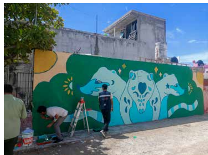
Alumnos de la Universidad de Dallas, Texas, pintaron el mural.

"En zona norte (se presentaron estos hechos), pero fueron intentos de acceso de ladrones, que afortunadamente en el acuerdo que nos pide la gobernadora (Mara Lezama) ese involucramiento de la parte civil, de la Policía Municipal, Estatal y Guardia Nacional, funcionó de maravilla".