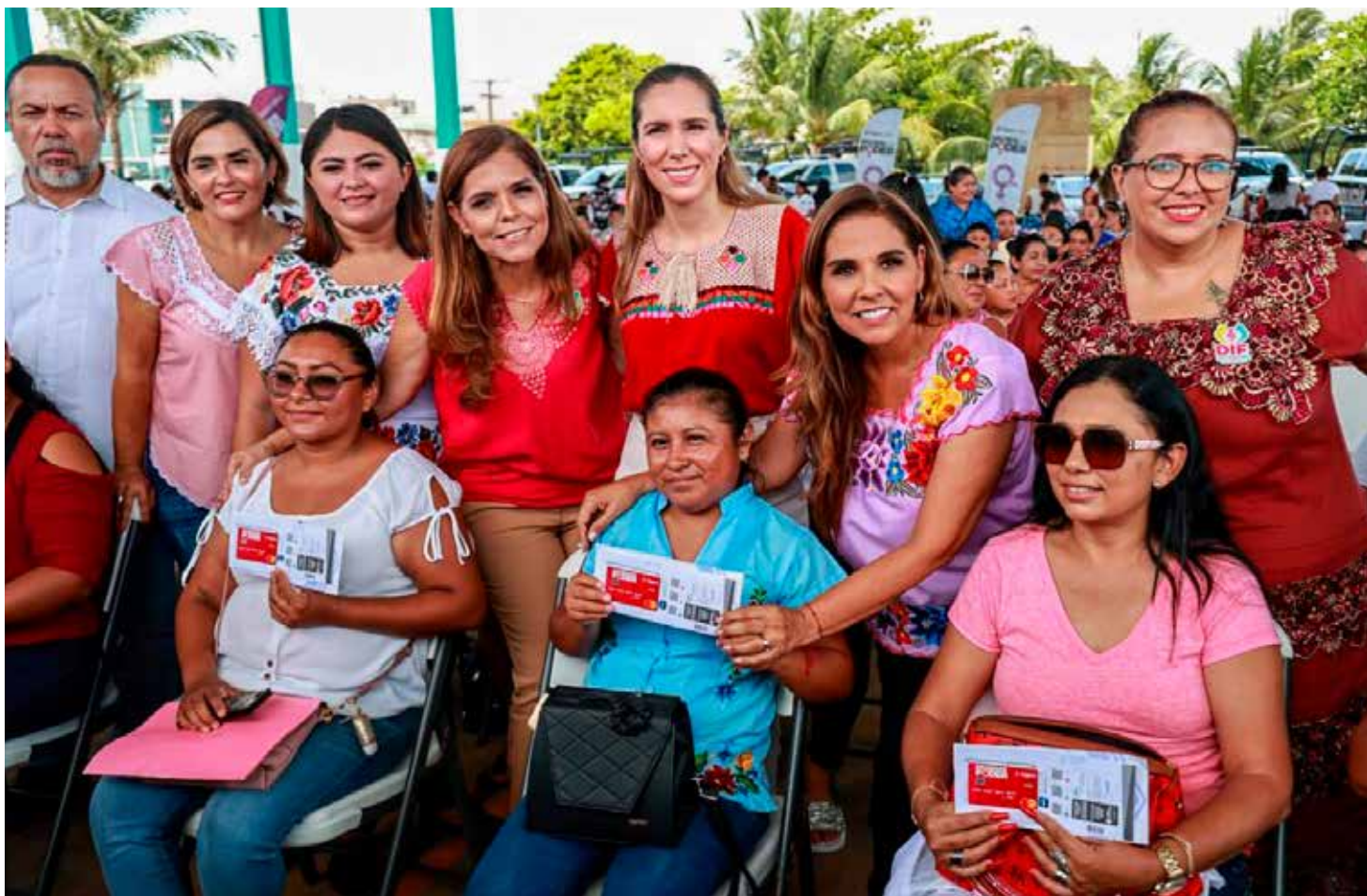
La gobernadora Mara Lezama realizó una gira de trabajo en Isla Mujeres.

Aunado a los esfuerzos para fortalecer la seguridad en Quintana Roo, la corporación estatal realizó 20 mil 187 operativos y acciones; participó en 476 operativos con autoridades federales y colaboró activamente en mil 398 operativos junto con los municipios.