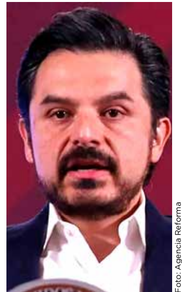
Zoé Robledo decidió no contender por la gubernatura de Chiapas.

"En segundo lugar creemos que es muy importante la inversión pública, puesto que cualquier prioridad nacional narrativa no es suficiente si no se traduce en una inversión para, por ejemplo, mejorar los sistemas de protección social, para mejorar los sistemas de cuidados que permitan a las mujeres una mejor inserción en el mercado laboral, sin arrastrar esa culpa o esa doble responsabilidad de trabajos de cuidado familiar, doméstico, a la vez de tener la posibilidad de acceder a la autonomía financiera".