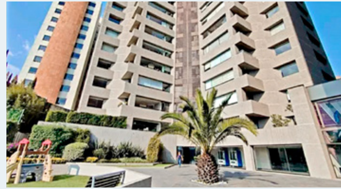
■ Bosques de Minas 130, Colonia Bosques de La Herradura, Naucalpan.

damientos de captura, uno de ellos por el mismo ilícito antes referido y los otros por delincuencia por delincuencia organizada, lavado de dinero, peculado y defraudación fiscal.