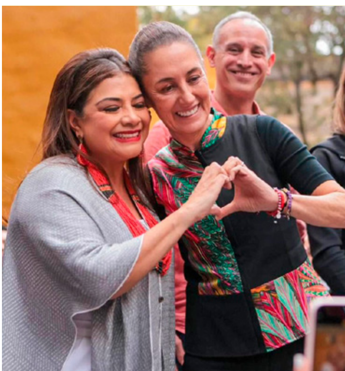
■ Claudia Sheinbaum junto con Clara Brugada, precandidata de la 4T en la CDMX.