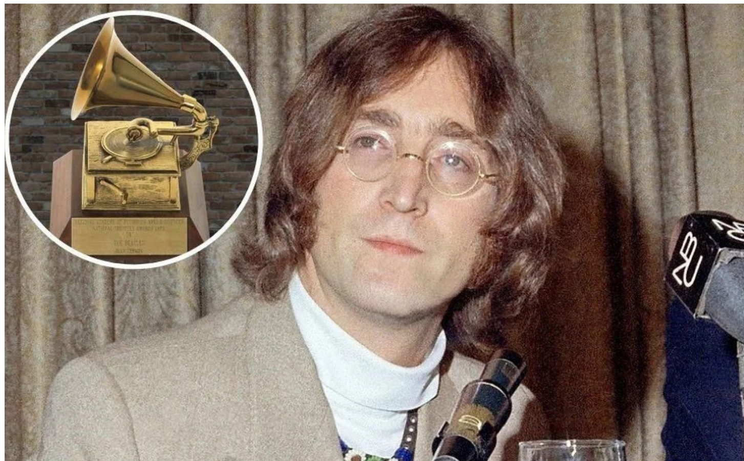
Los fans de los Beatles podrán conseguir un Grammy especial que le perteneció a John Lennon; podría alcanzar un valor de 500 mil dólares.

Gotta Have Rock and Roll también cuenta con otros objetos como una Hofner 5140 Lap Steel Guitar que fue utilizado por Lennon y Paul McCartney y un borrador del tema "All Of Me" del puño y letra de George Harrison.