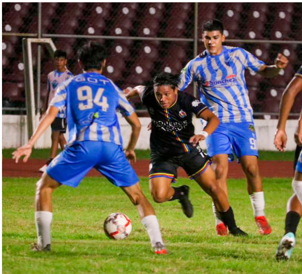
Los cancenenses terminaron como líderes del Grupo Uno en la Zona Sur.