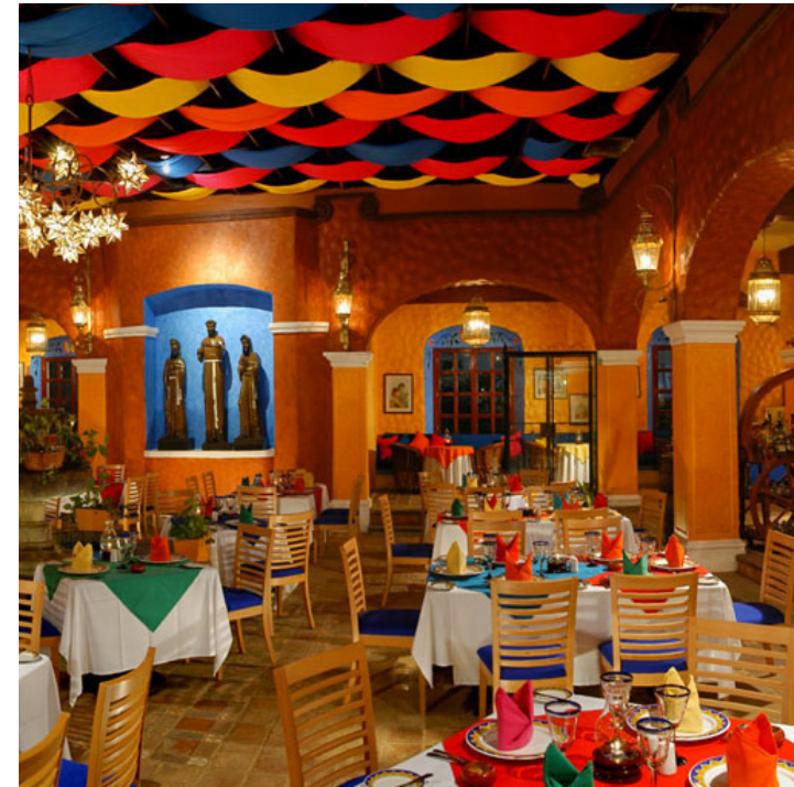
Los restauranteros están a la espera de firmar convenio con la PPA.

dio a conocer que asesorará a la Canirac Quintana Roo, en una estrategia para regularizar a sus agremiados en el Plan de Manejo de Residuos Sólidos.