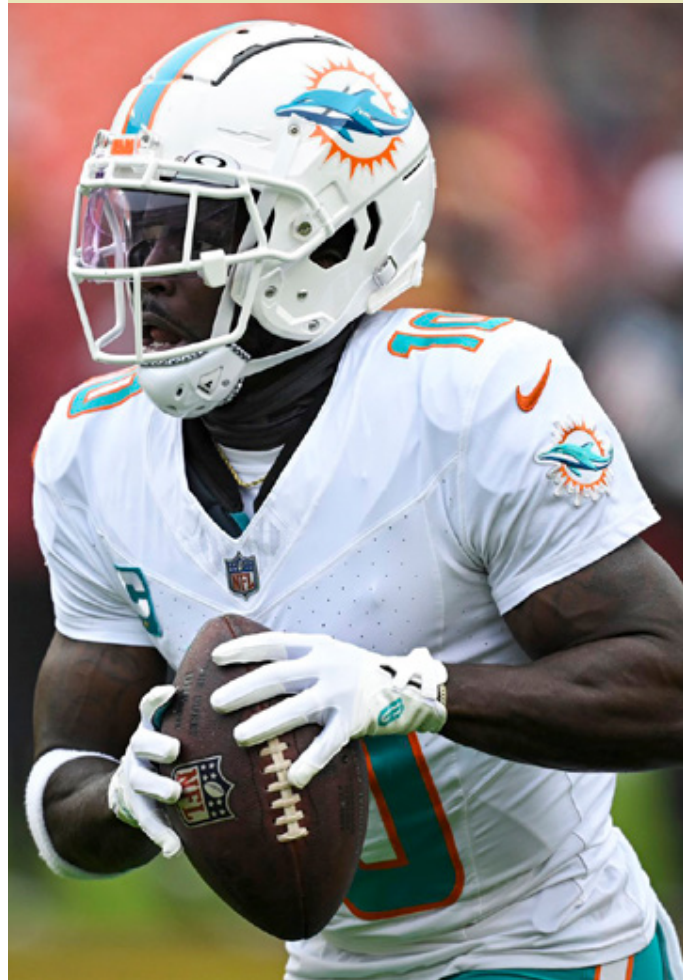
Miami tiene la mejor ofensiva de la temporada y apunta al liderato de conferencia.

Su próximo rival es Tennessee, equipo que está en el fondo de la División Sur en la AFC, con cuatro victorias y ocho derrotas. La semana pasada cayeron en un juego cerrado ante los Colts y esperan sumar su primer triunfo como visitantes este año.