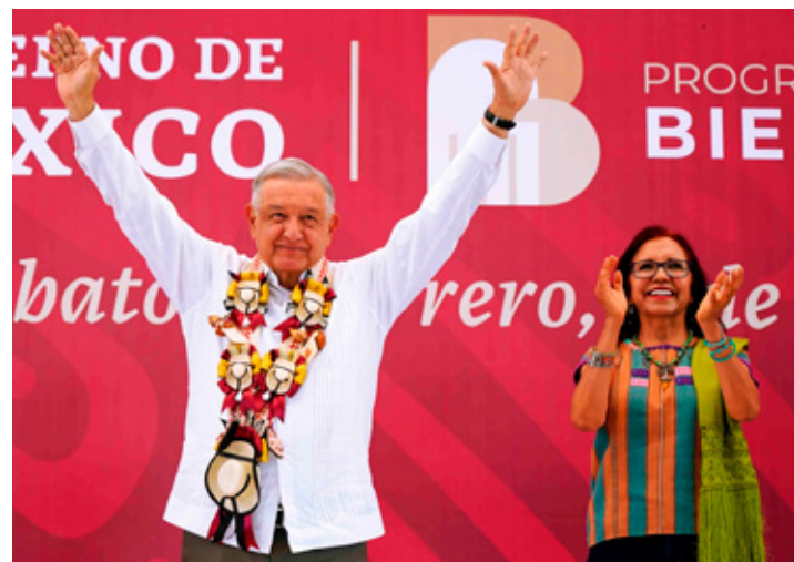
■ El presidente AMLO criticó el modelo privatizador del neoliberalismo.

"Todos estamos obligados a respetar su autonomía para tomar decisiones al interior, sin presiones ni intromisiones", indicó a través de sus redes sociales.