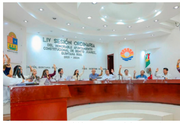
En Benito Juárez se aprobó la reestructura de la Secretaría General.

Asimismo, se estará fortaleciendo a la Dirección de Gobierno al centralizar algunas de las funciones que la Subsecretaría y la Dirección de Enlace tenían y que estaban duplicadas entre estas tres dependencias, con lo que esperan tener una mejor coordi-