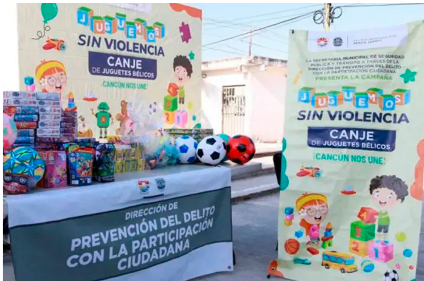
El canje de juguetes bélicos en Cancún ya rebasó las 2 mil unidades.

Ya rebasaron las 2 mil unidades en el cambio