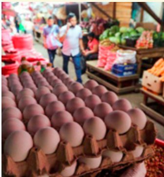
El CCE vislumbra aumento en canasta básica por incremento al salario mínimo.

De acuerdo con la Comisión Nacional de Salarios Mínimos, el salario mínimo general pasa de 207.44 a 248.93 pesos diarios; mientras que en la Zona Libre de la Frontera Norte pasa de 312.41 a 374.89 pesos diarios. Esto representa un incremento de 20 por ciento en ambas zonas salariales.