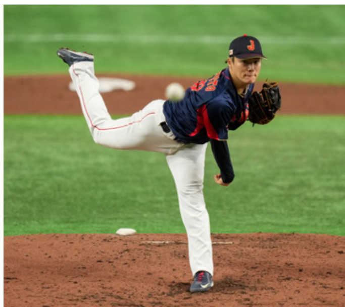
Los Dodgers deberán ajustar sus finanzas si quieren juntar a las estrellas de Japón.

Con la ex estrella de Anaheim fuera del mercado, Yamamoto se convierte en la prioridad de todos. Según MLB Network, Los Ángeles deberán hacer una maniobra importante en su impuesto de lujo, si quieren al pitcher, quien