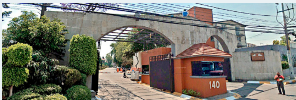
■ Palo Solo 140, Torre O-4, Colonia Jesús del Monte, Huixquilucan.

Un juez le negó a René Gavira Segreste llevar en libertad su proceso por la presunta compra ilegal de títulos bursátiles con valor de 700 millones de pesos con dinero de Liconsa debido a que, entre otras razones, tiene dos domicilios en los que no fue localizado.