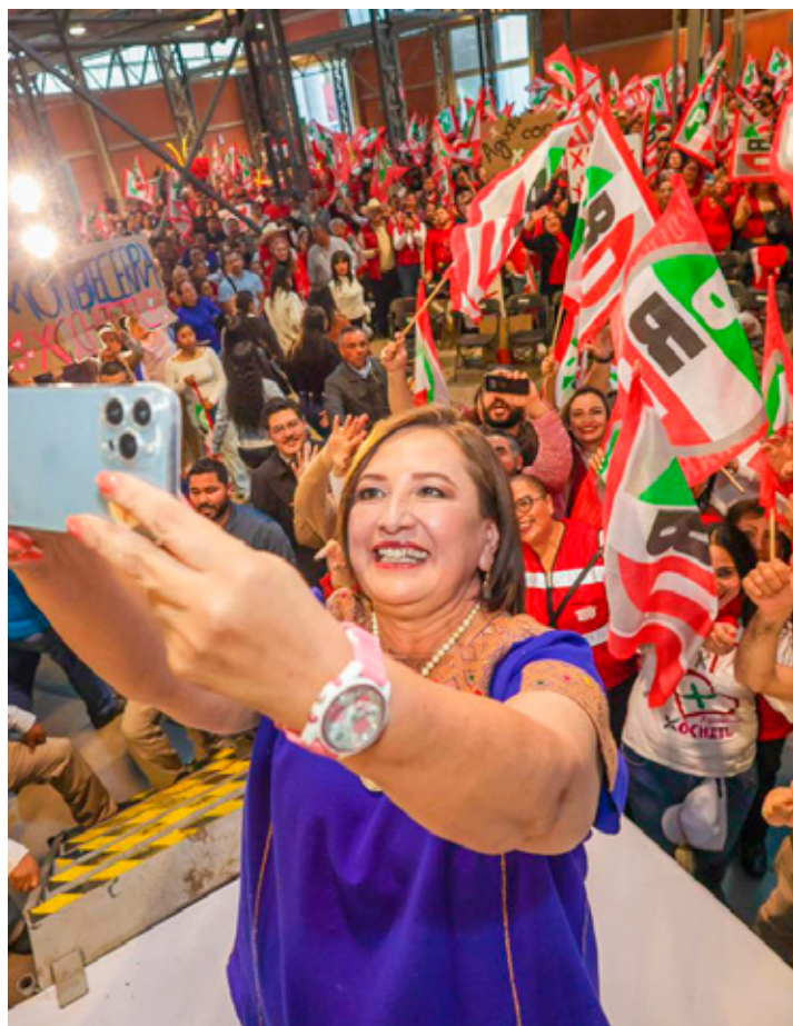
■ Xóchitl Gálvez, rodeada de priistas y panistas en un evento en Aguascalientes.

lientes se va a ir al cielo", gritó la hidalguesa entre vivas de los asistentes.