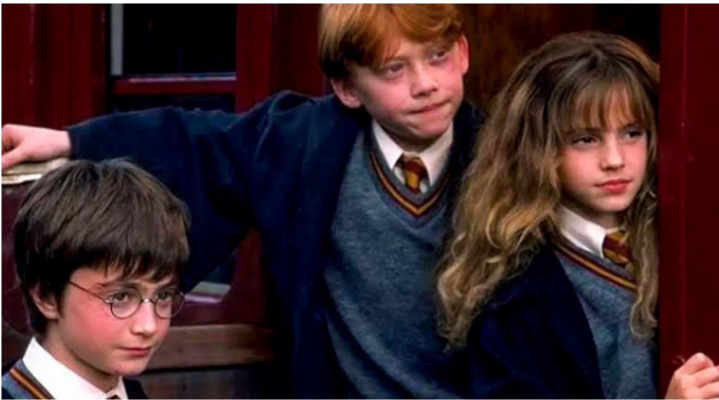
■ HBO anunció ayer el inicio del casting masivo e inclusivo para encontrar a los tres protagonistas de la nueva serie de 'Harry Potter'.