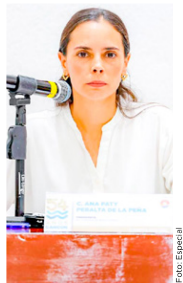
■Ana Paty Peralta dará su informe de gobierno el 17 de septiembre.