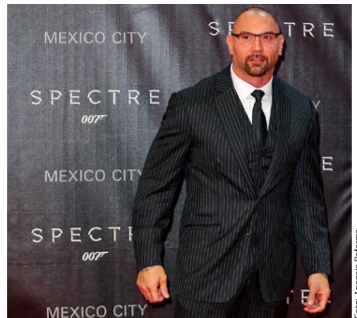
■ Bautista presentó otra cinta en la que actúa: The Last Showgirl.

"Lo más pesado que he estado fue en 167.8 kilogramos. Cuando comencé mi carrera como 'Deacon', pesaba alrededor de 147 kilos. Durante la mayor parte de mi carrera de luchador, pesaba alrededor de 131.5 kilos. Actualmente peso alrededor de 108 kilos", compartió el ex luchador.