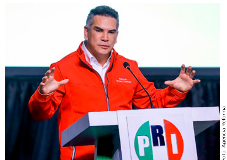
■ El INE va a avalar la reelección de Alejandro Moreno en el PRI.

La Dirección desoyó las decenas de quejas que priistas, entre ellas la de los expresidentes del tricolor, sobre que el partido no podía realizar reformas cuando el proceso electoral no ha concluido.