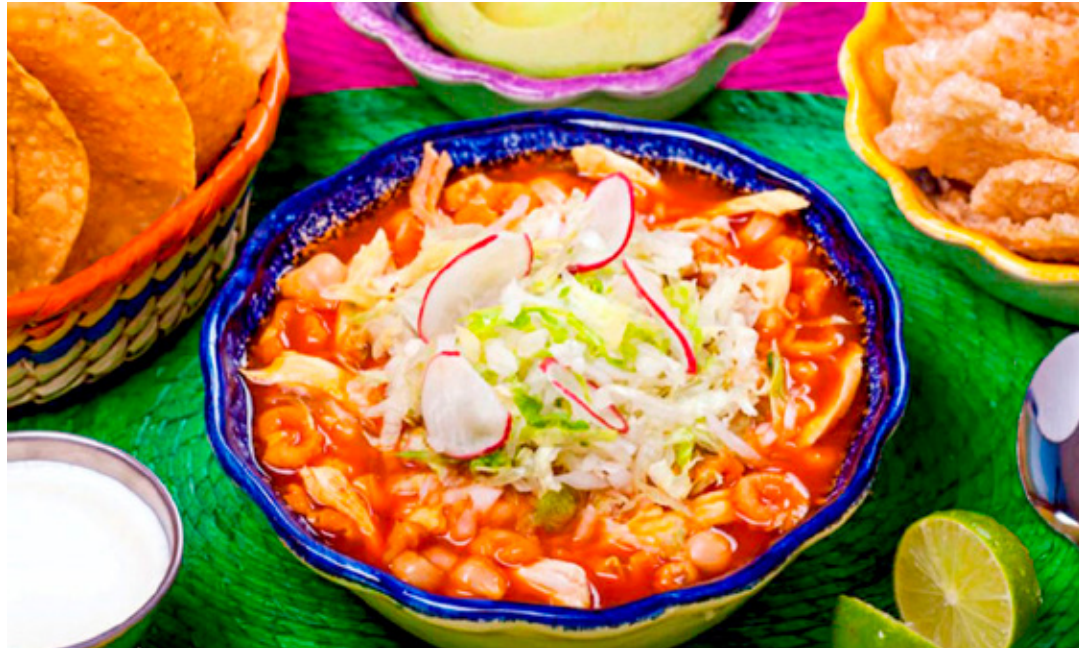
■Para este año el costo para el festejo del 15 de septiembre aumentó 20%.

"Esta opción de festejo es la que más se da, pues implica un gasto más o menos acotado y