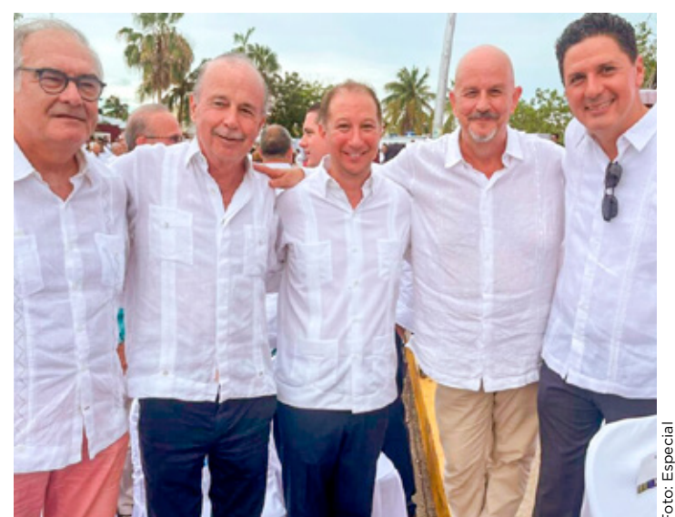
■El Consejo Hotelero del Caribe Mexicano pide frenar la reforma judicial.

Hay que mencionar que las Comisiones Unidas de Puntos Constitucionales y Estudios Legislativos del Senado —con el voto mayoritario de Morena, PT y Partido Verde— avalaron la minuta de la reforma al Poder Judicial del presidente Andrés Manuel López Obrador y se prevé que en las próximas horas sea turnada al Pleno para su votación.