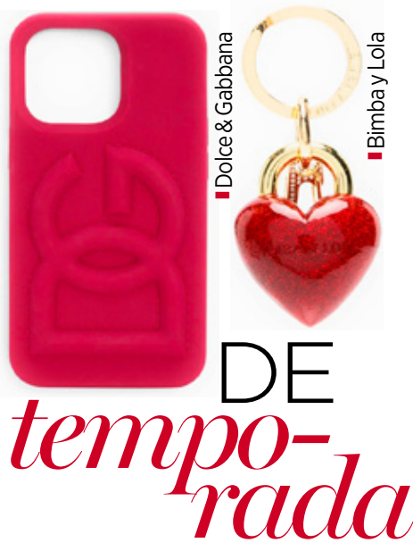
Dolce & Gabbana Bimby y Lola

DE temporada El borgoña será el color protagonista de este otoño-invierno. Desde en chamarras tipo motociclista, hasta en bolsos y accesorios, esta tonalidad es ideal para combinar con negro, blanco, beige o con el icónico 'animal print'.