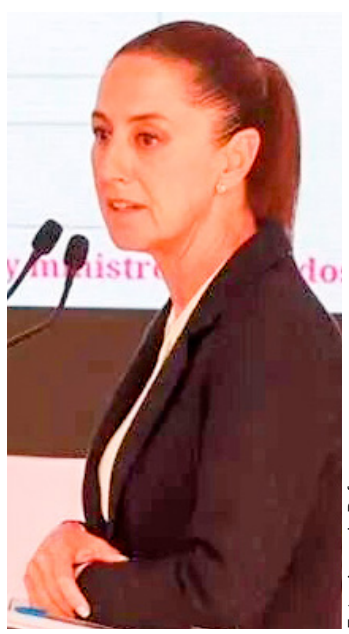
■ Claudia Sheinbaum calificó de ‘escandaloso’ el nepotismo en Poder Judicial.

“Sobre eso no opino, eso le corresponde al Congreso, que ellos definan cuántos senadores se requieren para tener mayoría calificada y que proceda la reforma constitucional”, añadió.