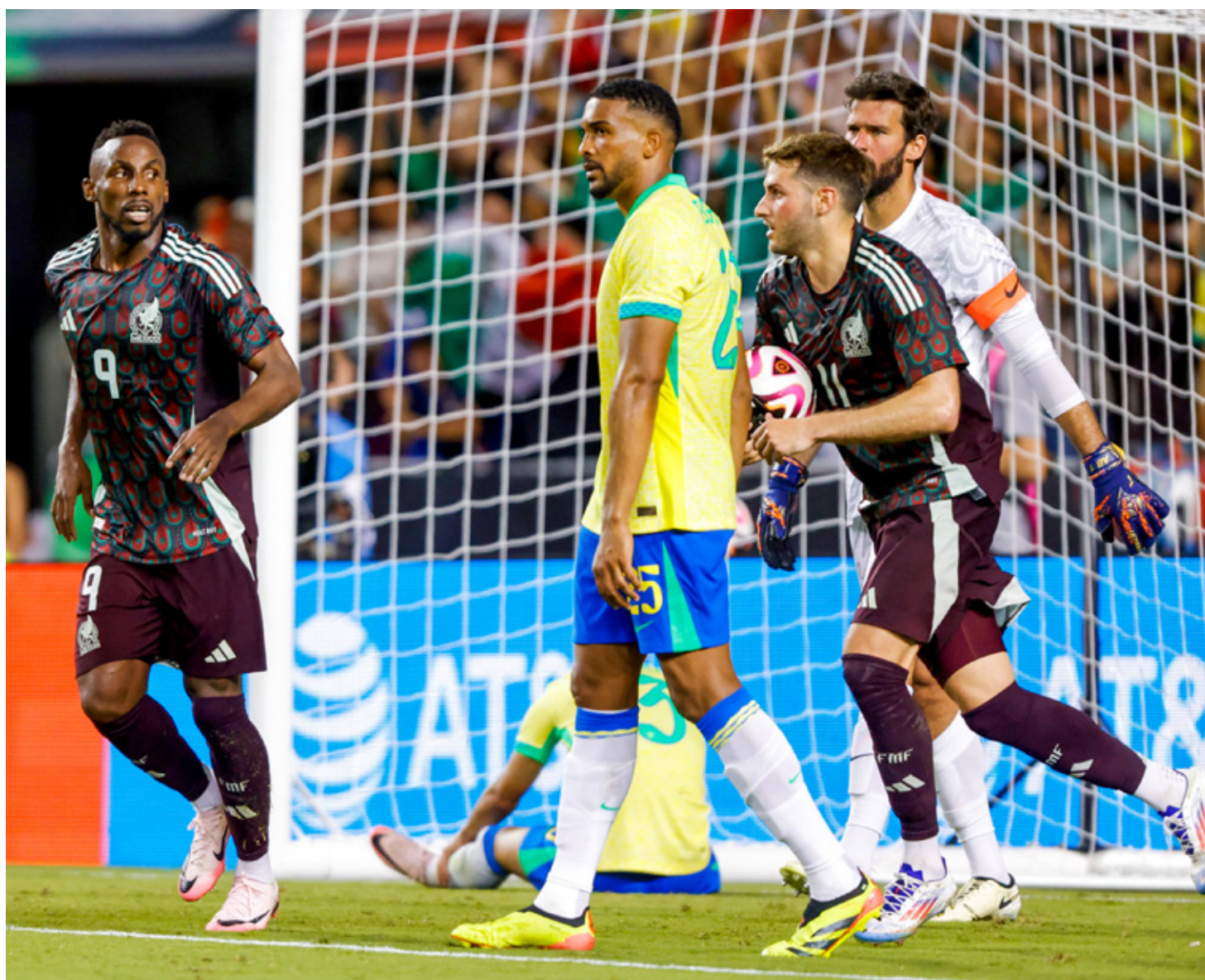
■ México no vence a un equipo del Top 30 del ranking mundial desde 2022.

Después figuran Azarenka y la francesa Caroline García, semifinalista el año pasado, como tercera y cuarta en la siembra.