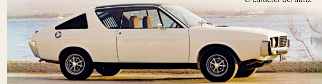
Se mantuvieron los rasgos distintivos del Renault 17 y se añadieron estilo y fluidez, sin alterar el carácter del auto.