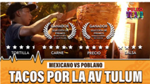
MEXICANO VS POBLANO TACOS POR LA AV TULUM