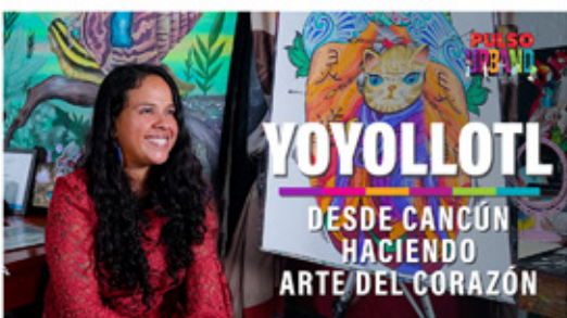
YOYOLLOTL DESDE CANCÚN HACIENDO ARTE DEL CORAZÓN