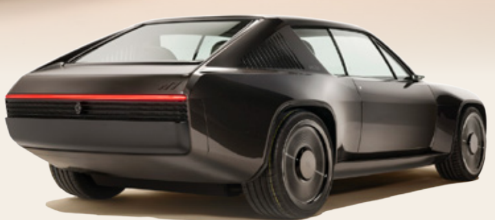
El chasis de fibra de carbono, mantiene el peso en sólo 1.4 toneladas.

R17 Electric Restomod por Ora Íto fue presentado en la Maison5, París. El prototipo se presentará en el Concurso Richard Mille de Artes y Elegancia de Chantilly, así como en el stand de Renault del Salón del Automóvil de París.