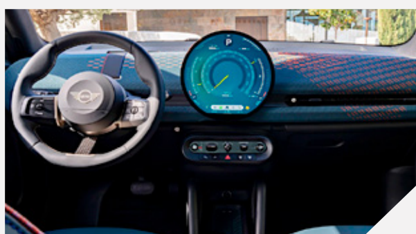
"iHey MINI!", es el asistente de voz inteligente de la marca.

El nuevo MINI Aceman tiene un precio de entrada de 749 mil pesos y para la versión SE es de 849 mil pesos.