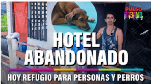
HOTEL ABANDONADO HOY REFUGIO PARA PERSONAS Y PERROS