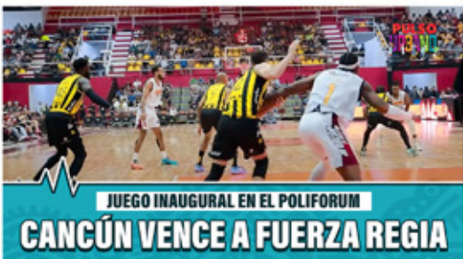
JUEGO INAUGURAL EN EL POLIFORUM CANCÚN VENCE A FUERZA REGIA