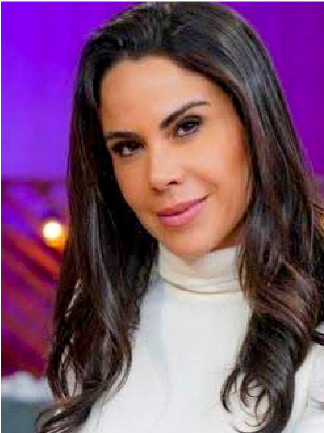
La conductora mencionó que tiene nuevos proyectos en el ámbito informativo, los cuales, al parecer, serán en otra televisora.

Aunque no dio detalles sobre sus nuevos planes, se dice que ahora estará en Imagen Televisión.