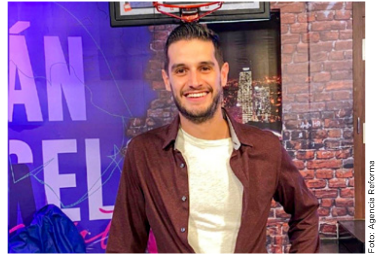
Adrián Marcelo reaccionó a la reciente cancelación de su show 'Hermanos de Leche' en la CDMX.