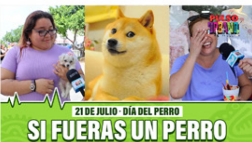
21 DE JULIO - DÍA DEL PERRO SI FUERAS UN PERRO