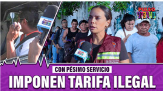
CON PÉSIMO SERVICIO IMPONEN TARIFA ILEGAL