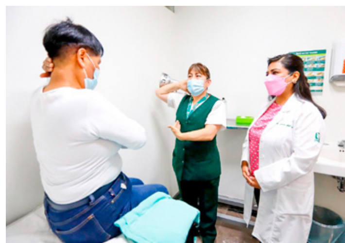
En el IMSS refuerzan acciones para prevenir el cáncer de mama.

Refirió que lo importante es que se detecte a tiempo y la autoexploración es una de las herramientas que tienen las