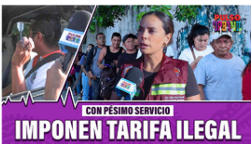
CON PÉSIMO SERVICIO IMPONEN TARIFA ILEGAL