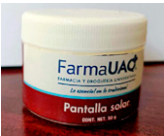
■ Los productos fueron desarrollados por la UAQ.

“Me queda claro que (el déficit) tiene relación con aspectos sociales también, y eso rompe otros conceptos que teníamos”.