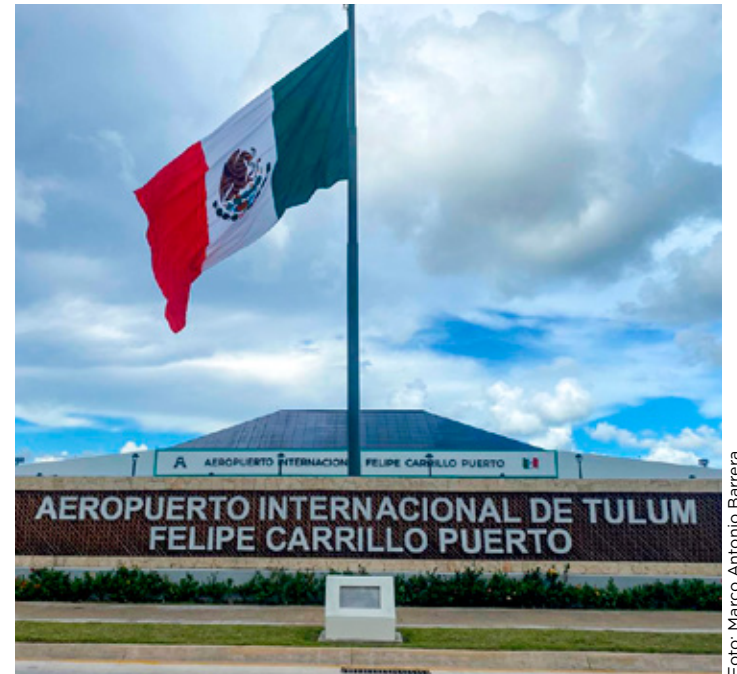
El aeropuerto de Tulum ha superado las expectativas para el primer año.

En la estadística se anota que las operaciones domésticas suman 3 mil 728 con 488 mil 300 pasajeros, mientras que del extranjero son de 3 mil 314 con 437 mil 886 viajeros.