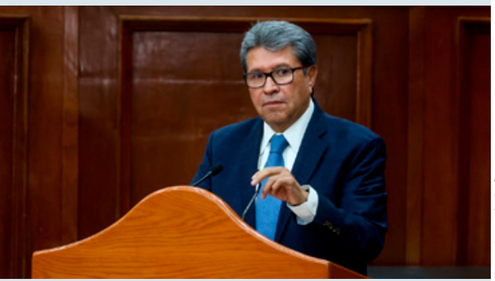
Ricardo Monreal dijo que trabajan en 10 leyes más de la reforma judicial.

"También son personas elegidas universalmente y también pasan este filtro de ser personas de prestigio, y desde personas con capacidad jurídica y técnica, y las sanciones que provee son de distinto tipo, desde un apercibimiento, amonestación o incluso hay destituciones cuando se comprueban causas graves en el ejercicio de la función, pero eso lo va a regular la ley reglamentaria", dijo.