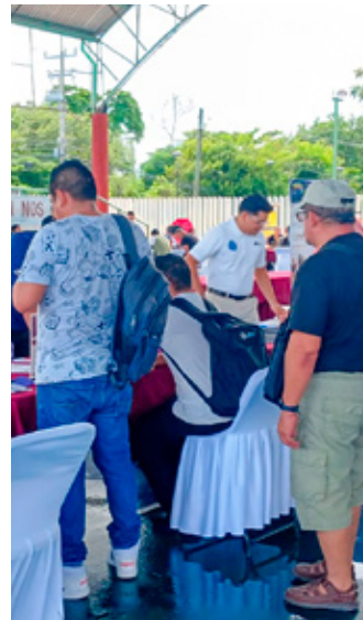
Inició la Feria Nacional por la Inclusión Laboral.

Al término de esta evaluación se entrega un certificado por parte del Servicio Nacional del Empleo con validez de un año, en el que se especifica la actividad que la persona puede realizar y de esta manera se le ayuda a insertarse en la vida laboral.