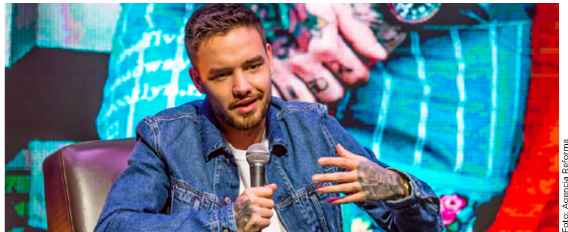
El cantante Liam Payne, ex miembro de la boyband One Direction, falleció tras caer desde el tercer piso de un hotel en Palermo, Buenos Aires.

Una patrulla de la Comisaria 14B asistió al llamado de emergencia, para que posteriormente los paramédicos confirmaran la muerte del músico británico.