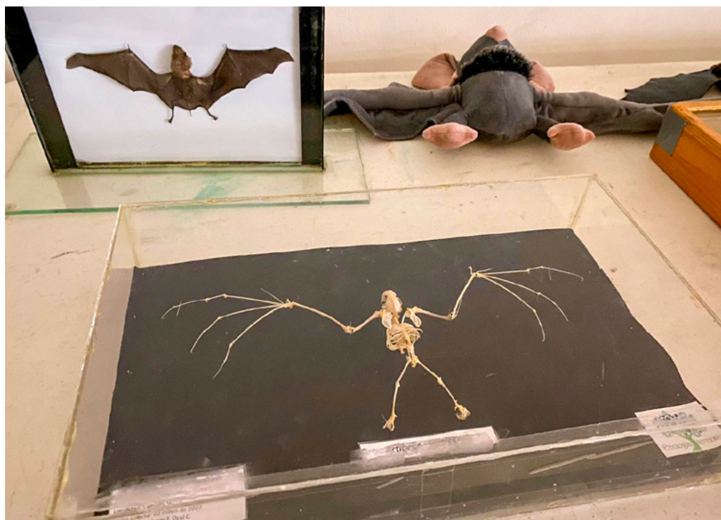
Se realizó el Primer Foro de Investigación de Murciélagos en Quintana Roo.

“Viene un proceso de cambio y ahorita estamos trabajando en alrededor de seis programas adicionales, que vienen del tema federal y estatal, que buscan poder atender sobre todo las zonas irregulares, que es donde tenemos a no sólo menores sino adultos ya con este problema que no hemos podido atender”, finalizó.