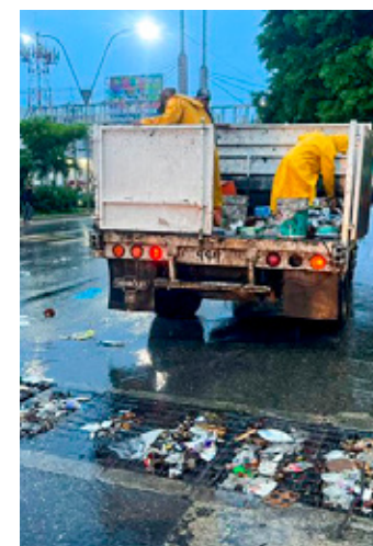
Brigadas de Servicios Públicos limpian rejillas y pozos de absorción en Cancún.

“O sea, no siempre las mismas zonas se afectan, por eso es muy importante el seguimiento, los operativos, la coordinación y cuando se viene algún fenómeno de este tipo, las brigadas, pero momentáneamente el trabajo es permanente en todo el municipio”, expresó.