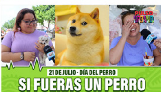
21 DE JULIO - DÍA DEL PERRO SI FUERAS UN PERRO