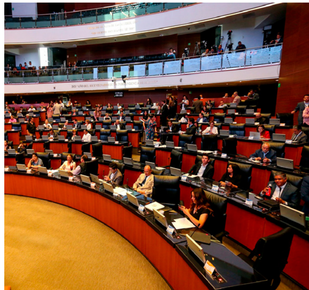
Pedirán presupuesto al gobierno federal para la elección de juzgadores.

"Las empresas estadounidenses manifestaron que lo que necesitan para traer sus inversiones a México es que haya reglas claras, certidumbre jurídica, respeto al Estado de Derecho y, en ese sentido, hubo compromiso de la presidenta de que se va a respetar la ley, que va a haber Estado de Derecho y que sus inversiones estarán seguras en México", destacó.