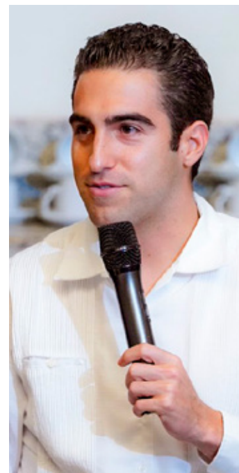
El senador Eugenio Segura impulsa que haya recursos para promoción turística.

A nivel nacional, la tasa de mortalidad en mujeres de 20 años y más por cáncer de mama fue de 17.9 por cada 100 mil. Sonora tuvo la tasa más alta (27.5) y Campeche, la más baja (9.9), mientras que Quintana Roo registró 13.4.