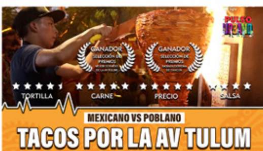
MEXICANO VS POBLANO TACOS POR LA AV TULUM