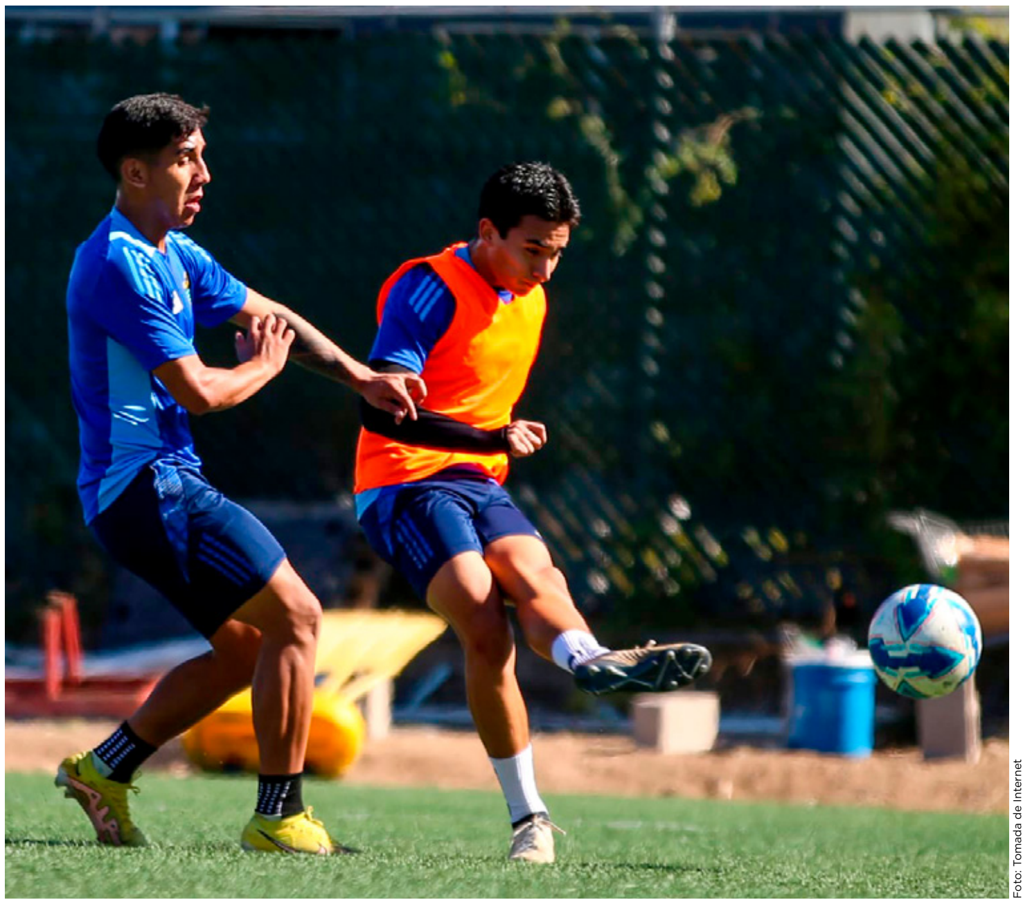
■ Los cancanenses dejaron ir su oportunidad de clasificar luego de perder ante Dorados a media semana.

La Jornada 15 también podría definir al campeón de goleo, por ahora Vladimir Moragrega del Atlante es el líder con 10 dianas, el atacante de Cancún FC José Rodríguez cuenta con siete tantos y está empatado en segundo lugar con otros tres jugadores.