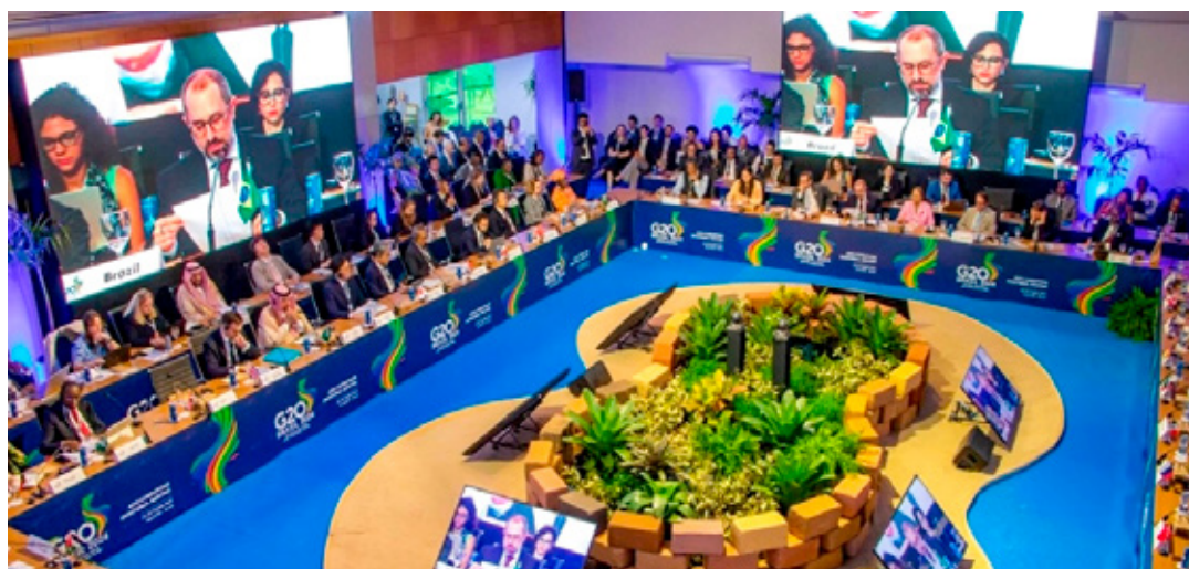
La presidenta Sheinbaum sí estará en reunión del G-20 en Brasil.