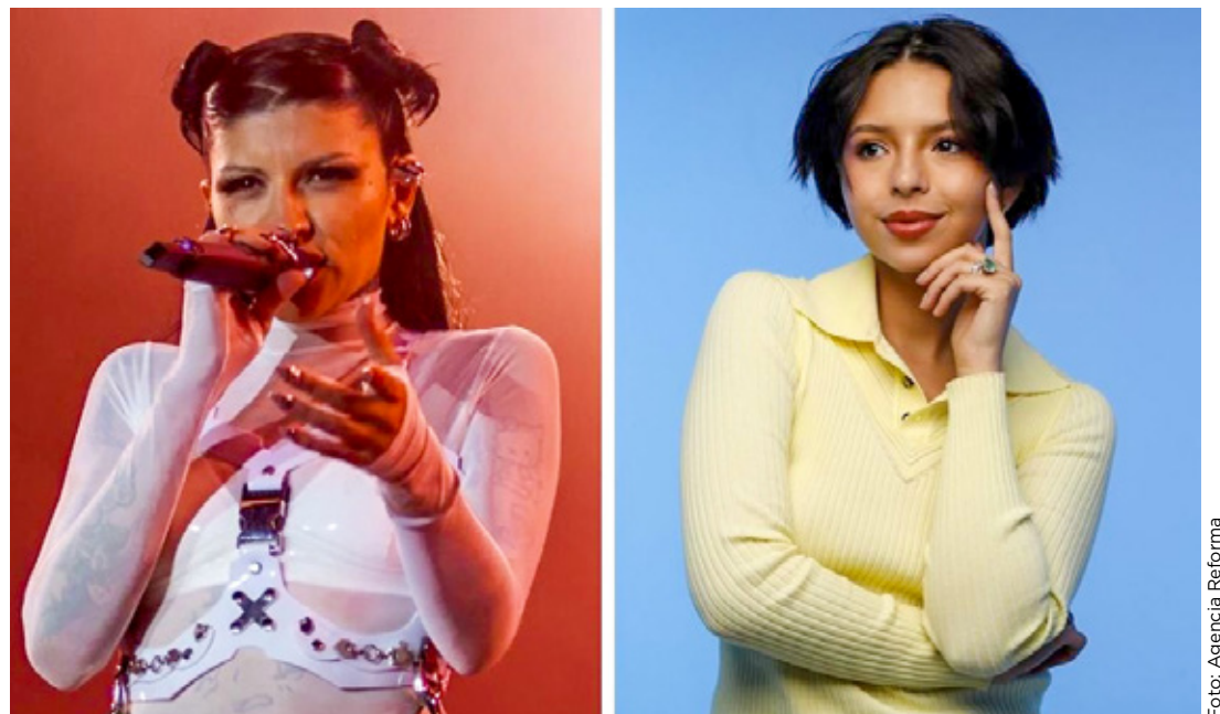
Cazzu habló por primera vez tras su ruptura con Christian Nodal.