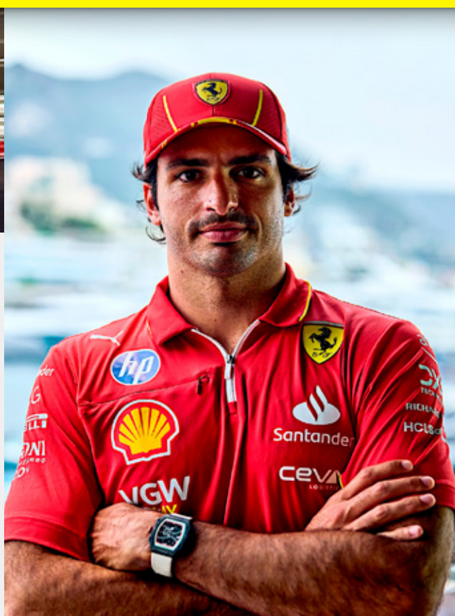
Más de 700 Grandes Premios han disputado juntos Shell y la Scuderia Ferrari.