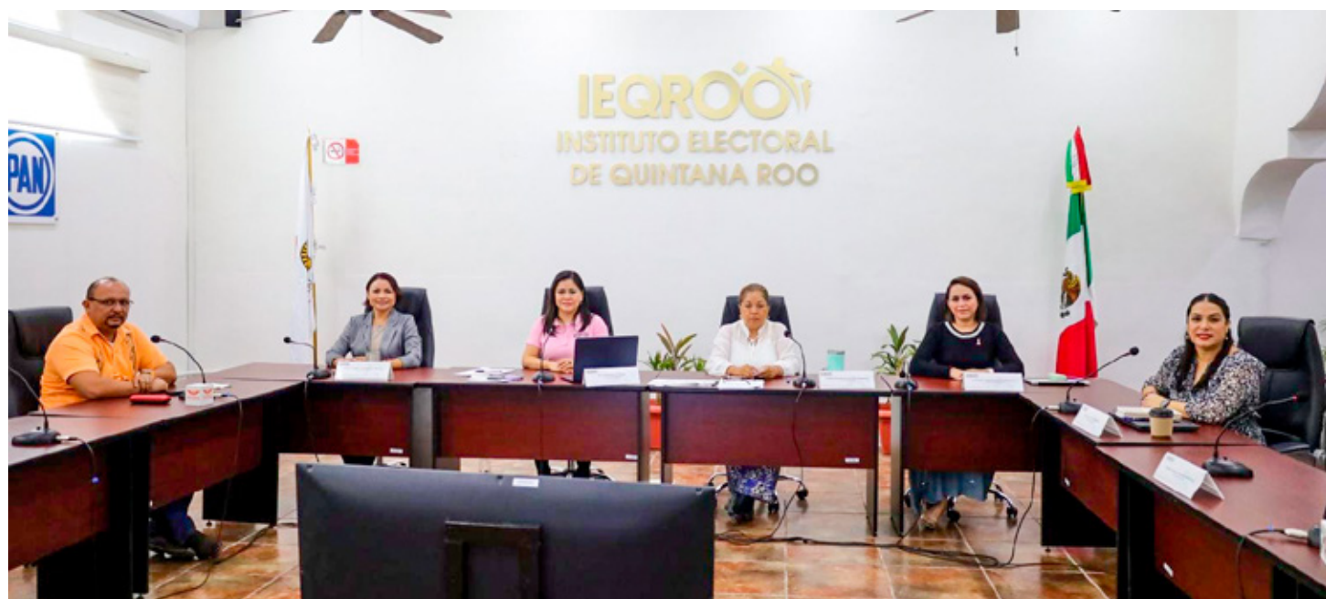
El Ieqroo aprobó el financiamiento público a los partidos políticos para 2025.