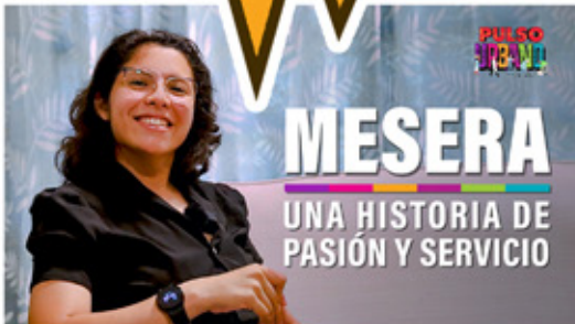
MESERA UNA HISTORIA DE PASIÓN Y SERVICIO