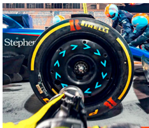
La firma italiana ha logrado un total de 321 victorias, 324 pole position y 329 vueltas rápidas.

Para alcanzar estos eficientes resultados, Pirelli realizó más de 10 mil horas de pruebas de interiores, así como 5 mil horas de