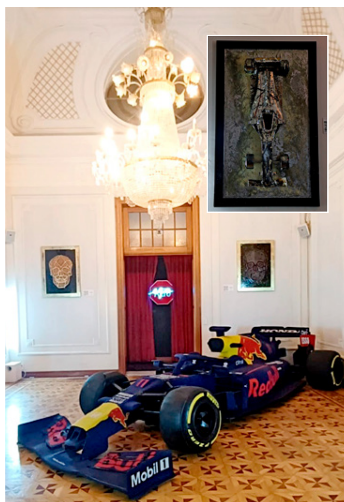
MONOPLAZA WIXÁRIKA... “El corazón de cada mexicano en la Fórmula 1”. Esta frase representa la escultura hecha por 20 artesanos de Menchaca Studio a lo largo de 2 años, la cual se compone de más de seis millones de chaquiras destacando la firma del piloto mexicano, Sergio “Checo” Pérez. Esta obra monumental, que revaloriza el arte popular, está inspirada en la competencia de velocidad más importante realizada en el país, mostrando la riqueza cultural y artística de pueblos como los Wixárikas.

ta en neumáticos Pirelli, cuenta con 18 plantas de producción en el mundo, incluyendo la implementada en nuestro país en Silao, Guanajuato, donde se producen 25 mil llantas diarias para automóviles, vehículos eléctricos, SUVs y camiones ligeros.