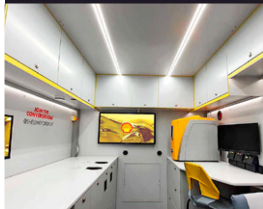
Shell V-Power comparte el 99% de los componentes utilizados por Scuderia Ferrari en la F1.