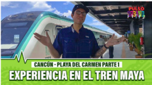
CANCÚN - PLAYA DEL CARMEN PARTE I EXPERIENCIA EN EL TREN MAYA