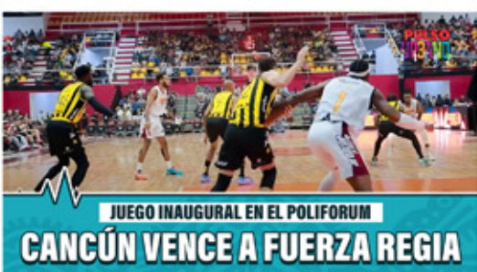
JUEGO INAUGURAL EN EL POLIFORUM CANCÚN VENCE A FUERZA REGIA