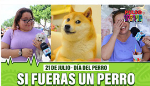
21 DE JULIO - DÍA DEL PERRO SI FUERAS UN PERRO