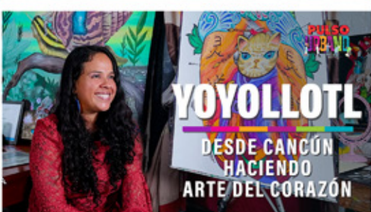
YOYOLLOTL DESDE CANCÚN HACIENDO ARTE DEL CORAZÓN