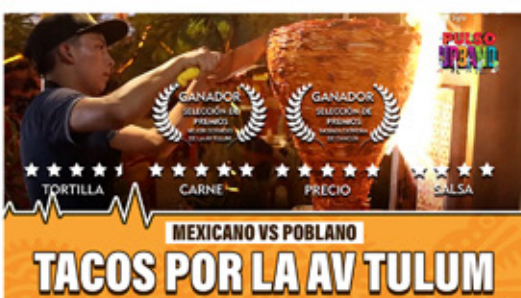
MEXICANO VS POBLANO TACOS POR LA AV TULUM