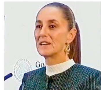
Claudia Sheinbaum defendió la supremacía constitucional.

"Todavía pienso yo —fijense que bien pensada soy— que hay ministros y ministras de esos ocho que van a recordar sus clases, su historia y cómo van a pasar a la historia, porque ellos saben que están tomando una decisión política, no jurídica, en contra del pueblo de México y a favor de ciertos grupos de interés y de sus propios intereses", agregó.