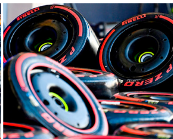
Pirelli ha participado en 480 Grandes Premios en la Fórmula 1.

simulación y más de 70 prototipos desarrollados virtualmente. Posteriormente, se crearon 30 especificaciones diferentes y fueron probados por los pilotos de la Fórmula 1 durante más de 20 mil kilómetros.