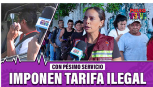
CON PÉSIMO SERVICIO IMPONEN TARIFA ILEGAL