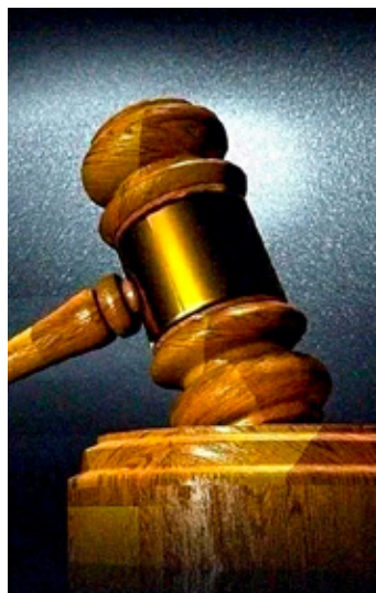
La mitad de jueces y magistrados declinaron participar en elección.

En su carta de dimisión, la magistrada afirma que la reforma agreda sus derechos y no puede ser parte de un modelo de designación inexplorado, cuyos resultados, en términos de los derechos y justicia, son absolutamente inciertos.