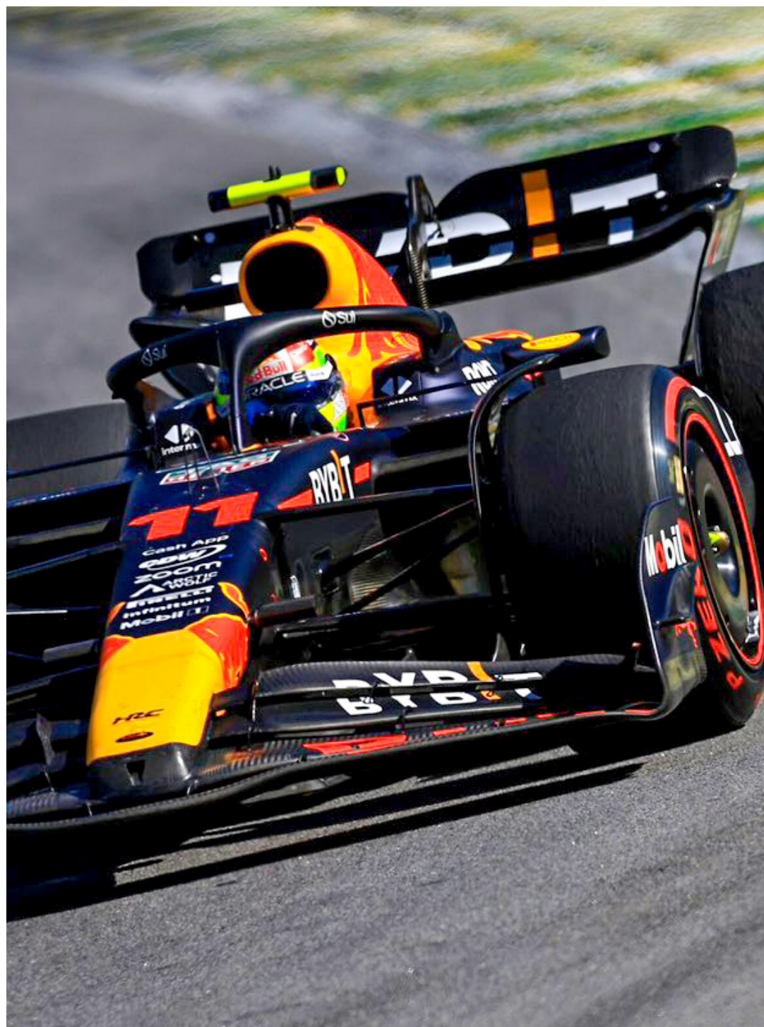
■ El piloto neerlandés señaló que los problemas de monoplaza complican tanto a él como al mexicano.