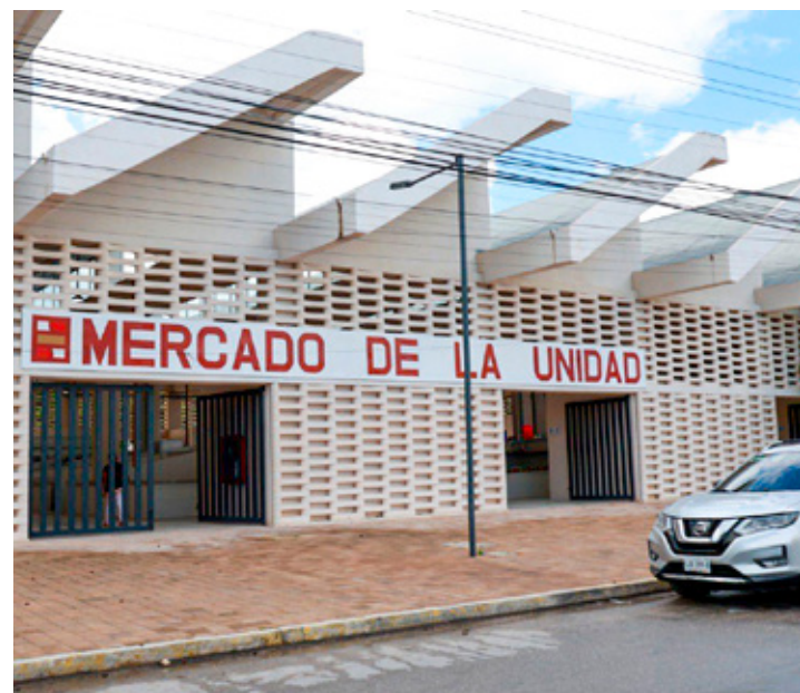
A mediados de este mes iniciará la renovación de locatarios en mercados.

Finalmente, apuntó que la Dirección se encuentra ya lista para esta labor, pues lo único que estaban esperando para comenzar era la aprobación en Cabildo del acuerdo delegatorio que permite a la Dirección firmar los contratos, así como su publicación en la Gaceta Oficial.