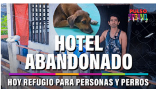
HOTEL ABANDONADO HOY REFUGIO PARA PERSONAS Y PERROS