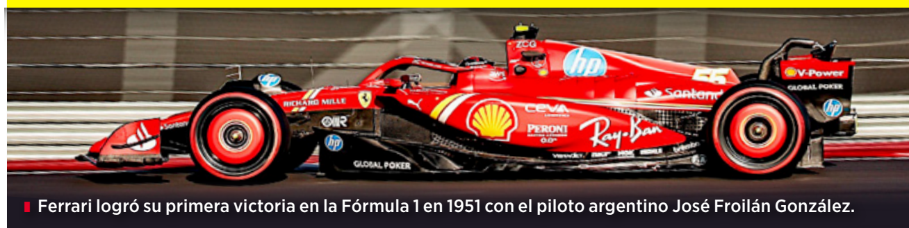
Ferrari logró su primera victoria en la Fórmula 1 en 1951 con el piloto argentino José Froilán González.