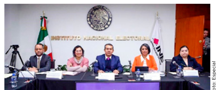
Se instaló la Comisión Temporal del INE para la elección judicial.

"El camino que tenemos por delante es difícil, pero las y los aquí presentes y a quienes me he referido sabemos bien a qué nos enfrentamos. Sabemos hacer