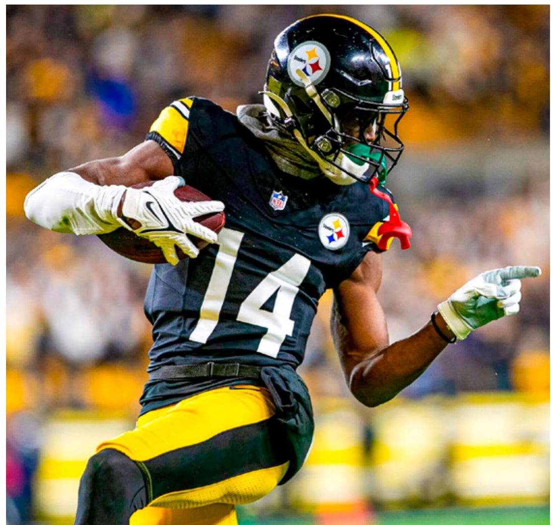
■ Los Steelers se han convertido en candidatos para ganar la Conferencia Americana.

Por ahora, en su último temporada con Ferrari, el español se ubica en el quinto lugar de la clasificación, con 244 puntos. Este año ha ganado en los circuitos de la Ciudad de México y Australia.