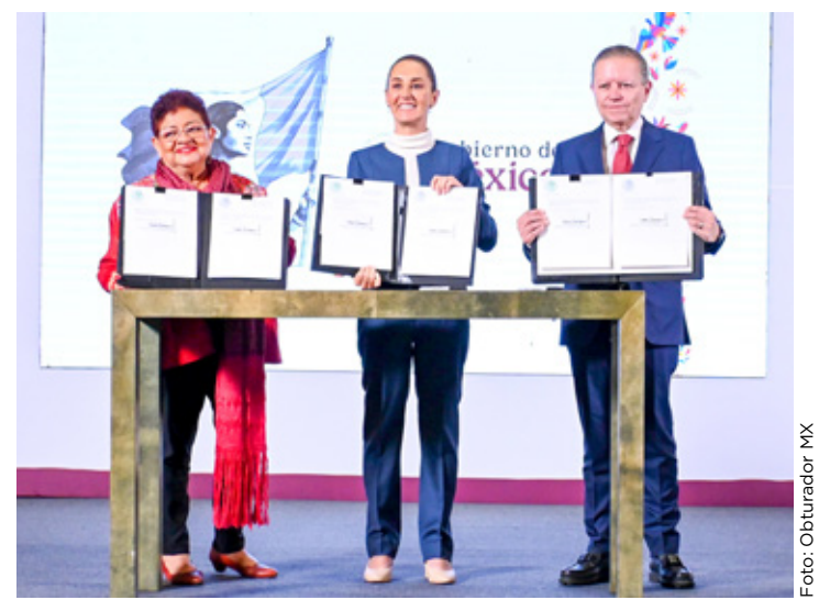
El Ejecutivo Federal envió al Congreso 3 leyes secundarias de la reforma judicial.

Destacó que desde que encabezó la pasada Administración y la actual, Acapulco cuenta con aguas más limpias, carros de limpieza propios y elementos de la Policía certificados. También afirmó que su administración está pagando deudas de periodos locales anteriores y que ya está al corriente con la CFE.