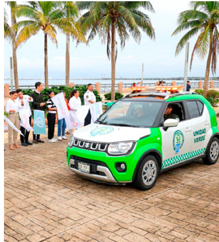
Seis 'Unidades Verdes' van a combatir basureros clandestinos en Cancún.

"Quiero dejar muy claro que no se trata sólo de aplicar sanciones, sino de proteger nuestro entorno y fomentar un cambio