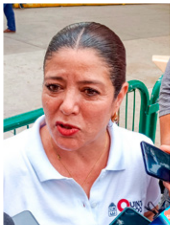
■ Xóchitl Carmona, subsecretaría de Atención a la Educación de la Zona Norte.

Finalmente, sobre las nuevas modificaciones a la venta de comida chatarra dentro de las escuelas, Carmona Bareño explicó que aún falta la presentación de los lineamientos bajo los cuales se estará aplicando la nueva reglamentación, algo sobre lo que están trabajando y que deberá quedar previo a la entrada en vigor el próximo año.