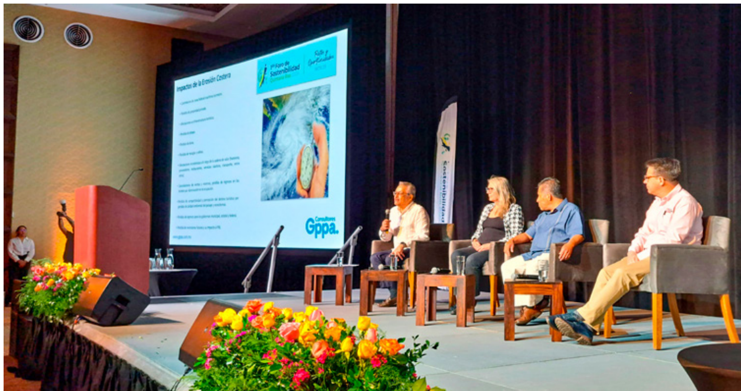
■ En el Foro de Sostenibilidad, Quintana Roo reafirma su compromiso con un desarrollo que privilegia la sustentabilidad.