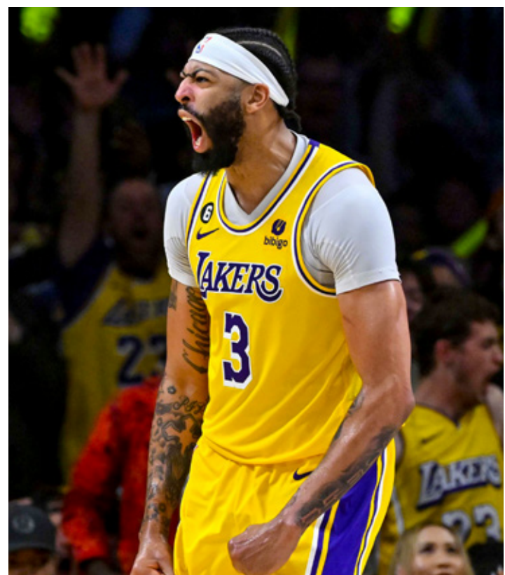
■ Anthony Davis es el segundo mejor anotador este año y el Magic tiene la menor cantidad de puntos permitidos.

El partido promete un resultado cerrado, pues en el primer encuentro que tuvieron este 2024, Lakers ganó por apenas tres puntos.