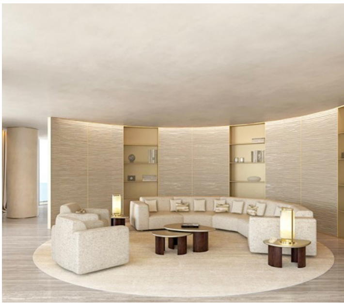
Formas circulares destacarán en la arquitectura e interiores.