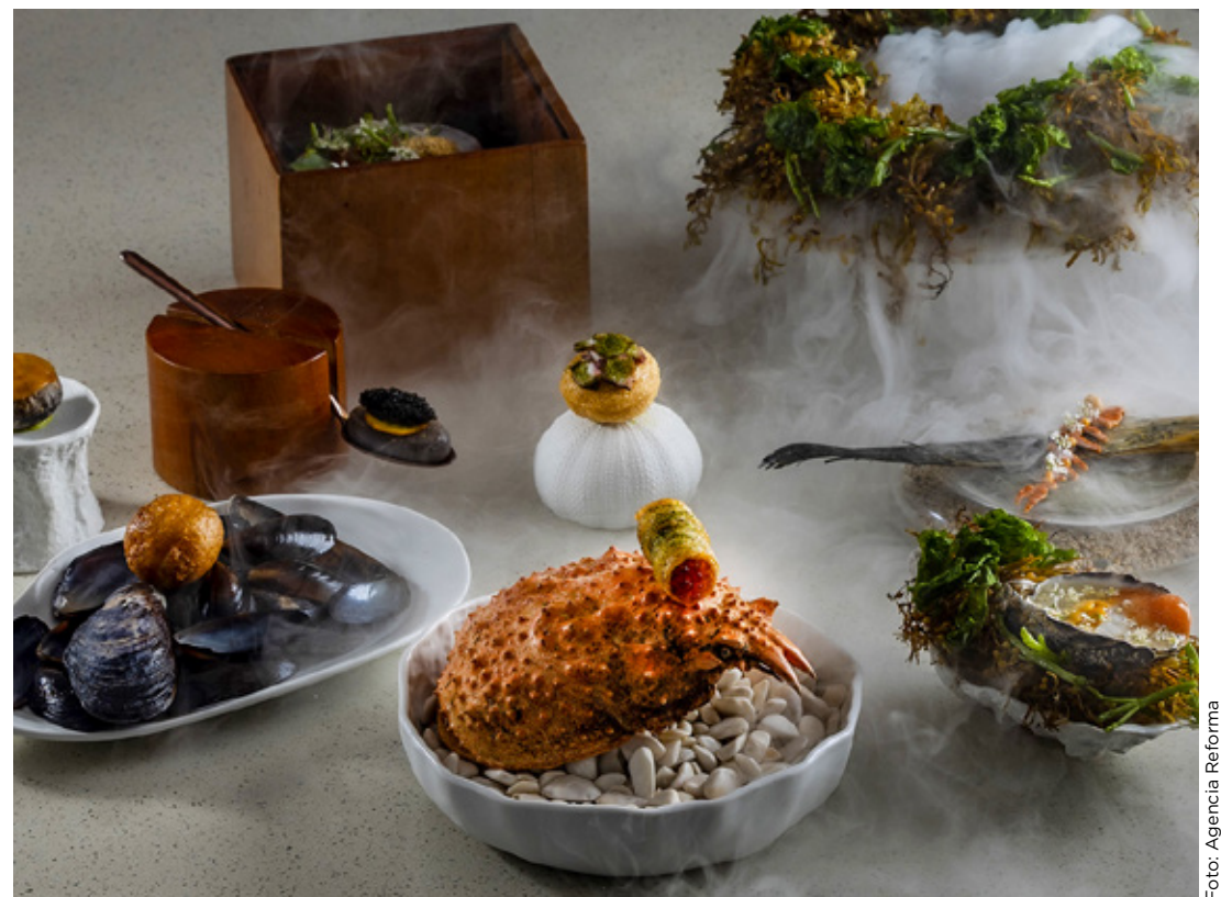
Revelan lista extendida de los Latin America's 50 Best Restaurants 2024, donde destacaron los cocineros mexicanos.

Cabe agregar que las ciudades de Santiago y Buenos Aires son las que tuvieron mejor desempeño con siete y cuatro restaurantes en la lista extendida, respectivamente. De otras ciudades como Bogotá, Lima, Ciudad