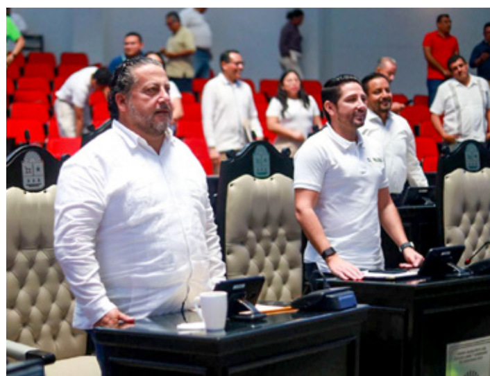
■ En el Congreso consideran prudente ampliar el plazo para el Paquete Económico.