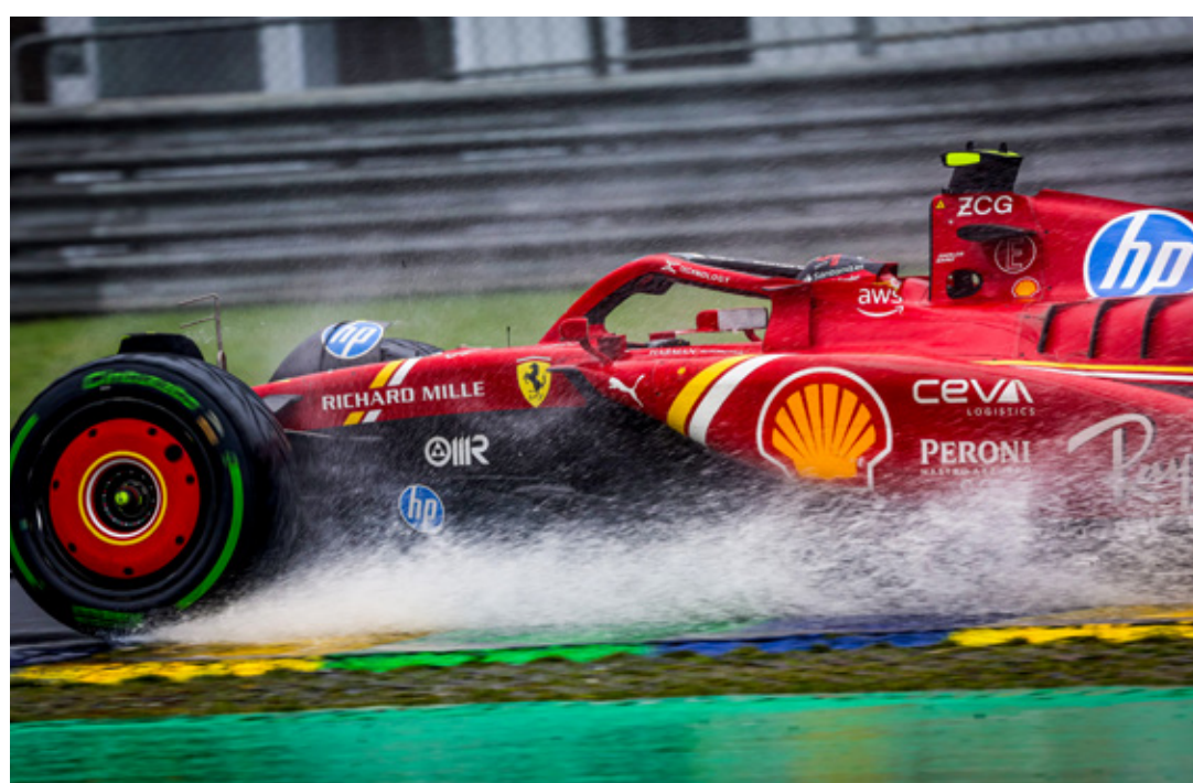
■ El piloto dejará Ferrari al finalizar el año y correrá para Williams en 2025.

Para Cleveland será un reto, porque sólo han ganado dos de los últimos cinco juegos ante Pittsburgh y apenas una de esas victorias ocurrió como local, en octubre del 2021.