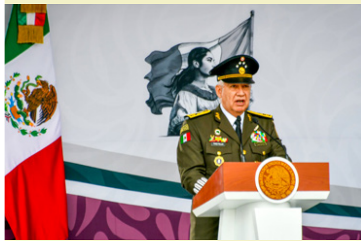
Ricardo Trevilla Trejo, titular de la Defensa Nacional.