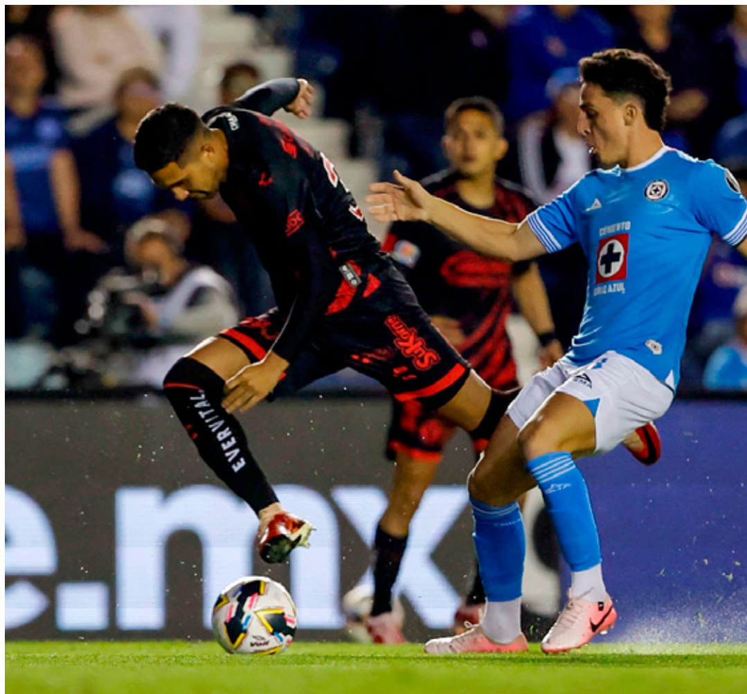
■ Cruz Azul y Tijuana se enfrentaron por última vez en la Jornada 3 de este torneo.

Ese miércoles, América ocupará el inmueble de la Ciudad de México, para recibir a Toluca en el partido de Ida a las 20:00 horas. En tanto que el encuentro de Vuelta también se llevará a