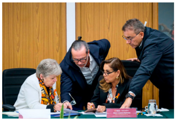
Mara Lezama y Alicia Bárcena (Semarnat) acordaron trabajar en conjunto.