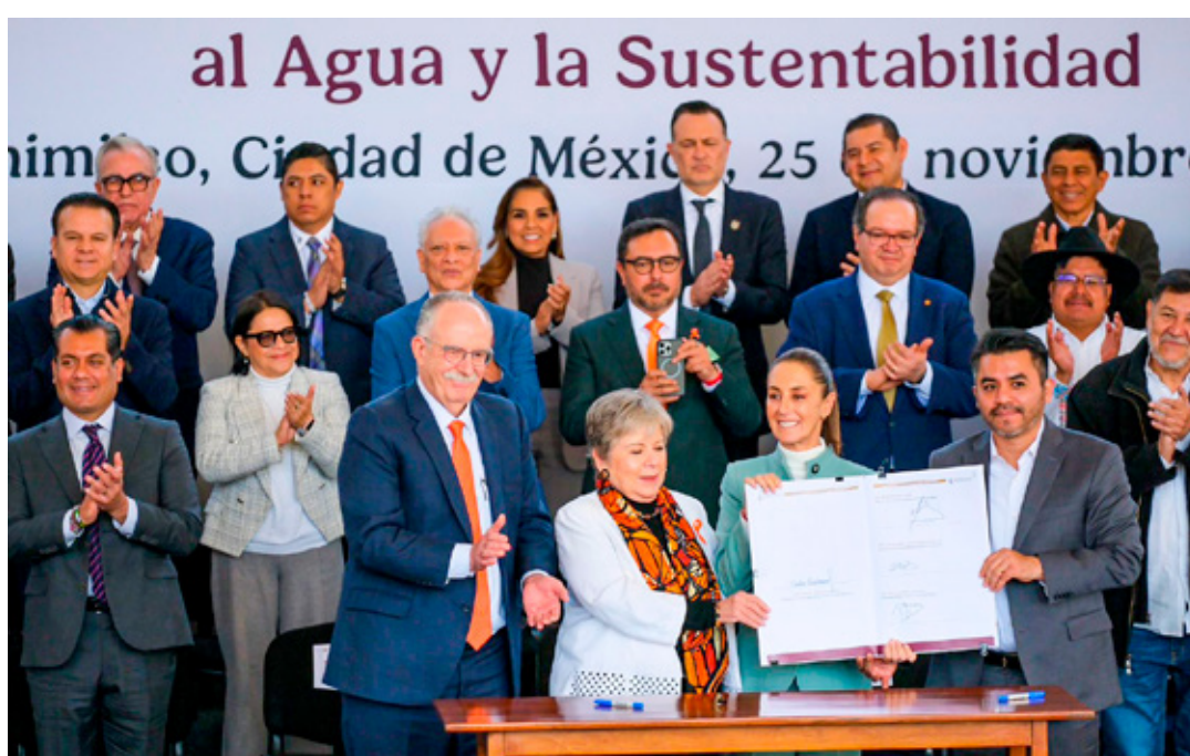
Claudia Sheinbaum reunió a mandatarios, legisladores y empresarios para el Acuerdo Nacional por el Derecho Humano al Agua y la Sustentabilidad.