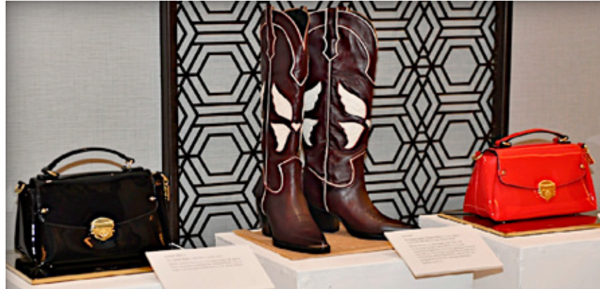
■ Se contó con una exposición de High Life y Calderoni así como de reconocidos diseñadores nacionales.