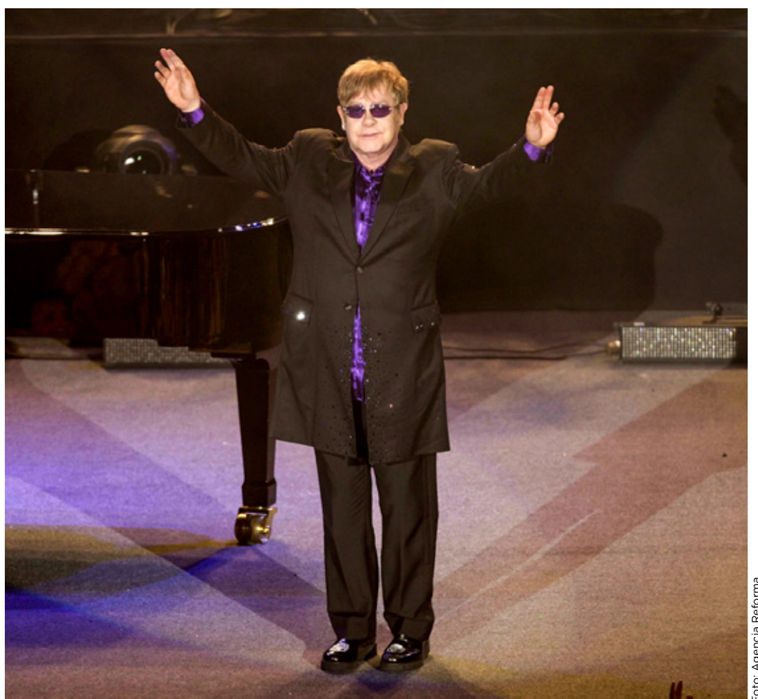
Elton John reveló que ya perdió la visión en su ojo derecho por una infección.

Pese a esto, el británico se encuentra muy activo, en unas semanas estrenará en streaming su nuevo documental Never Too Late , donde colaboró en una rola con Brandi Carlile, quien usualmente lo visita a él y a su esposo, David Furnish, al sur de Francia.