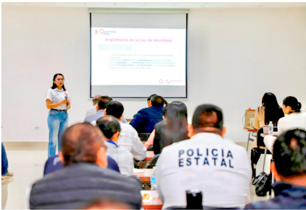
Comunicado del Instituto de Movilidad del Estado de Quintana Roo. 25 de noviembre de 2024.

Además, el curso no sólo impartió conocimientos teóricos, sino también fomentó el intercambio de experiencias entre participantes, quienes pudieron complementar sus casos prácticos con la normativa vigente.