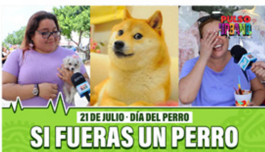
21 DE JULIO - DÍA DEL PERRO SI FUERAS UN PERRO