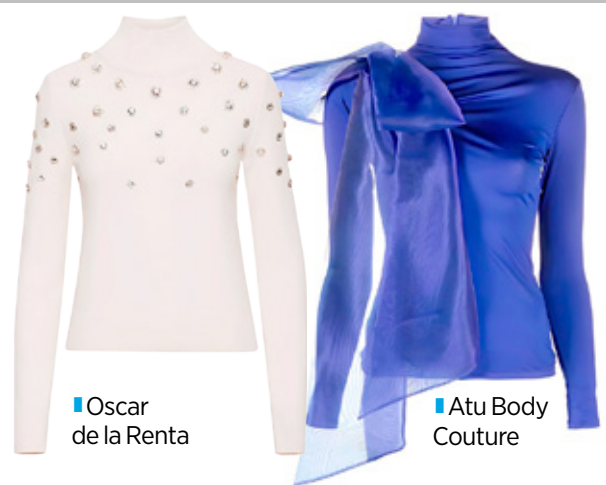
Oscar de la Renta