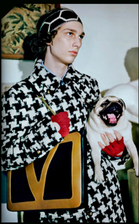
Algunos looks tienen reminiscencias de los años 70 y las bolsas con el logo V.

Una colección basada en el arte, la imaginación, la elegancia y la opulencia, que queda plasmada en varias de las películas de Fellini, quien, como Roma, se volvió eterno.