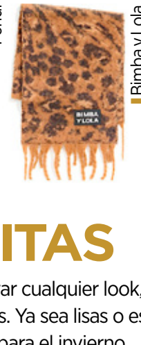
Bimba y Lola