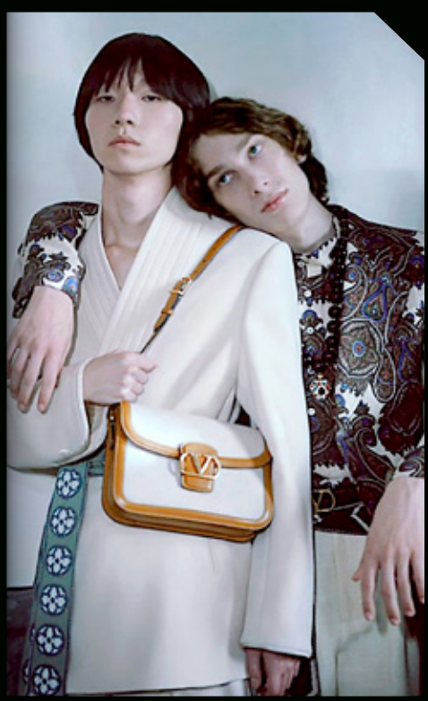
Cortes elegantes y estampados vanguardistas para mujeres poderosas.