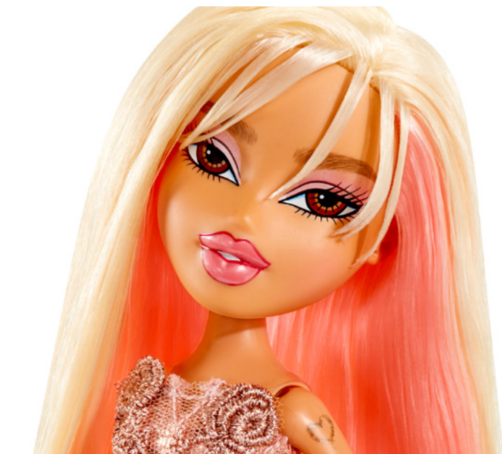
Una muñeca Bratz inspirada en el look de Karol G en los Premios Grammy de 2023, llegará a los estantes a partir del 3 de diciembre.