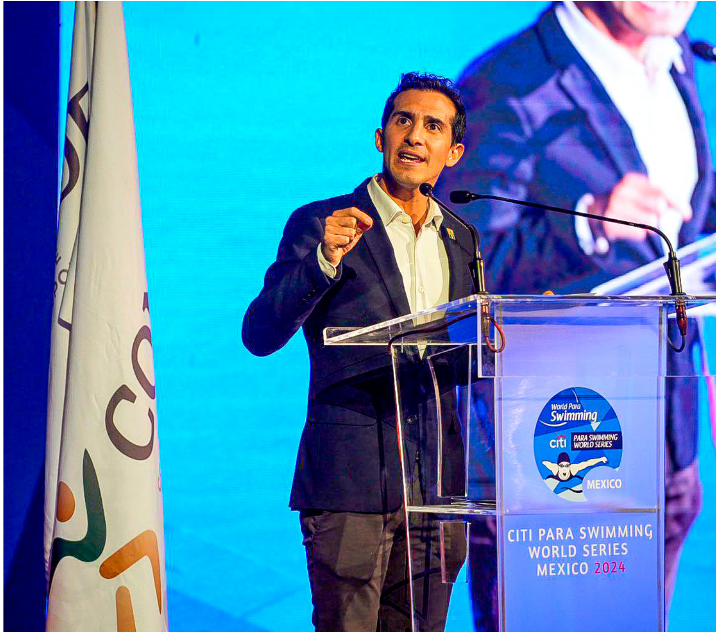
■ El objetivo es que los atletas en deportes acuáticos puedan competir en torneos internacionales.

Sin embargo, hace dos semanas, Todorov convocó al Campeonato Nacional de Invierno (primero apoyado por las autoridades de Jalisco que después recularon), y hace tres días, cambió la sede a Morelia con el respaldo del Gobierno de Michoacán.