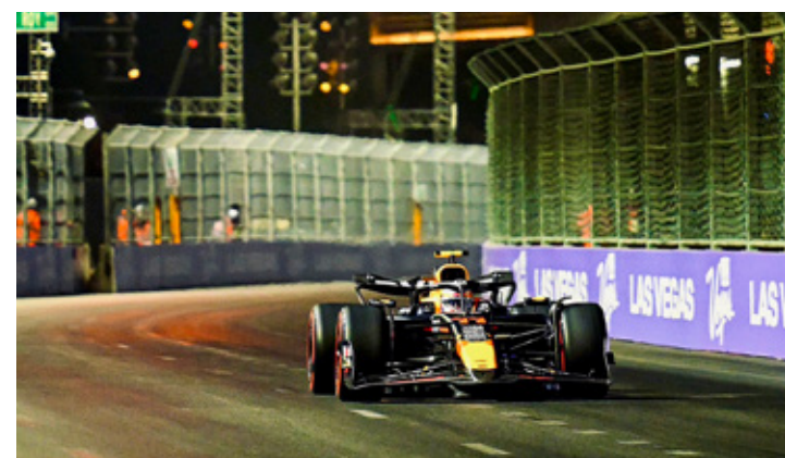
■ El asesor de Red Bull expresó su molestia por perder el Campeonato de Constructores.

Ahora todo lo que queda para Red Bull es tratar de pelear por el subcampeonato de pilotos con Ferrari y terminar el 2024 de una manera decorosa, a falta de las carreras en Qatar y Abu Dhabi.