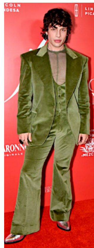
■ El cantante Leo Rizzi.