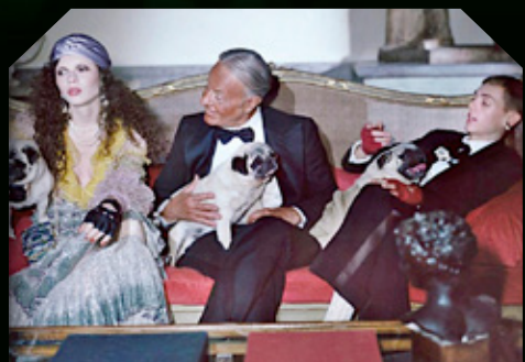
Piezas extravagantes para el día y la noche.