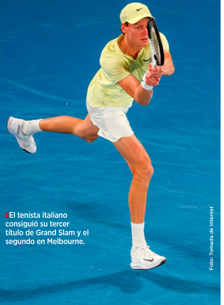
El tenista italiano consiguió su tercer título de Grand Slam y el segundo en Melbourne.

"Hoy (Sinner) me ha superado por completo, desde el fondo de la pista me vació por completo. Como dije, creo que hoy saqué mejor que él, pero eso es todo. El resto de las cosas las hizo mejor que yo. Al final el tenis tiene cinco o seis golpes capitales, unos factores determinantes y ahí estuvo mejor que yo. Esa es la razón por la que me ganó, así que lo ha merecido", reconoció Zverev, quien sigue sin sumar un Grand Slam a sus vitrinas.