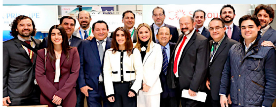
■ Delegación yucateca en FITUR, representando las riquezas gastronómicas y turísticas del Estado.

Cabe agregar, que el pabellón del estado en FITUR es uno de los más visitados y ofrece recorridos por cenotes, zonas arqueológicas y una oferta gastronómica única.