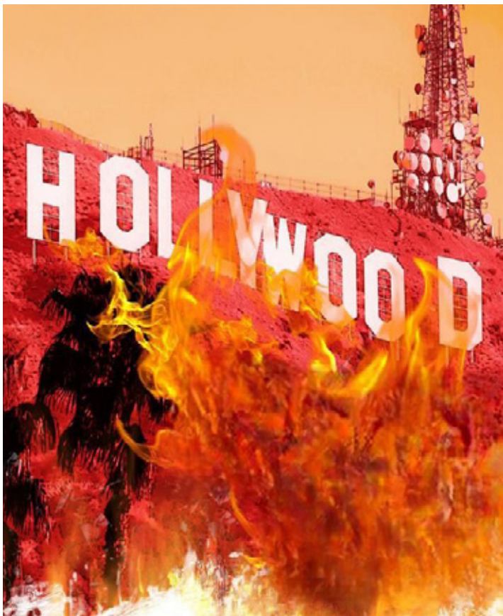
Incendios en California dejan en incertidumbre el futuro de Hollywood.