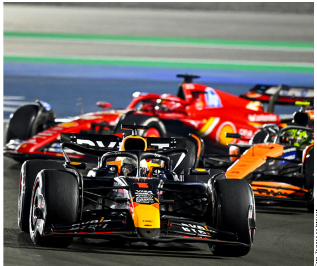
El piloto neerlandés ha despertado el interés de equipos como Aston Martin y Mercedes.

"McLaren y Ferrari. Ambas escuderías tuvieron la mejor base con sus coches la temporada pasada y rindieron bien en la mayoría de los circuitos. Pueden basarse en eso", advirtió Marko.