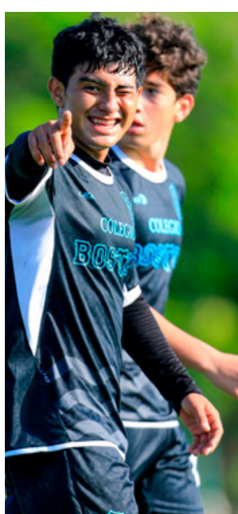
Los equipos de la Tercera División Profesional se mantienen en el Top 5 de la clasificación.

El Caesars Superdome está listo para ser la sede del Super Bowl el próximo 8 de febrero. Para saber qué equipos jugarán por el título de la NFL consulta el portal de lucedselsiglo.com .