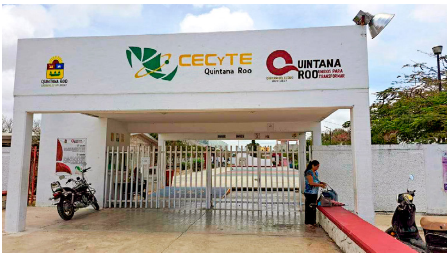
■ El gobierno estatal llegó a un acuerdo con trabajadores y se impidió la huelga.

Los reclamos de los trabajadores sindicalizados de estos subsistemas educativos de nivel medio superior forman parte del conflicto a nivel nacional en donde, junto con otros subsistemas de nivel medio superior, también reclaman estos conceptos salariales, y desde mediados de 2024 realizaron diversas movilizaciones como medida de presión.