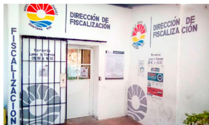
■ Fiscalización en Cancún hizo más de 32 mil inspecciones el año pasado.

En cuanto a cierres y aperturas de negocios, indicó que durante el 2024 se mantuvo una tasa positiva entre nacimiento y mortandad de estos entes comerciales, pues hubo entre 3 a 4 por ciento de nuevos emprendimientos arriba de aquellos que cerraron a lo largo del año pasado.