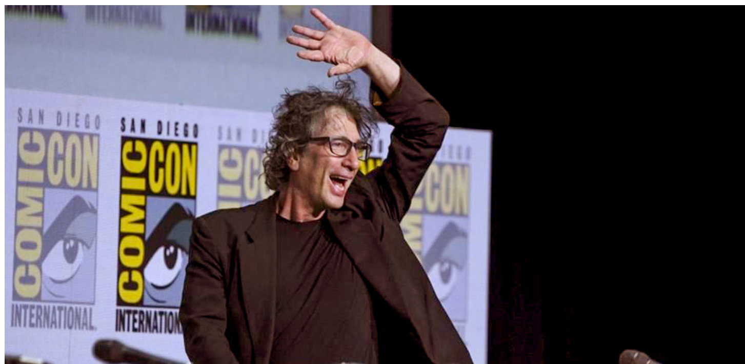
El escritor Neil Gaiman enfrenta tres demandas por agresiones sexuales.

Kanye, quien estaba nominado a Mejor Canción de Rap por "Carnival", y Bianca abandonaron la ceremonia después de su paso por la alfombra roja; se debate si fue voluntario o si los organizadores los sacaron.