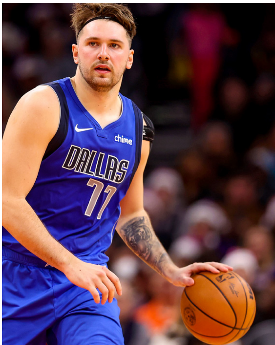
■ El jugador fue elegido por Dallas como la tercera selección global del Draft en 2018.