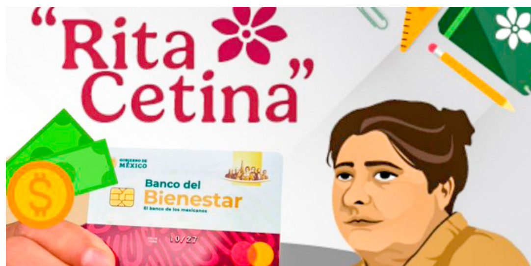
■ Se presentaron las becas 'Rita Cetina' en Quintana Roo.

Lo anterior, con la intención de hacer monitoreos de cuerpos de agua y estudios de la calidad en cuanto a colorimetría, oxigenación, la contaminación y todo lo que pudiera desprender, ya que esta situación fue detectada hace unas semanas.