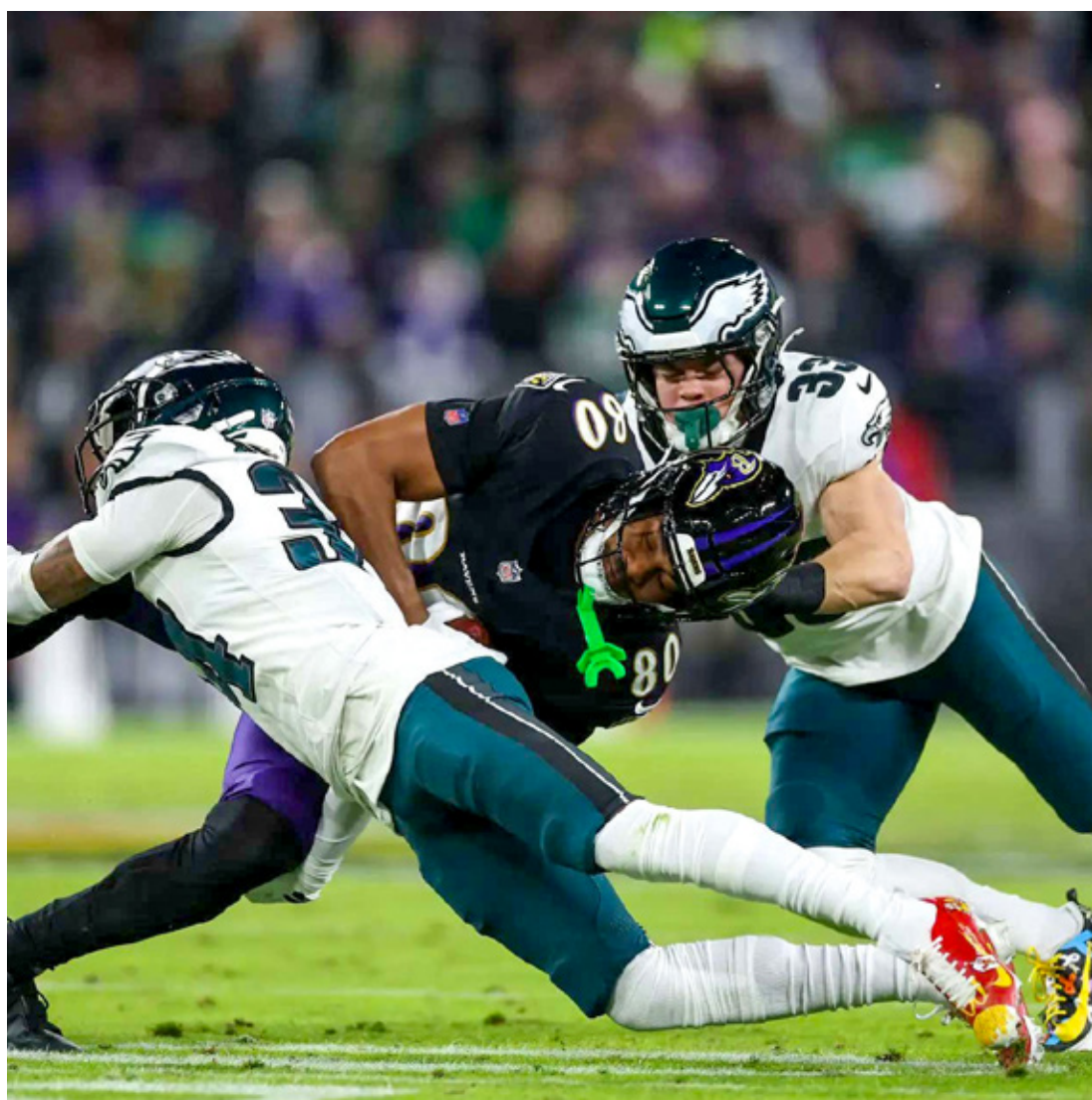
■ Ambas franquicias tienen más de un año sin perder contra equipos de la conferencia contraria.

El descalabro más reciente de Kansas City contra una franquicia de la NFC fue en diciembre del 2023, cuando perdieron 19-27 frente a Green Bay. En esa temporada, el equipo tuvo un récord de 2-3 frente a esta conferencia.