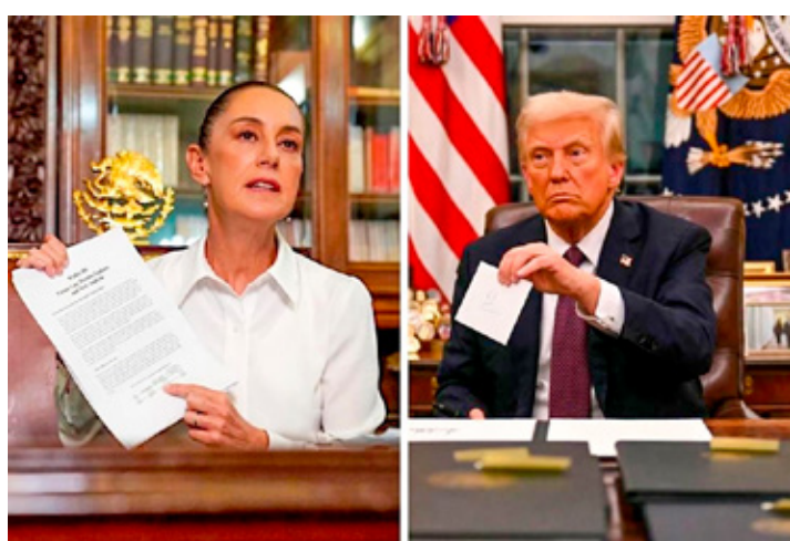
Finalmente, la comunicación entre Claudia Sheinbaum y Donald Trump resultó en acuerdos.

Y como en toda negociación, de ambos lados se debe ceder. Donald Trump aceptó posponer un mes la entrada en vigor de los aranceles de 25 por ciento, pero el gobierno de México despliega ya a 10 mil elementos de