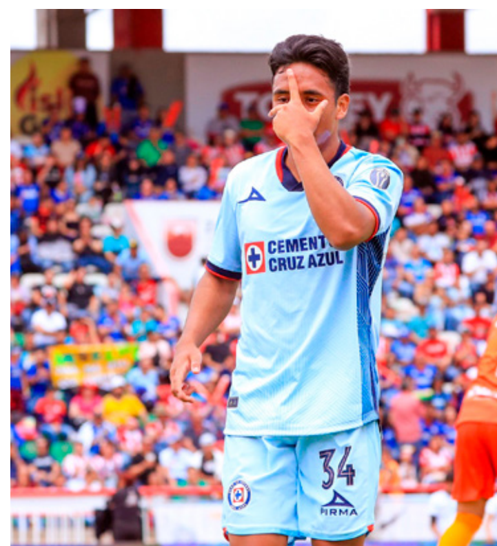
■ Cruz Azul visitará al Real Hope en el Estadio Cibao de República Dominicana.

Por ahora el esloveno no tiene fecha para regresar ya que está ausente por lesión desde diciembre.