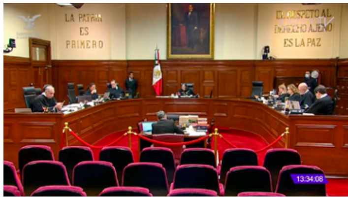
La Corte ordenó revocar todas las suspensiones dictadas contra la elección judicial.

Luego de más de cuatro horas de discusión, la Corte rechazó la actuación de los juzgadores que han llevado litigios relacionados con la reforma judicial, tanto los de amparo como los electorales, al resolver una consulta planteada, precisamente, por jueces