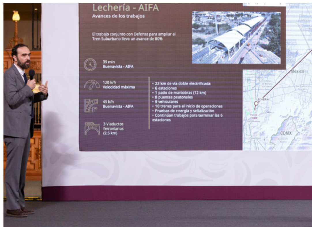
■ La Sedena se encarga ya del tren que llevará de CDMX al AIFA.

"Desde finales del periodo del presidente López Obrador y cuando nosotros entramos, tomamos la decisión ya conjunta, y nos toca operarlas a nosotros, de que esa obra la hicieran también los ingenieros militares, ya tuvo mucho tiempo la concesionaria para desarrollarlo, entonces en acuerdo con ellos se tomó la