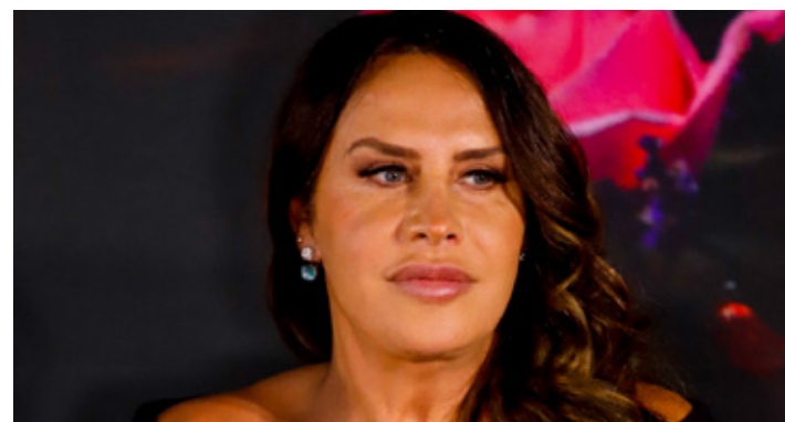
■ Karla Sofía Gascón está nominada a Mejor Actriz por 'Emilia Pérez'.

"Es necesario esperar a que tanto el DIF como la Fiscalía contesten, para que posteriormente el Juez de Amparo emita su resolución", aseveró.