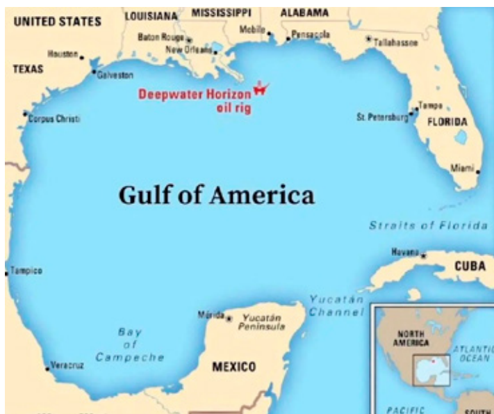
■ El gobierno mexicano podría demandar a Google por el tema del 'Golfo de América'.

"No es la primera vez que ocurre, ha ocurrido en otras ocasiones. Entonces, eso lo ponemos así, es parte de la coordinación que tiene que haber y de la colaboración conjunta", agregó.