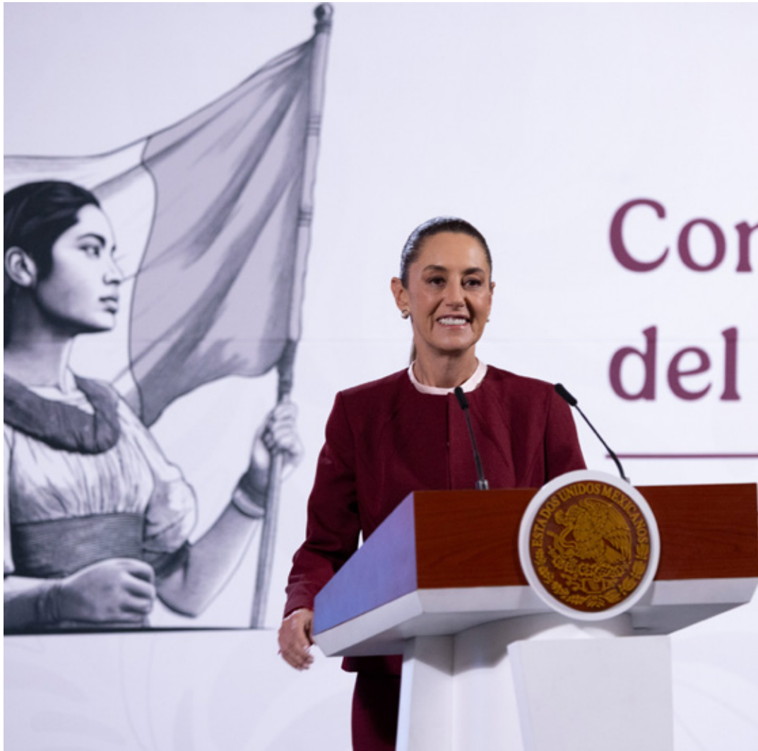
■ Claudia Sheinbaum recalcó que en EU hay delincuencia organizada.