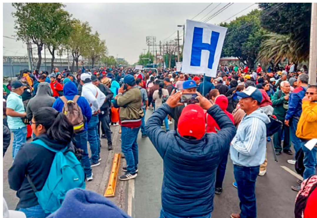
Maestros de la CNTE se manifestaron cerca del Aeropuerto Internacional (AICM) y alteraron el tránsito y vialidades.