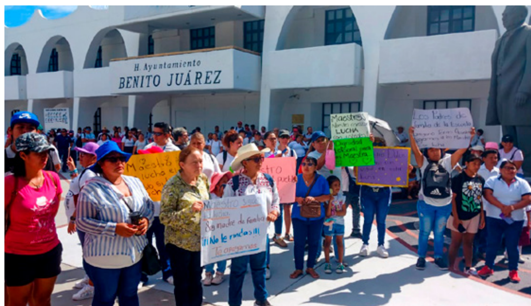
■ Los docentes se concentraron en Plaza de la Reforma para informar a los padres de familia sobre su protesta.