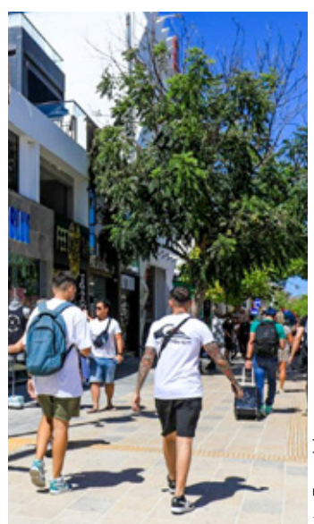
■ La Quinta Avenida de Playa del Carmen.