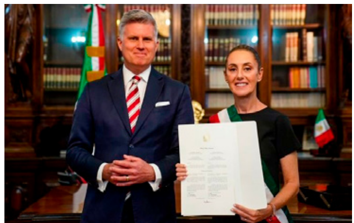
La presidenta Sheinbaum recibió ayer las cartas credenciales de 23 Embajadores.