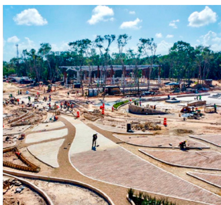
■ Otorga Semarnat la autorización ambiental para construir y operar el recinto ferial de Chetumal.