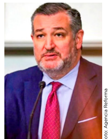
El senador texano Ted Cruz advirtió que México tendrá que cumplir con el Tratado.

El Departamento de Agricultura de Estados Unidos anunció un acuerdo de subvención de 280 millones de dólares con la Secretaría de Agricultura de Texas para brindar un alivio económico crucial a los agricultores y productores del valle del río Grande que sufren el continuo incumplimiento de México de sus obligaciones.