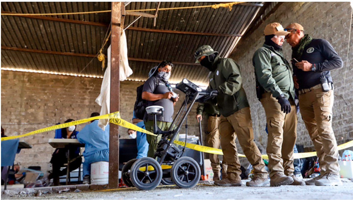
La presidenta Sheinbaum reprochó que el tema del narco-rancho en Teuchitlán sea utilizado en una "campana" para atacarla.

Los cuatro detenidos y lo asegurado fueron puestos a disposición del agente del Ministerio Público correspondiente, que integrará la carpeta de investigación y determinará su situación legal.