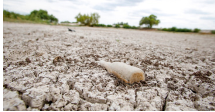
La frecuencia de las sequías se incrementó 31 por ciento en México entre 2000 y 2020, advierte la OCDE.

El creciente riesgo de sequía a nivel global, señala el reporte, se