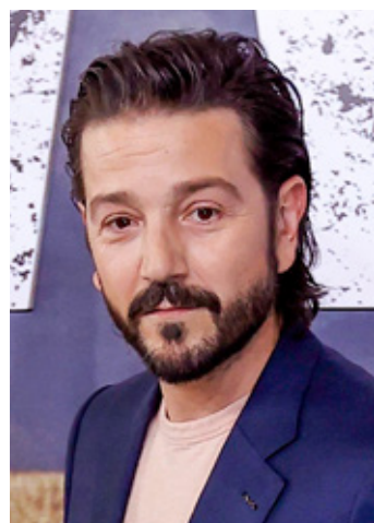
Diego Luna reveló que le siguen ofreciendo papales de narcotraficantes.