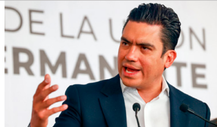
El PAN exigió la derogación inmediata de la Ley de Ciberseguridad, conocida como Ley Censura, aprobada en Puebla.

Tras la cancelación, el Gobierno de México informó que el resto de la agenda de Sheinbaum se mantendría.