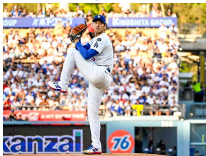
■ El japonés volvió a lanzar luego de 22 meses y debutó con los Dodgers como abridor.

El japonés fue operado del codo derecho antes de llegar a los Dodgers en 2023 y no pudo lanzar en su primer año en Los Ángeles. En este primer juego como abridor, Shohei permitió una carrera en primera entrada,