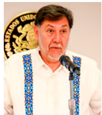
Gerardo Fernández Noroña culpó a su compañero de partido (Morena), Cuauhtémoc Ochoa.

"En Unlocked Woman reuniremos a mujeres que están redefiniendo el futuro de los negocios con ayuda de la Inteligencia Artificial.