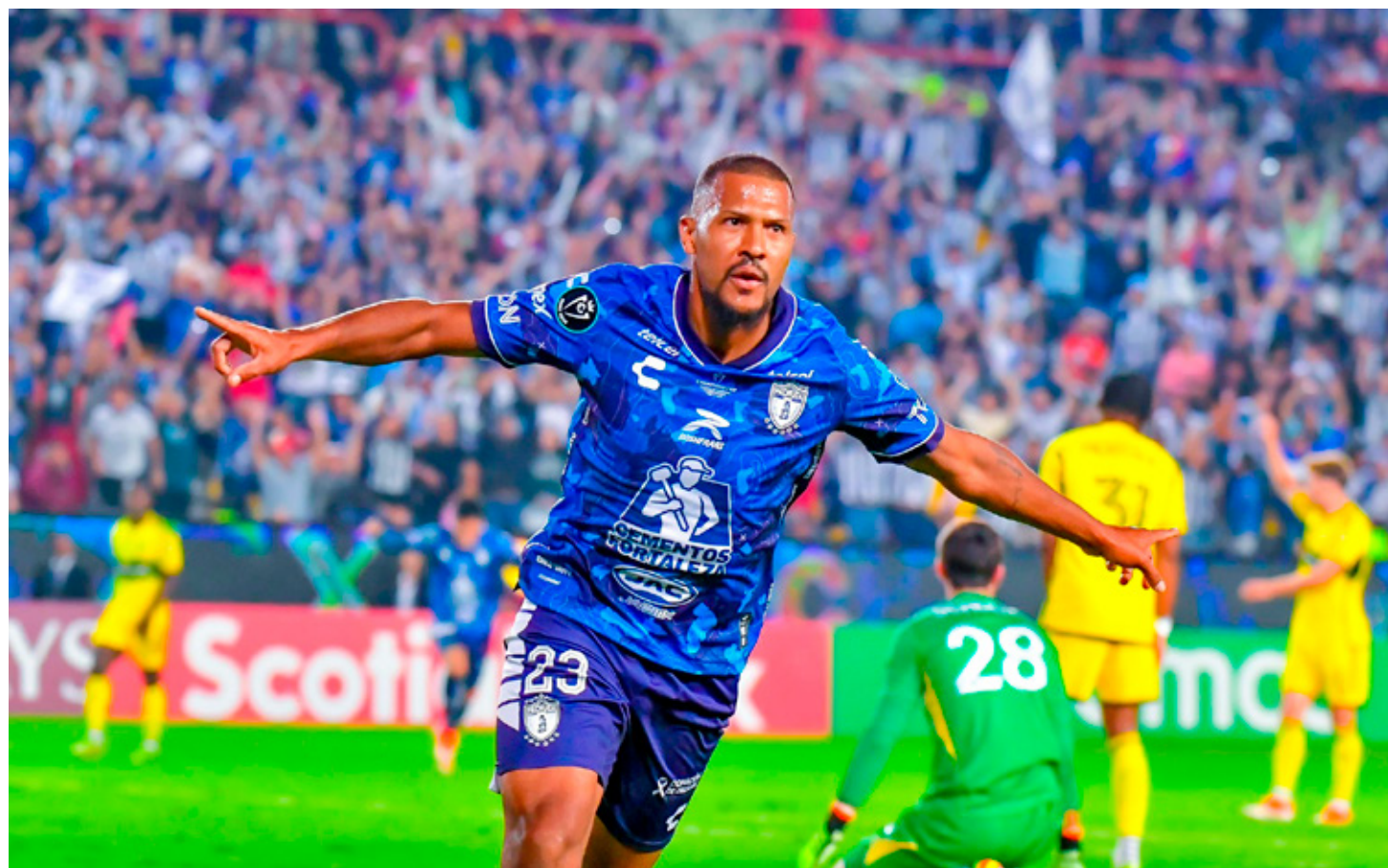
■ Pachuca enfrentará por primera vez a un club de la UEFA en el Mundial de Clubes.

Quintana Roo tiene 143 medallas en esta Olimpiada Nacional, 40 de oro, 57 de plata y 46 de bronce.