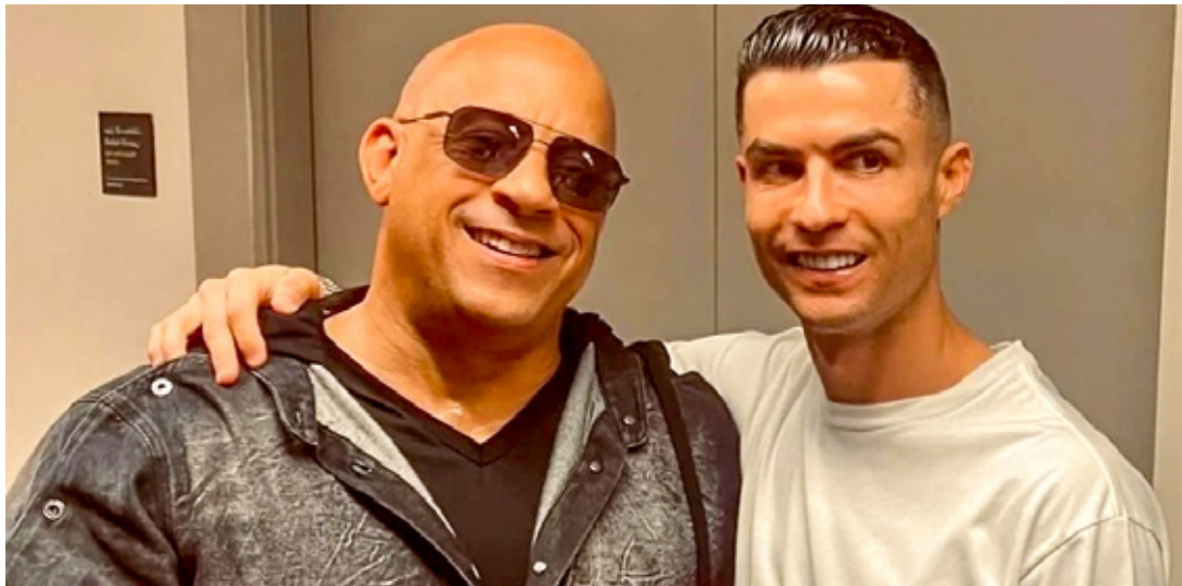
Vin Diesel reveló en redes sociales que escribió un papel para Cristiano Ronaldo en la siguiente película de la saga de ‘Rápidos y Furiosos’.

la noticia, pero los fans del futbol y del cine están entusiasmados con la posibilidad de verlo en la trepidante franquicia. La popular saga de Hollywood, que comenzó en 2001, ha estrenado 10 películas hasta la fecha. La última entrega, Fast X, salió en 2023, mientras que su segunda parte, Fast X: Part Two, donde podría aparecer Ronaldo, tiene previsto su estreno para 2027.