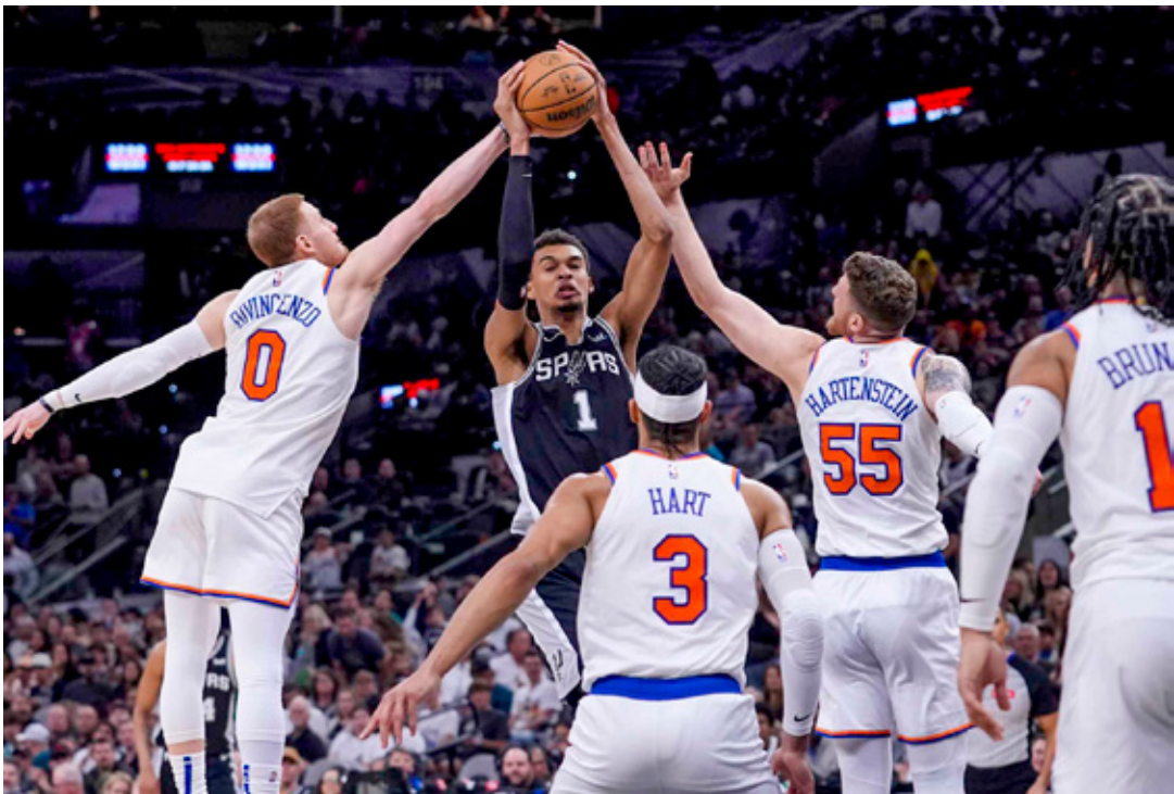
■Esta es la tercera edición del torneo que ganaron antes Lakers y Milwaukee.

Los Knicks llegan a esta instancia luego de dejar en el camino a los Raptors en Cuartos de Final y Orlando en Semis. En la liga, los neoryoquinos marchan en el segundo lugar de la Conferencia Este, con 18 juegos ganados y siete perdidos. Además de presumir cinco victorias consecutivas en lo que