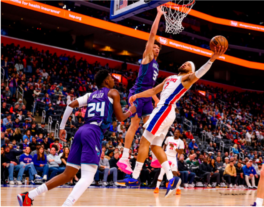
Detroit presume una de las mejores defensivas de la NBA y enfrenta al mejor anotador del 2025.