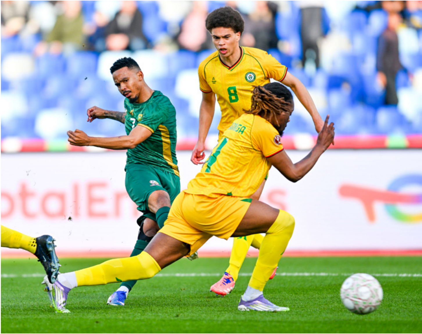
Los sudafricanos terminaron en el segundo lugar del Grupo B.

Los ‘Bafana Bafana’ vencieron a Zimbabwe en la Copa Africana