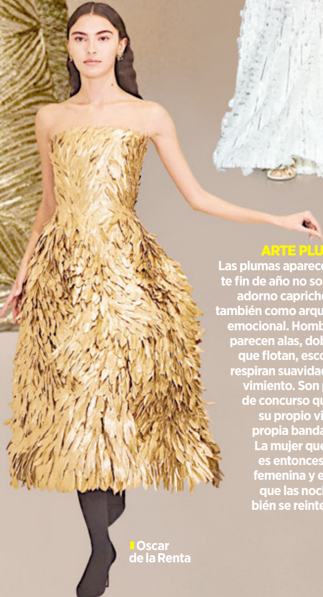
Oscar de la Renta

Las plumas aparecen en este fin de año no solo como adorno caprichoso sino también como arquitectura emocional. Hombros que parecen alas, dobladillos que flotan, escotes que respiran suavidad en movimiento. Son prendas de concurso que crean su propio viento, su propia banda sonora. La mujer que los usa es entonces, segura, femenina y entiende que las noches también se reinterpretan.