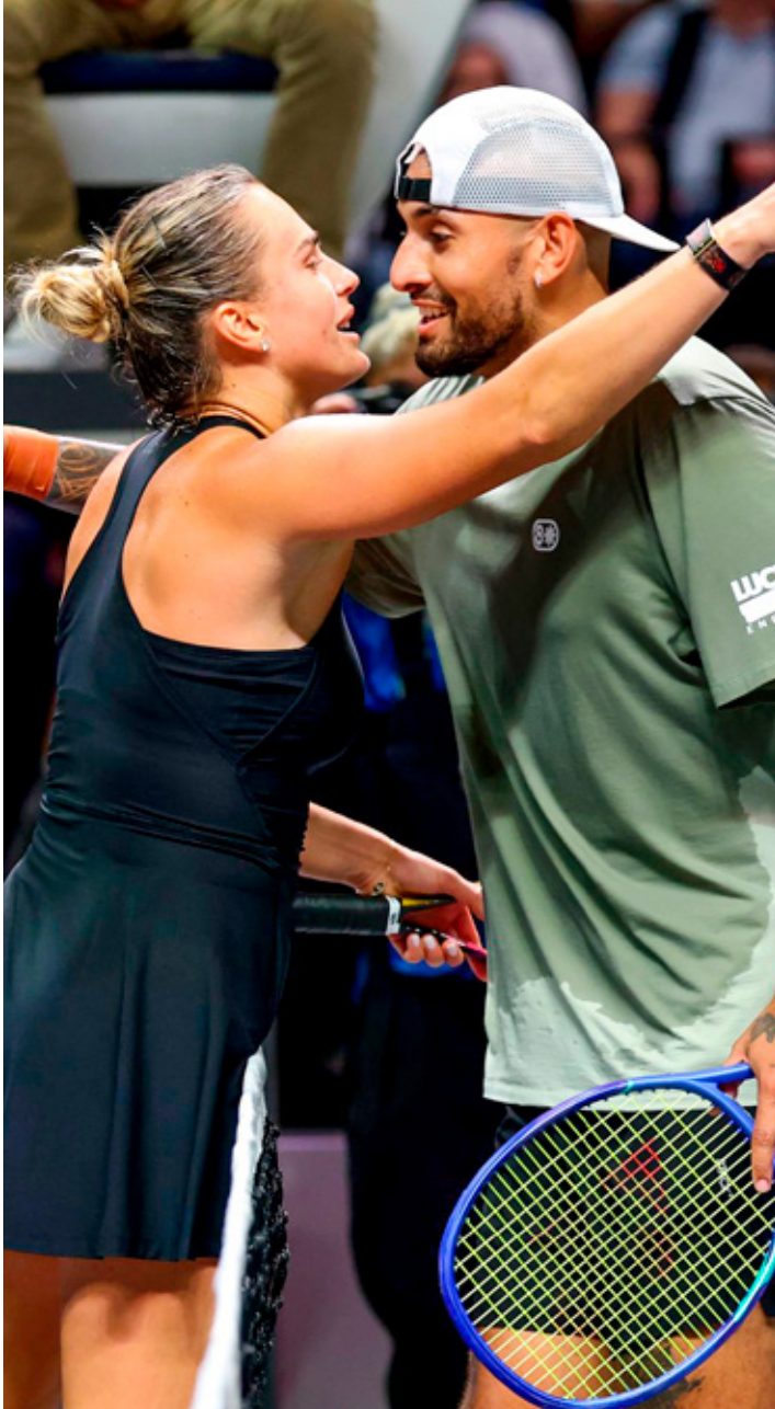
Los tenistas se enfrentaron en un juego de exhibición que recibió las críticas de sus colegas.