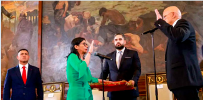
Delcy Rodríguez juró como presidenta interina de Venezuela.

algunos de los funcionarios que son considerados, junto a Rodríguez, del círculo cercano de Maduro: el ministro del Interior, Diosdado Cabello, y el ministro de la Defensa, el general Vladimir Padrino.