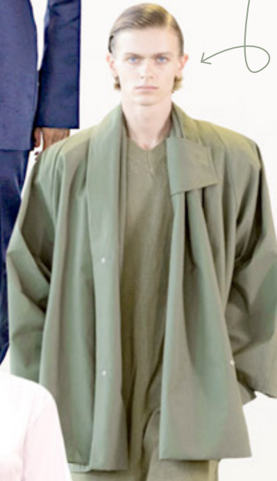
■ Hed May

VERDE SALVIA DE DULUX Esta plataforma se inclinó por un verde salvia con base en gris. Suave, equilibrado y orgánico. No es un verde selva ni verde joya sino una variante que respira. Plantea una reconexión con la naturaleza, el cuerpo y los ritmos lentos, un regreso a los valores ante tanto ruido y distracción que supone el mundo.