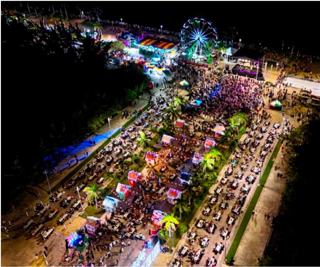
■ La Villa Navideña impulsó a comerciantes y artesanos de Benito Juárez, del 17 de diciembre al 6 de enero pasado.

Los comerciantes de alimentos regulados por la dirección de