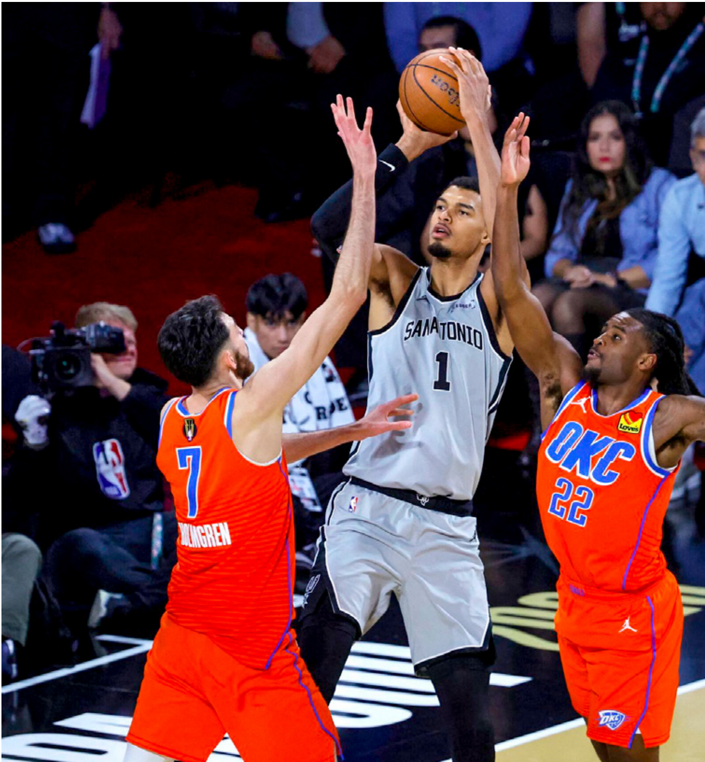
■ De las siete derrotas que tiene Oklahoma esta campaña, tres fueron contra San Antonio.

El próximo Draft se celebrará del 23 al 25 de abril en Pittsburgh, Pensilvania.