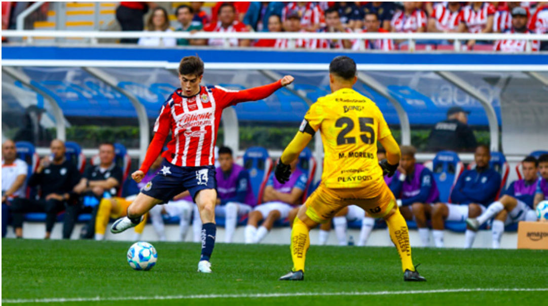
■ Guadalajara nunca ha perdido en cancha de los Bravos.