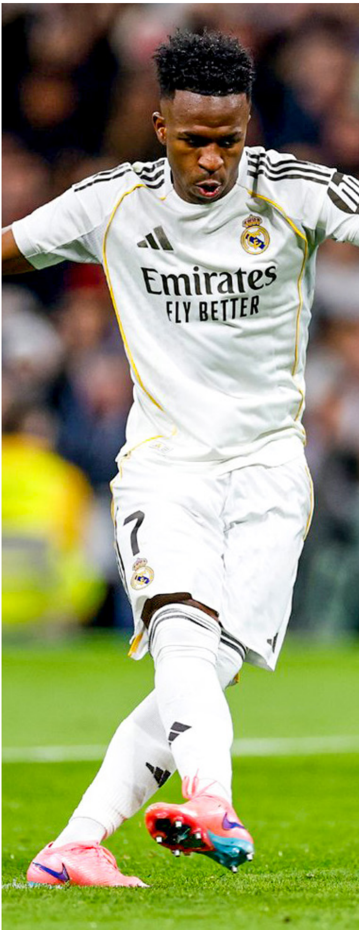
Real Madrid no vence al Benfica en la Champions League (antes Copa de Europa) desde 1965.

En tanto que el Galatasaray recibirá a Juventus a las 12:45 en el Rams Park. Los turcos dominan en el historial con dos triunfos, por uno de los italianos y tres empates. En tanto que el Atalanta visitará al Borussia Dortmund en el Signal Iduna Park, a las 15:00 horas, los de Bérgamo tienen nueve victorias y dos derrotas contra rivales alemanes.