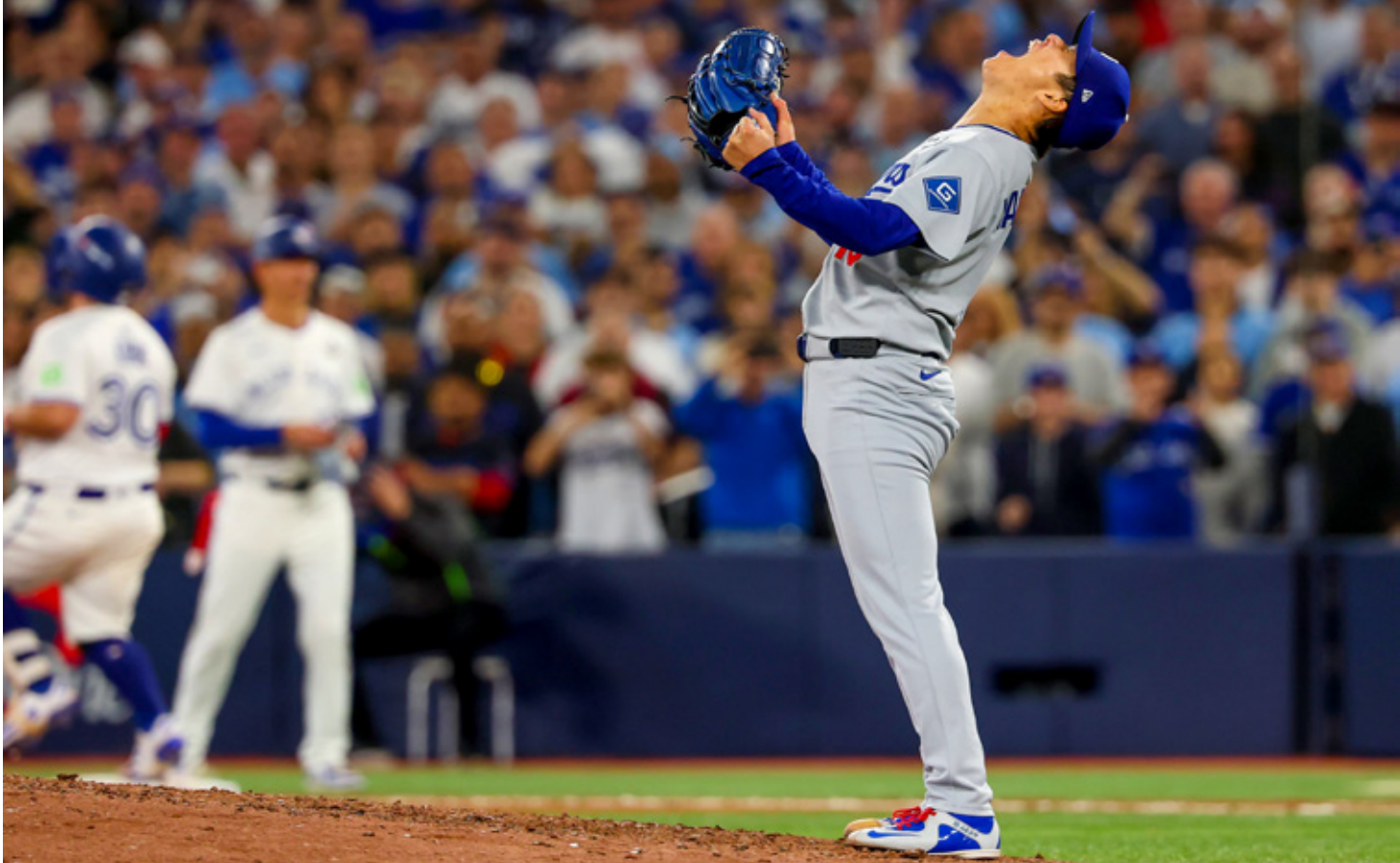
El pitcher terminó en el tercer lugar en las votaciones la temporada pasada.

Kinderknech y Alcaraz se han enfrentado cuatro veces, todas con victorias para el español, la más reciente en el US Open de 2025.