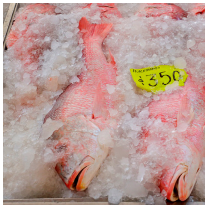
El esquema consiste en inyectar líquido al filete antes del proceso de congelación, para impedir detectar la alteración.

Aldama consideró que lo más común es que los pescados contienen 30 por ciento de agua, aun-