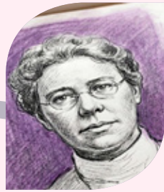
JUNE Mc CARROLL

Inventa y patenta el limpiaparabrisas en 1903 , por medio de una palanca que accionaba un brazo metálico con una lámina de goma.