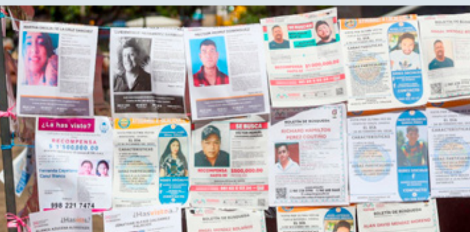
El gobierno de México consideró parcial y sesgado informe de la ONU sobre desaparecidos.

Entre ellas destacan los cambios en la Comisión Nacional de Búsqueda, la creación de la Base Nacional de Carpetas de Investigación y la Plataforma Única de Identidad, así como la obligación de abrir una carpeta de investigación desde el primer momento en que desaparece una persona