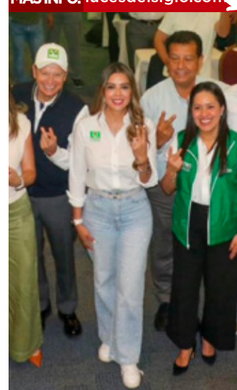
En San Luis Potosí, el Verde está decidido a ir sin coalición con Morena.