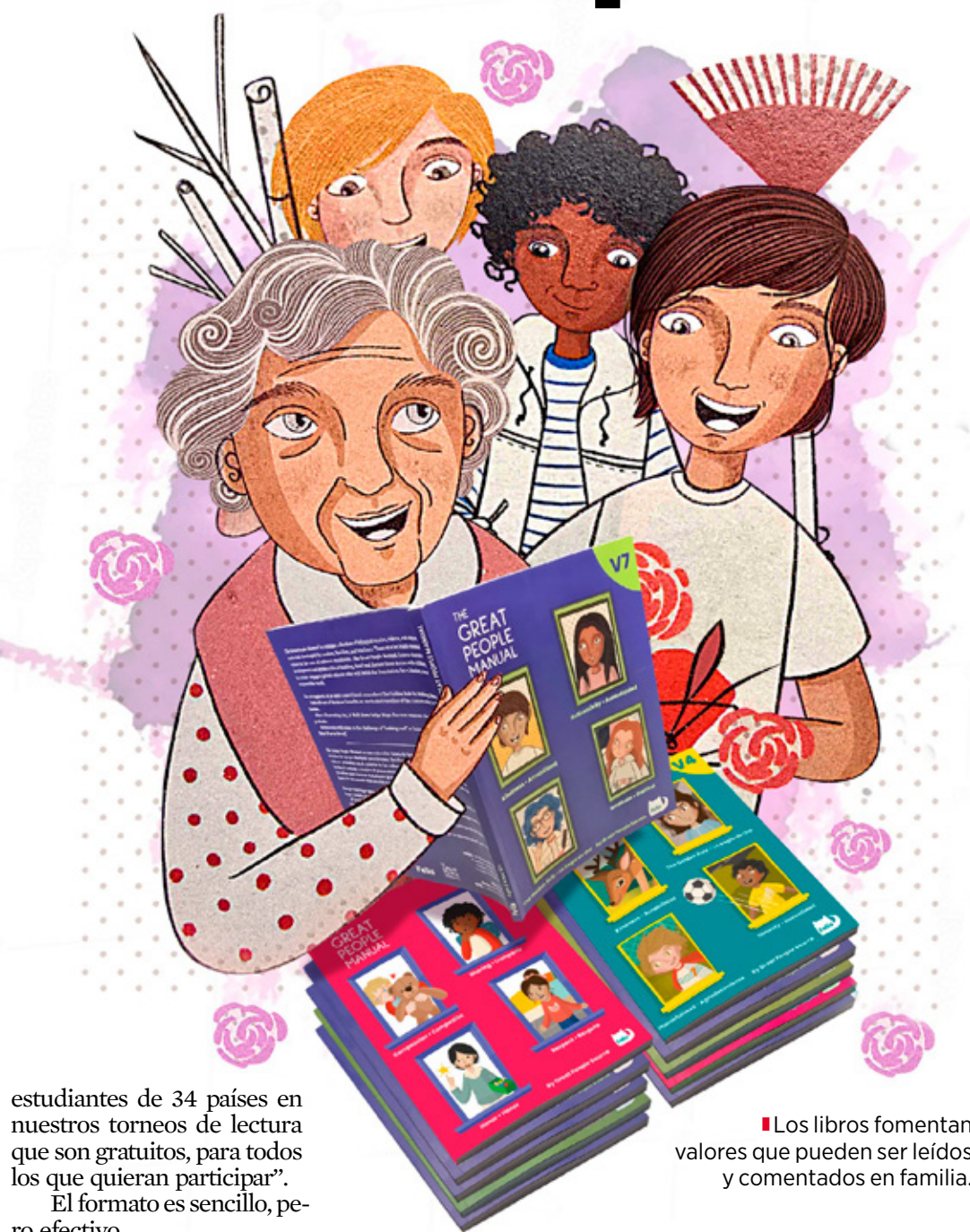
Los libros fomentan valores que pueden ser leídos y comentados en familia.

“Hace dos años empecé a crear torneos de lectura bilingües e internacionales y en 18 meses logramos que participaran más de 100 mil