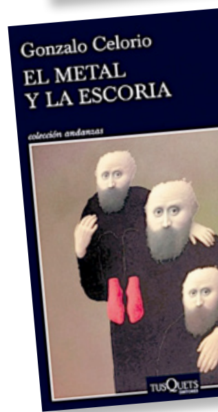
Los tres libros de Celorio que forman parte de la saga Una familia ejemplar .