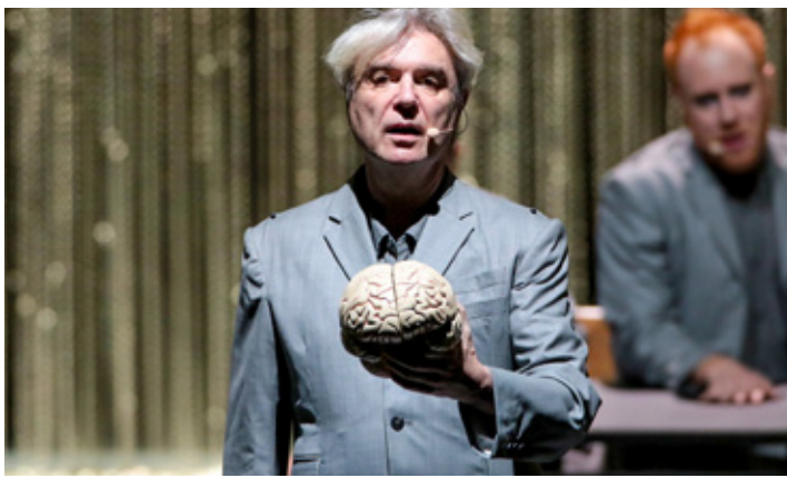
David Byrne se presentará en México en el mes de septiembre.