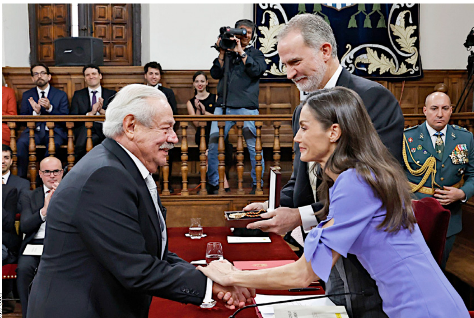
Felipe VI y Letizia encabezar la ceremonia en la que fue reconocido Gonzalo Celorio.