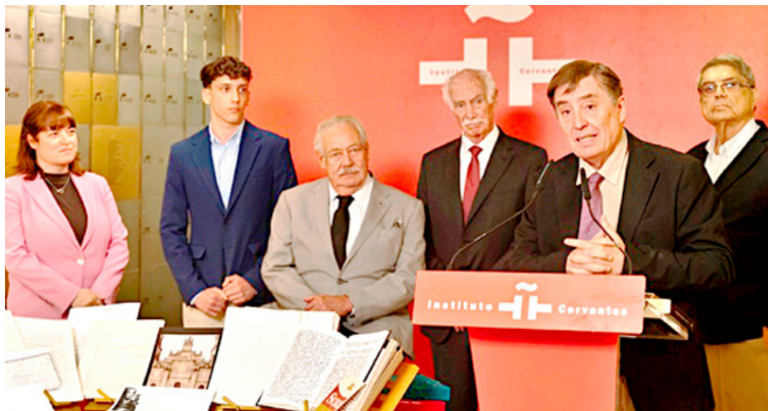
El Instituto Cervantes participó en el jurado que elige al Premio Cervantes.

Tan pronto empecé a averiguar por mi propia cuenta los pasajes más determinantes de sus biografías, advertí que casi todos ellos habían desempeñado, sin sospecharlo siquiera, un papel épico en el transcurso de sus días. Y esa condición épica, que en su momento adoptaron con naturalidad y sin conciencia, era susceptible de ser contada en clave novelística. Pensé que aquellas personas, convertidas en personajes merced al artificio de la literatura, podrían ser trascendentes no sólo para mí y los míos por