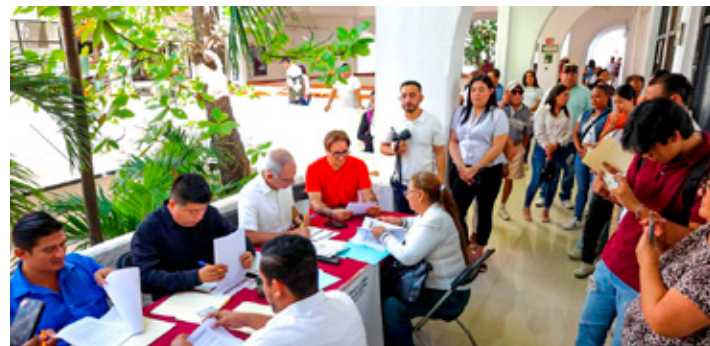
En la delegación Alfredo V. Bonfil están pendientes proyectos relacionados con la regularización territorial y servicios públicos.

En materia social, señaló que recientemente se atendió un conflicto en la zona conocida como Tres Reyes Sección 2, donde, dijo,