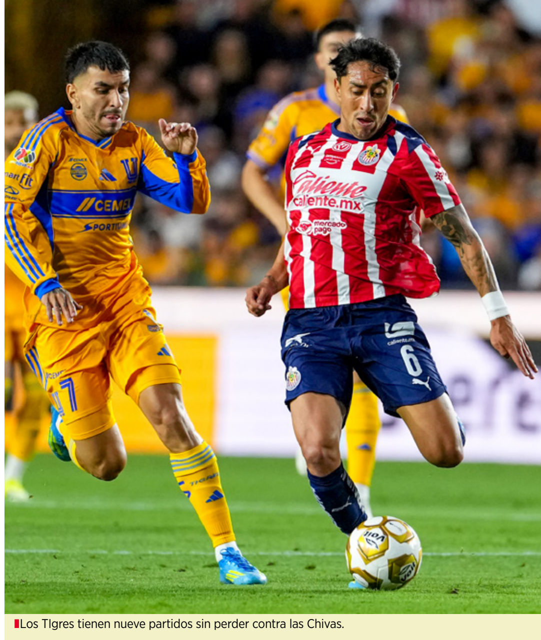
Los Tigres tienen nueve partidos sin perder contra las Chivas.

El partido de vuelta será el próximo 9 de mayo en el Estadio Akron. Cabe recordar que el empate en el marcador global dará el pase a Semifinales a Chivas, por mejor posición en la tabla general.