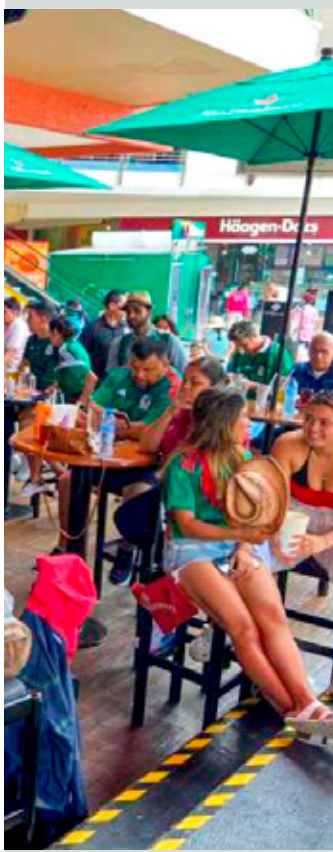
Los restaurantes de Cancún ven en el Mundial de Fútbol 2026 una oportunidad real.

Añadió que, en general, existe mayor apertura institucional para la difusión comercial en torno al Mundial, dado que el país no tendrá otra oportunidad cercana de ser sede de este evento.