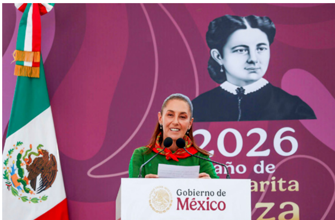
■ Claudia Sheinbaum reprochó que algunos pidan ‘que venga Estados Unidos a ayudar con la seguridad’.

al extranjero, hoy hay defensa de la soberanía nacional. Los que piensan que agachando la cabeza se sirve a la patria, están muy equivocados.