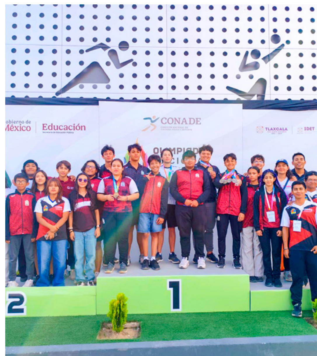
Los arqueros de la entidad terminaron las pruebas con nueve preseas en total.

La Olimpiada Nacional continúa sus actividades esta semana con las disciplinas de tiro deportivo, patines sobre ruedas, boxeo, basquetbol, raquetbol, squash y natación.