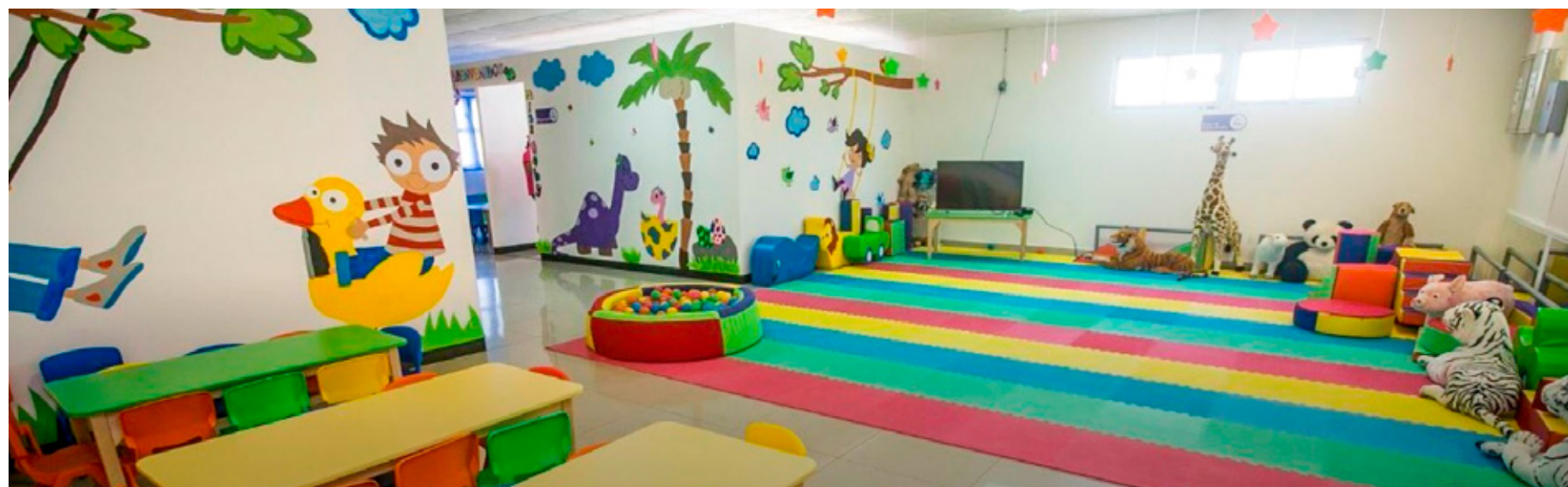
El IMSS de Quintana Roo destinará los dos predios para la construcción de Centros de Educación y Cuidado Infantil (CECI).