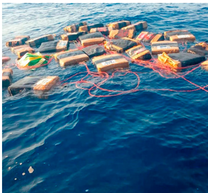
■ La droga habría sido lanzada al mar a 190.7 kilómetros de la Décima Región Naval de Salina Cruz, Oaxaca.

“Lo asegurado fue puesto a disposición de la autoridad competente, que integró la carpeta de investigación correspondiente y determinará su situación legal”, indicó.