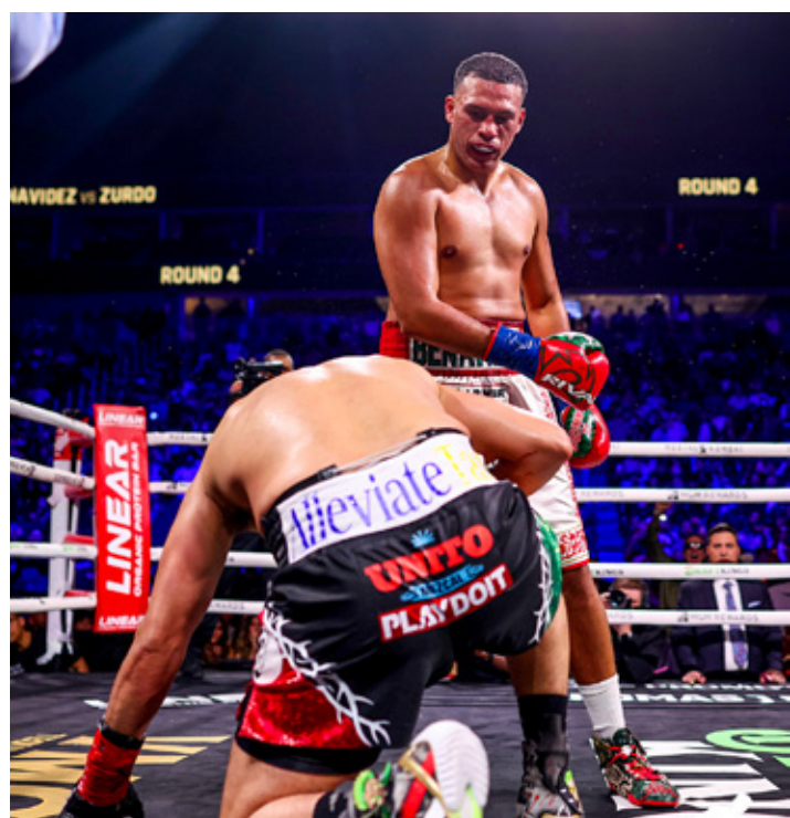
David Benavidez noqueó a Gilberto Ramírez en el sexto asalto.

Antonelli sigue como líder de la F1 con 75 puntos, seguido de su compañero George Russell y el monegasco está en el tercer lugar del campeonato.