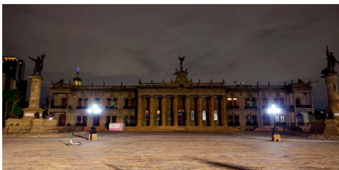
■ Nuevo León busca ‘brillar’ en el Mundial de fútbol al renovar el sistema de iluminación del palacio de gobierno.