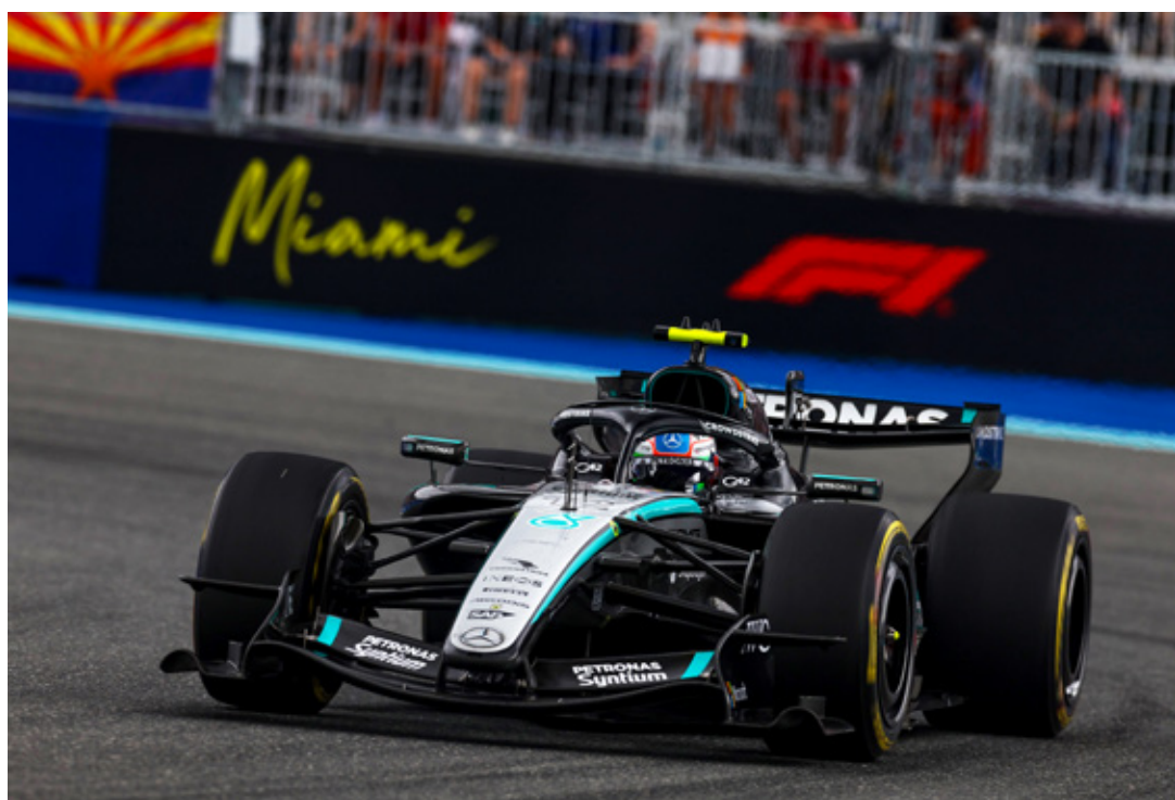
El piloto de Mercedes se llevó su tercera carrera consecutiva de esta temporada.

El piloto de Mercedes ganó el Gran Premio de Miami