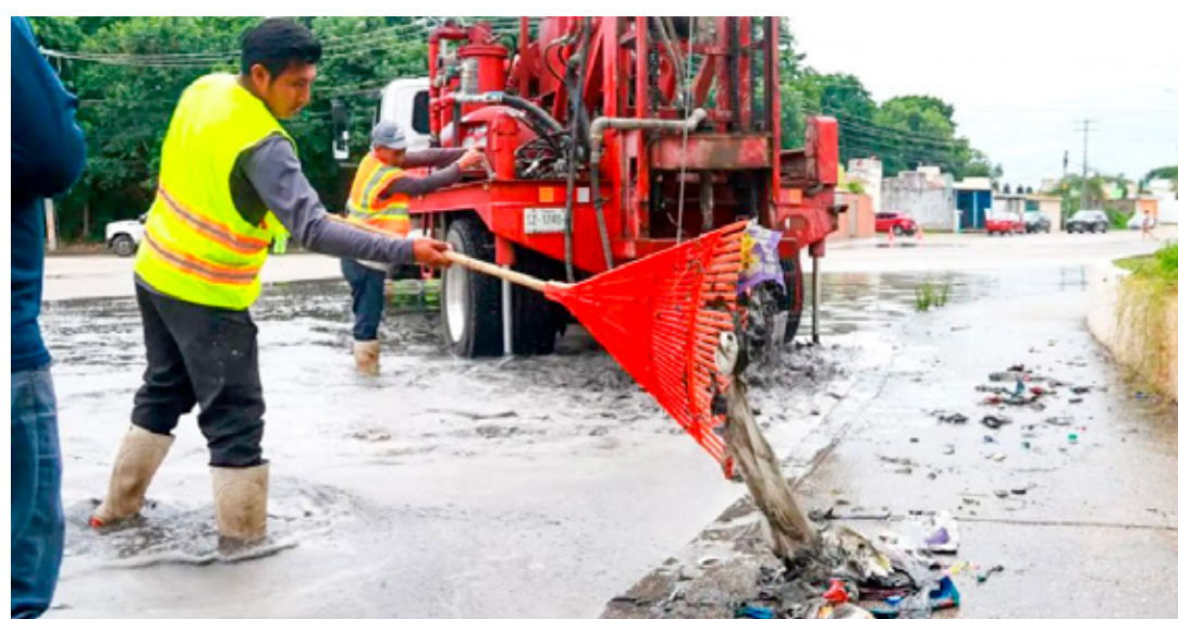
Autoridades municipales informaron que se mantienen activos los trabajos preventivos en el sistema de drenaje pluvial.

Gasca Martínez indicó que en los próximos días se darán a conocer las medidas específicas que se implementarán, destacando que la prioridad es mejorar la oportunidad en la atención a los derechohabientes.