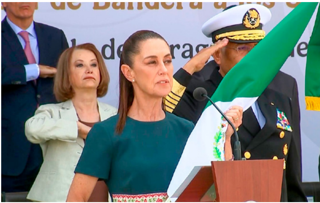
La mandataria encabezó la ceremonia conmemorativa del 164 aniversario de la Batalla de Puebla.

Estados Unidos, México y Canadá forman parte del T-MEC, el cual entró en vigor en julio de 2020 como el acuerdo que sustituyó al Tratado de Libre Comercio de América del Norte (TLCAN), actualmente el acuerdo se encuentra en un proceso de renegociación.