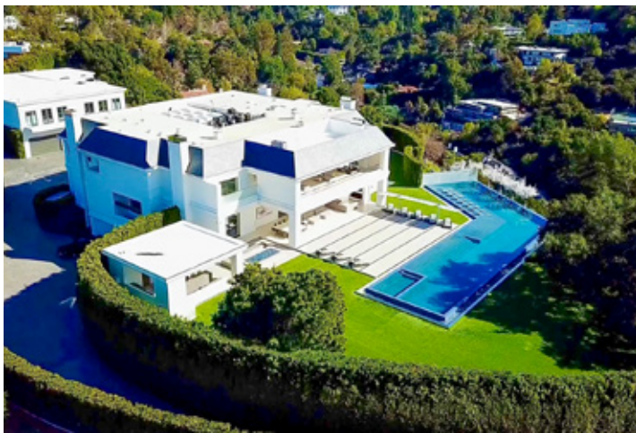
La propiedad fue listada cerca de los 50 millones de dólares.