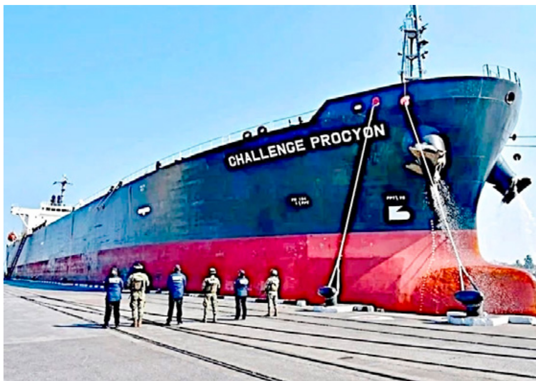
En febrero y marzo de 2025 se descubrieron las importaciones ilegales de diésel y gasolina.

Se utilizaba documentación falsa y clasificaciones arancela-