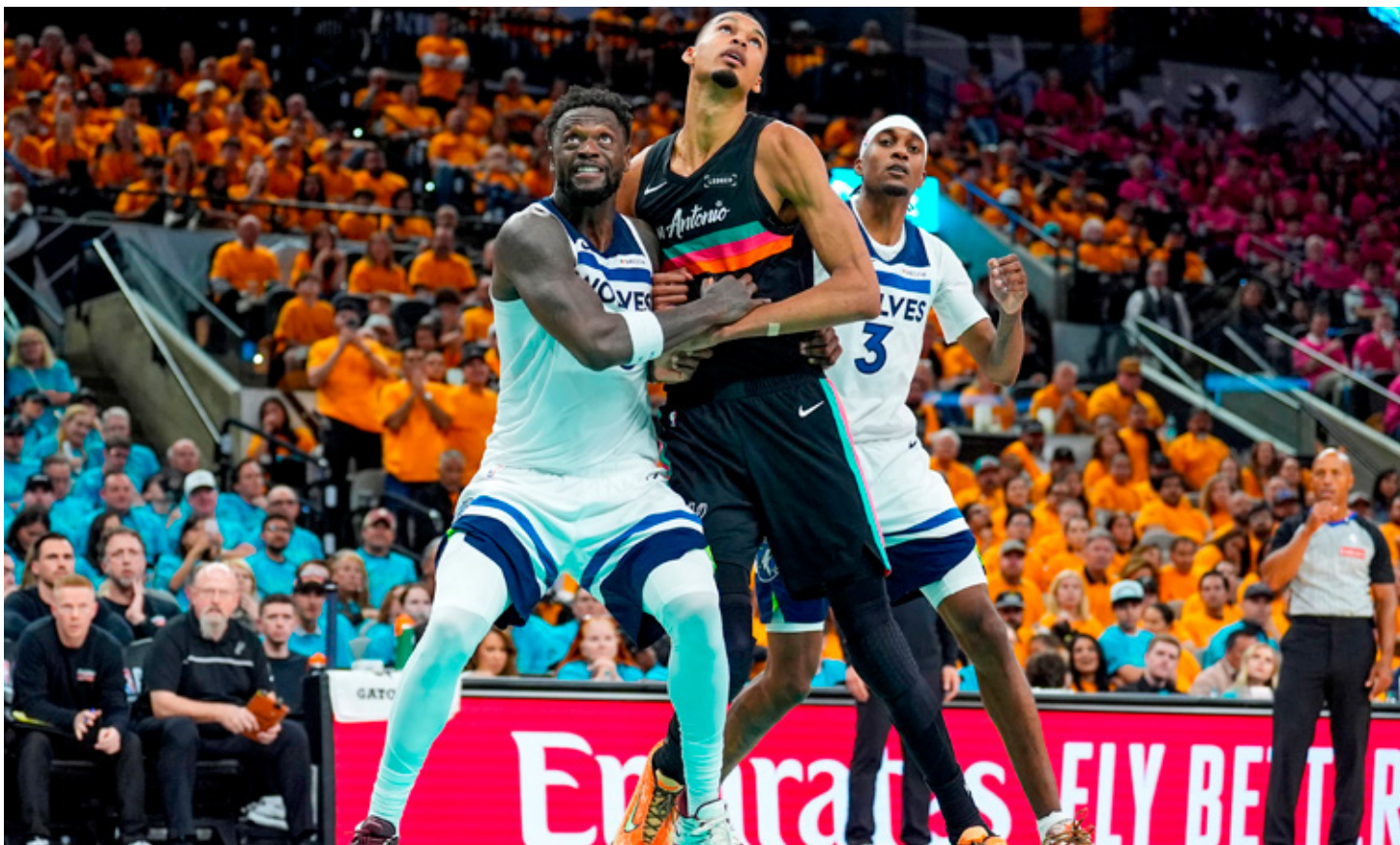
San Antonio y Minnesota se enfrentan por primera vez en playoffs luego de 25 años.

Sin embargo, el historial favorece a los Spurs, que han eliminado a Minnesota en dos ocasiones, ambas en la primera ronda, la primera en 1999 y la segunda