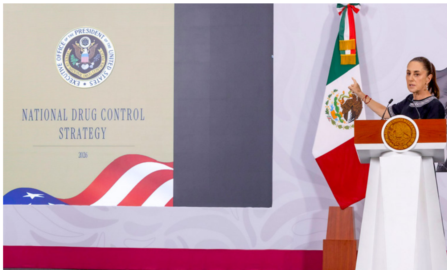
La titular del Ejecutivo federal destacó el dismantelamiento de más de 2 mil narcolaboratorios.

Aunque la funcionaria no detalló montos de combustible ilegal detectado, aseguró que la nueva trazabilidad ya permite identificar el comportamiento completo del mercado y realizar análisis específicos en cada institución conforme a sus facultades.