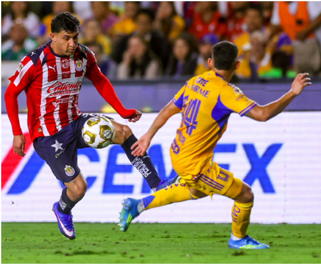
Los universitarios tienen siete años sin perder cuando visitan a Chivas.

Gabriel Milito no contará con cinco de sus jugadores titulares, quienes están concentrados con la Selección Mexicana, pero tratarán de imponerse como locales, donde estuvieron invictos, con seis triunfos y dos empates. Los únicos que pudieron sacar puntos de Zapopan fueron Pumas y Tijuana.