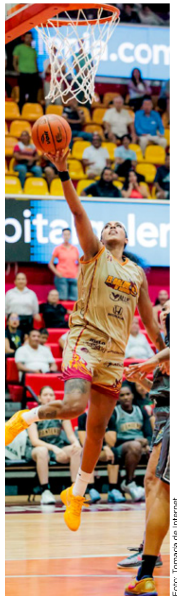
Las cancenenses clasificaron por segunda temporada a playoffs.

El partido entre Chivas y Tigres será este 9 de mayo a las 20:07 horas (tiempo de Quintana Roo), en el Estadio Akron.