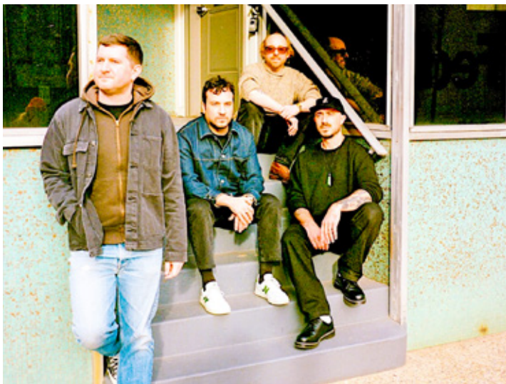
La banda estadounidense se presentó con sus éxitos en el festival 'Día Libre'.