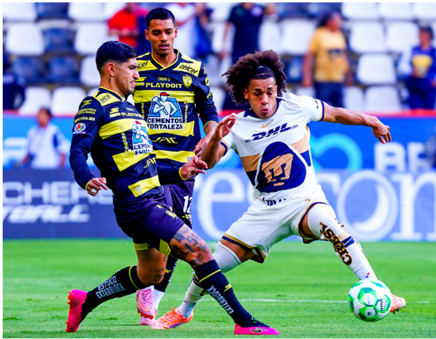
■ Pumas fue el único equipo que venció a Pachuca como visitante en el Clausura 2026.

Francia debutará en el calendario con los Saints y los Steelers, en el Stade de France de París, además del regreso a España y Alemania, con los juegos entre Bengals frente a Falcons y Patriots contra Lions, respectivamente.