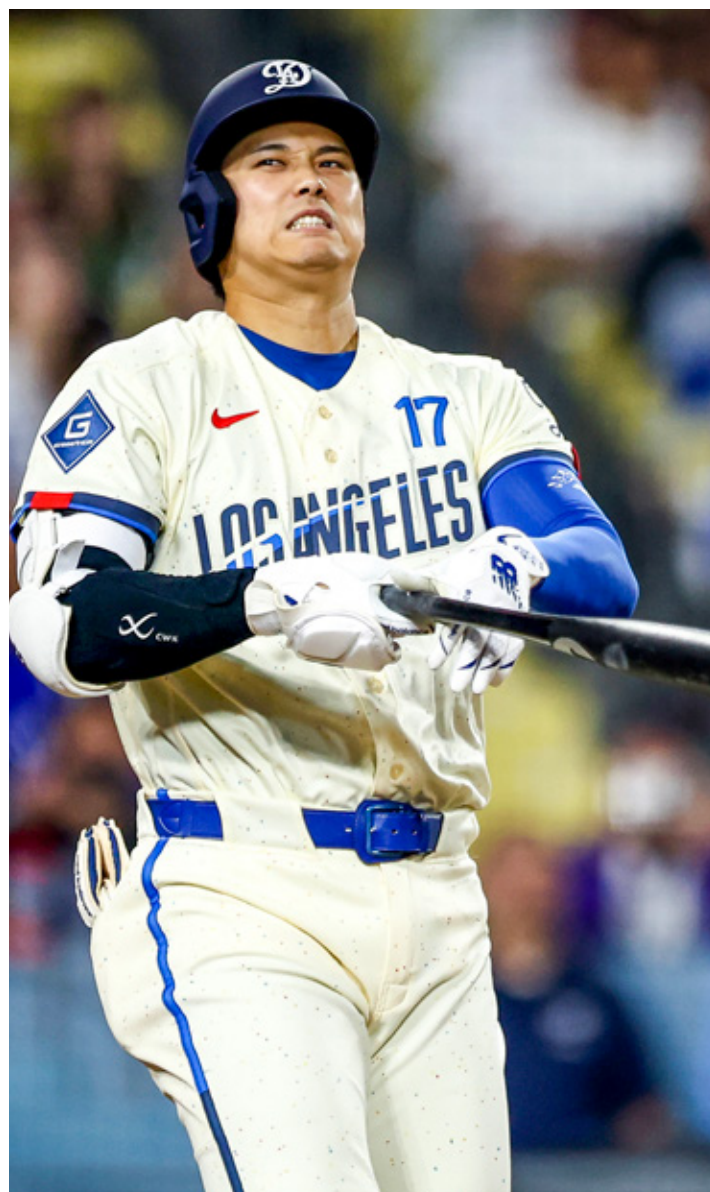
■ El japonés apenas tiene siete jonrones en lo que va de la temporada.