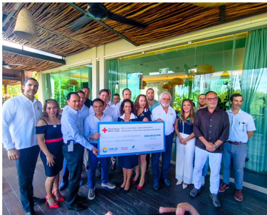
En el marco de la Colecta Nacional 2026, la Cruz Roja de Quintana Roo hizo un llamado a la cultura vial y de la emergencia.

Estas conductas que retrasan los tiempos de respuesta y ponen en riesgo la supervivencia de los pacientes que reciben alguna de las 35 o 36 atenciones gratuitas diarias que brinda la institución.