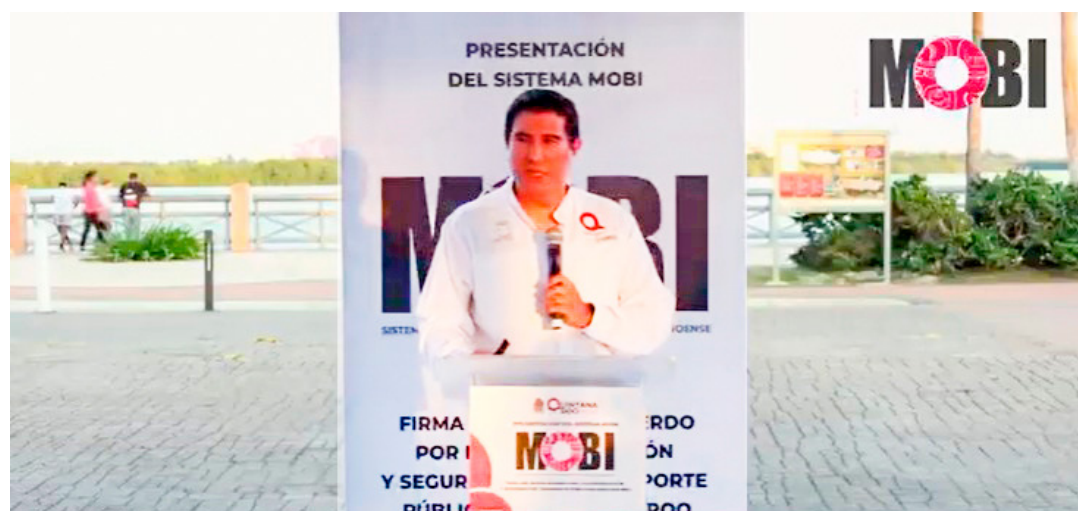
El municipio Othón P. Blanco será la segunda demarcación de Quintana Roo en integrarse al Sistema de Movilidad del Bienestar.

Junto con Benito Juárez y Playa del Carmen, la capital del estado es uno de los municipios con mayor celeridad en este proceso; mientras que en Cancún el