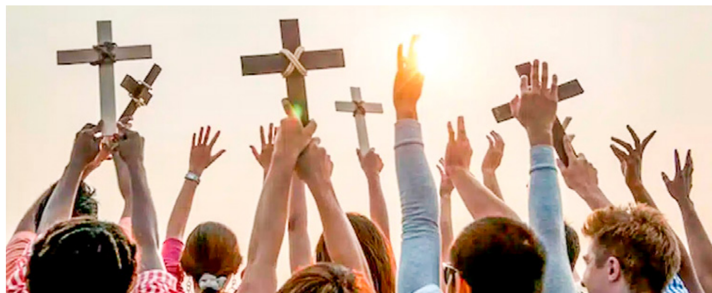
Cancún se convierte en punto de encuentro para el análisis internacional de la libertad religiosa.

El procedimiento de evaluación ambiental, que inició meses atrás, fue suspendido en febrero pasado para que la autoridad solicitara información adicional a la empresa.