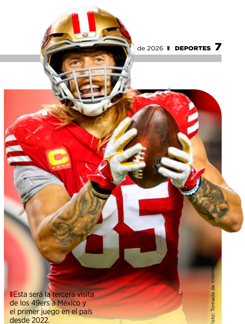
■ Esta será la tercera visita de los 49ers a México y el primer juego en el país desde 2022.

El partido entre Pachuca y Pumas será este 14 de mayo a las 20:00 horas (tiempo de Quintana Roo), en el Estadio Hidalgo.