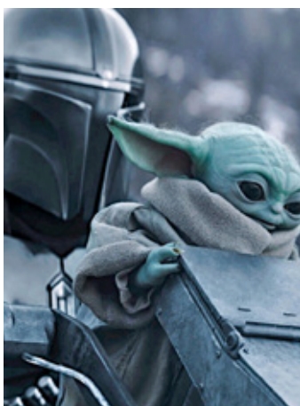
■ The Mandalorian and Grogu se estrena la próxima semana.