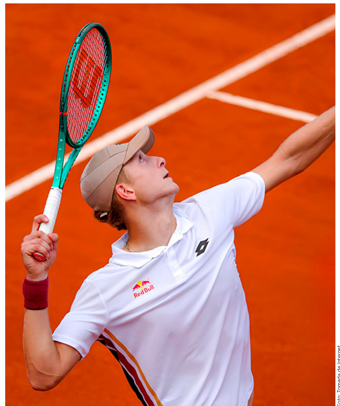
■ El tenista de 20 años jugará por segunda vez los Cuartos de Final en un Masters 1000.