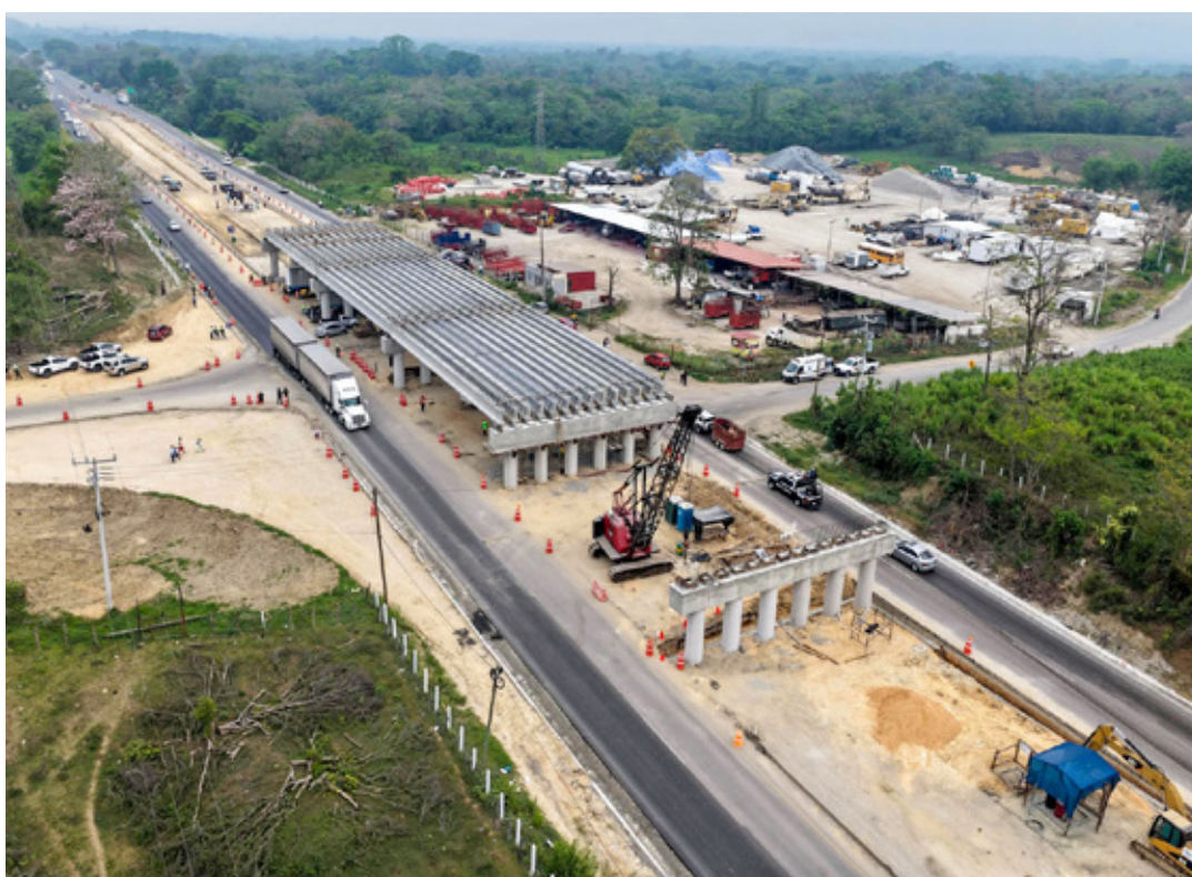
La obra consiste en la ampliación a cuatro carriles de la carretera que va de Macuspana a Escárcega.

En su carta aclaratoria, la gobernadora afirma que seguirá trabajando de manera coordinada con el gobierno federal, así como instituciones de los tres niveles de gobierno.