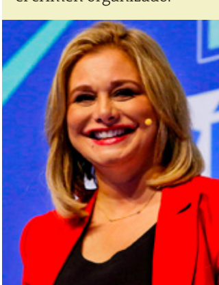
El líder del PAN, Jorge Romero, defenderá la democracia y a la gobernadora de Chihuahua.

Jorge Romero insistió en que el oficialismo está utilizando de forma facciosa a las instituciones del Estado para intimidar y desgastar a gobiernos de oposición, mientras encubre y protege a sus propios integrantes acusados por vínculos con el crimen organizado.