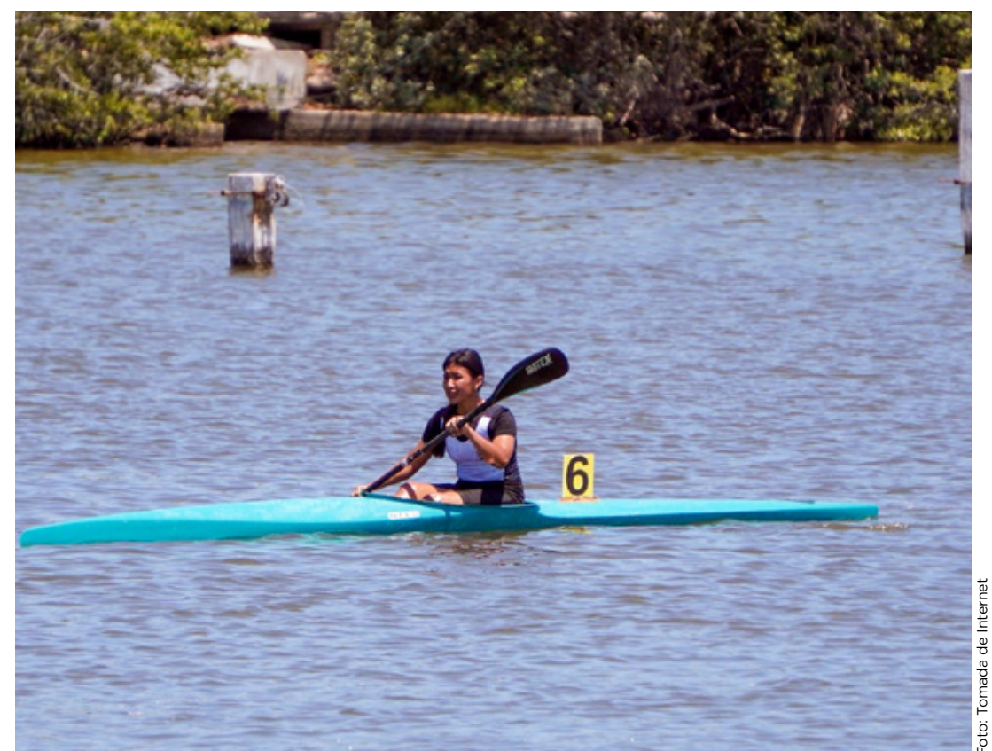
Las medallas cayeron en las pruebas de 500 metros de canoa individual y doble.