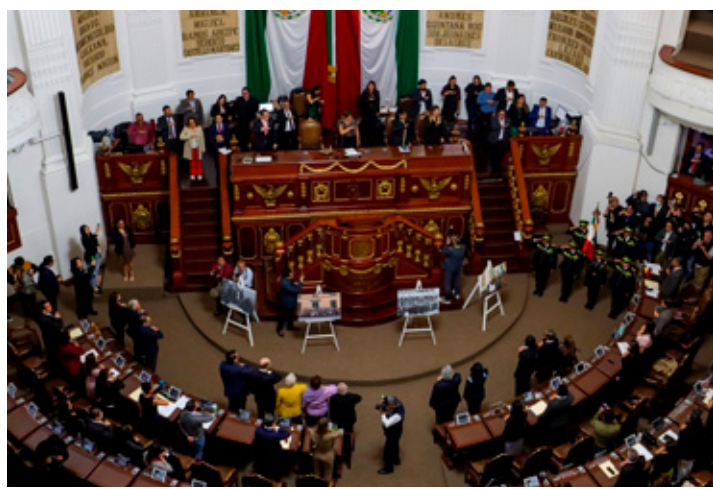
El congreso capitalino aprobó reformas a la Ley de Educación para regular el uso de móviles en escuelas.

"La Secretaría podrá proponer a la autoridad educativa federal