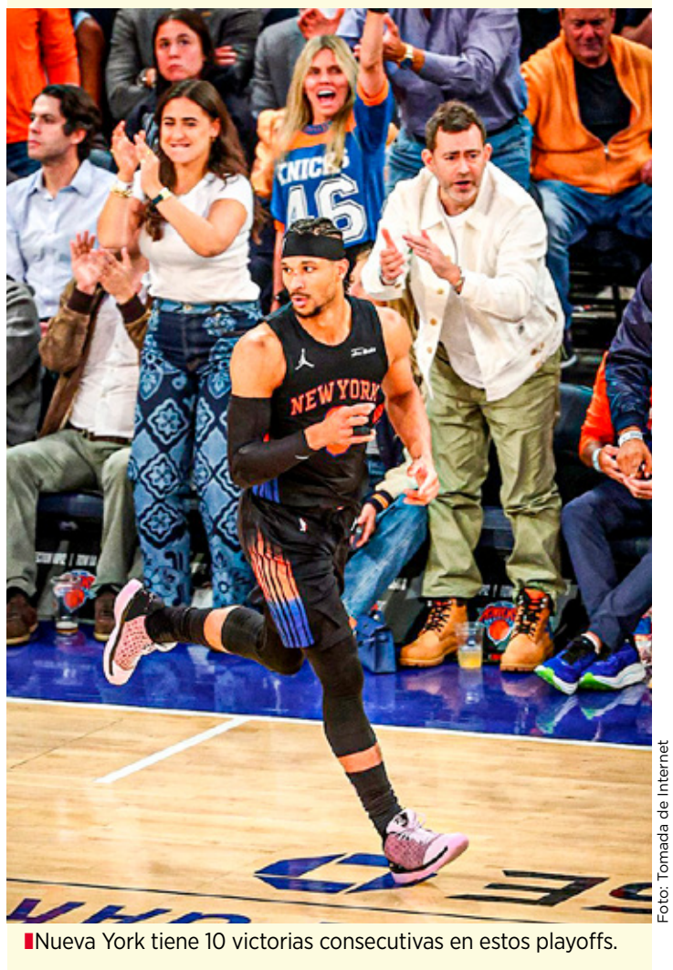
Nueva York tiene 10 victorias consecutivas en estos playoffs.

El Juego 4 entre Cleveland y Nueva York será este 25 de mayo a las 19:00 horas (tiempo de Quintana Roo), en la Rocket Arena.