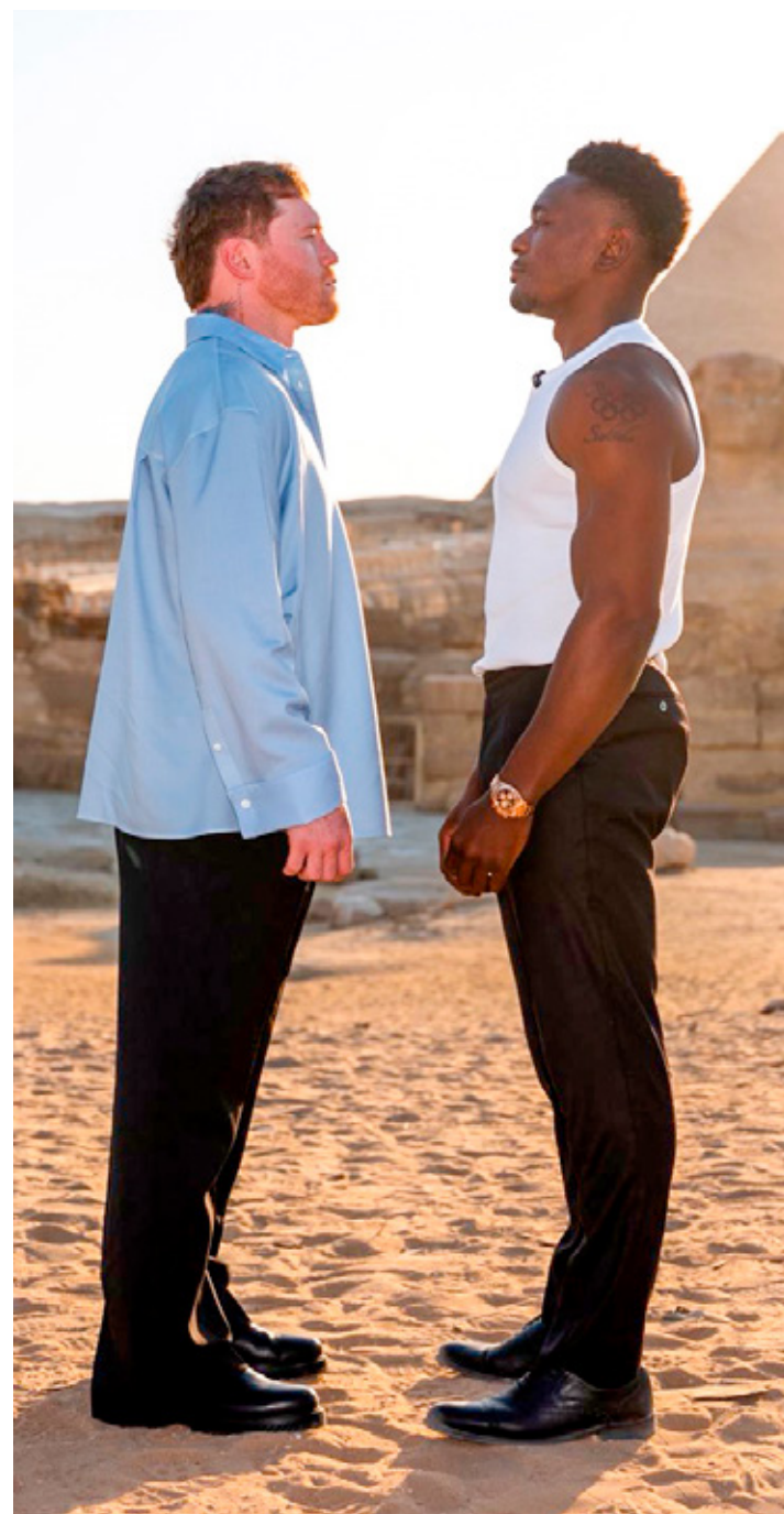
El boxeador mexicano volverá a la actividad, ahora contra un campeón interino.

El combate está programado para el próximo 12 de septiembre, en Riad, Arabia Saudita. Esta sería la segunda pelea del mexicano en este país y la tercera en su contrato con la promotora de esa nación.