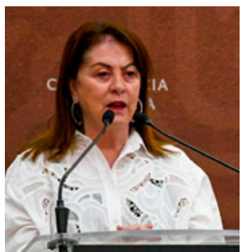
La mandataria estatal rechazó presiones para permitir el paso libre de drogas en la entidad.