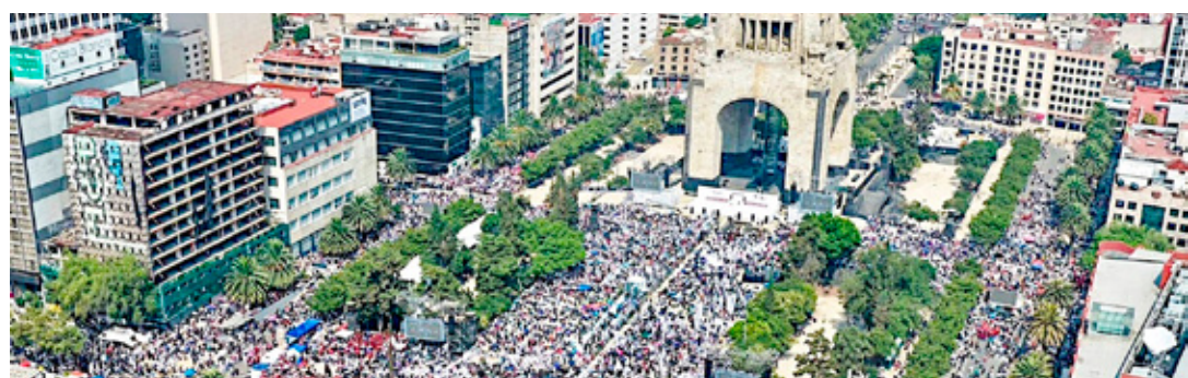
Llaman a legisladores, funcionarios y militantes actuar con valentía frente a intentos injerencistas.

La celebración recuerda la consolidación de la soberanía marítima nacional y reconoce el trabajo de las instituciones vinculadas con el desarrollo y protección de los mares mexicanos.