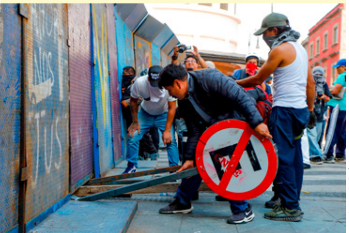
Maestros de CNTE no pudieron derribar vallas para ingresar al Zócalo de CDMX.

La cadena hotelera canadiense “Blue Diamond” anunció que deja de operar en Cuba “con efecto inmediato”, en momentos en que la Isla enfrenta una presión creciente de Estados Unidos.