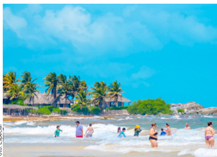
En lo que va del año se han presentado 60 quejas por accesos a playas de Tulum.