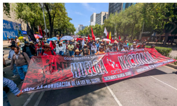
Los integrantes de la CNTE recorrieron del Ángel de la Independencia al Zócalo capitalino en CDMX.

Por ello, consideró necesario abrir una discusión pública sobre la concentración de estas plataformas, la regulación de la inteligencia artificial y el impacto que tienen en la formación de la opinión pública.