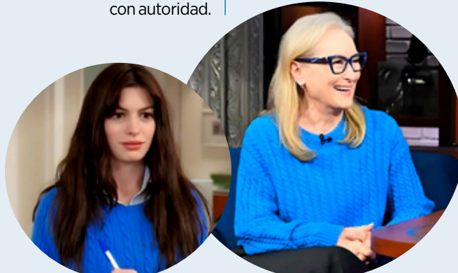
El famoso suéter que ha sido utilizado en la película y en la promoción de la misma.