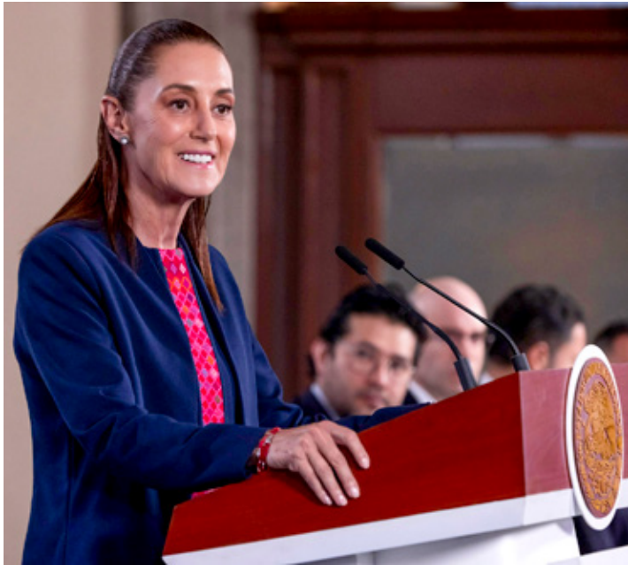
Tratan de influir en la política mexicana con señalamientos sin pruebas contra funcionarios nacionales, señaló Sheinbaum.

Como ejemplo, mencionó la reciente visita a México del