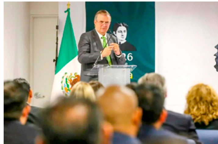
Marcelo Ebrard advierte sobre un nuevo sistema comercial mundial.

“Lo que determina tu posición es cómo están los demás. Es decir, el sistema anterior era ‘duty free’. No pagas ningún arancel. Ese sis-