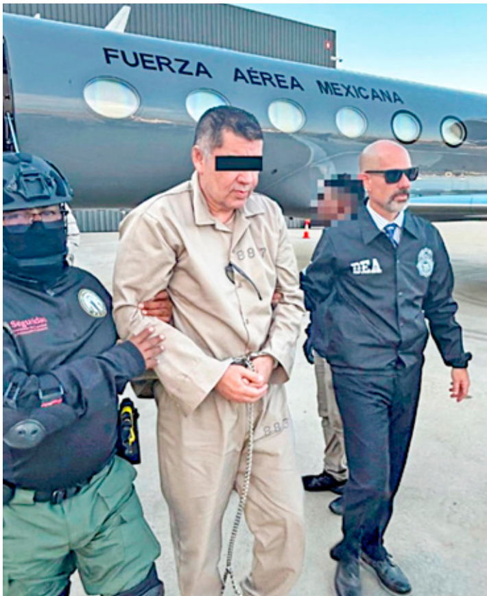
La penetración de esa agencia estuvo relacionada con la colaboración de cuerpos de élite navales.

"Siempre nos va a quedar la duda de si la guerra contra el narco fue una idea de Felipe Calderón o fue una idea de Obama,