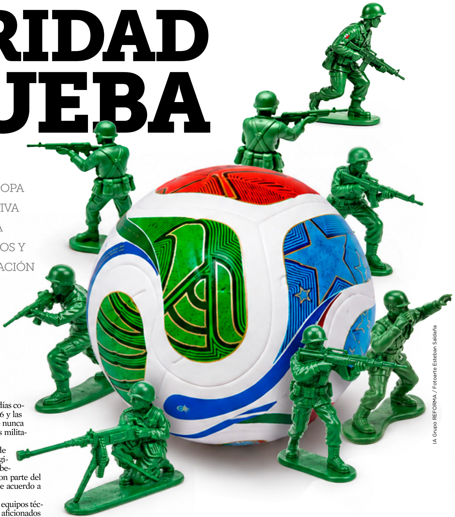
IA Grupo REFORMA / Fotoarte Esteban Saldaña

A diferencia de otras sedes mundialistas, Monterrey presenta un componente adicional: su cercanía con la frontera de Estados Unidos.