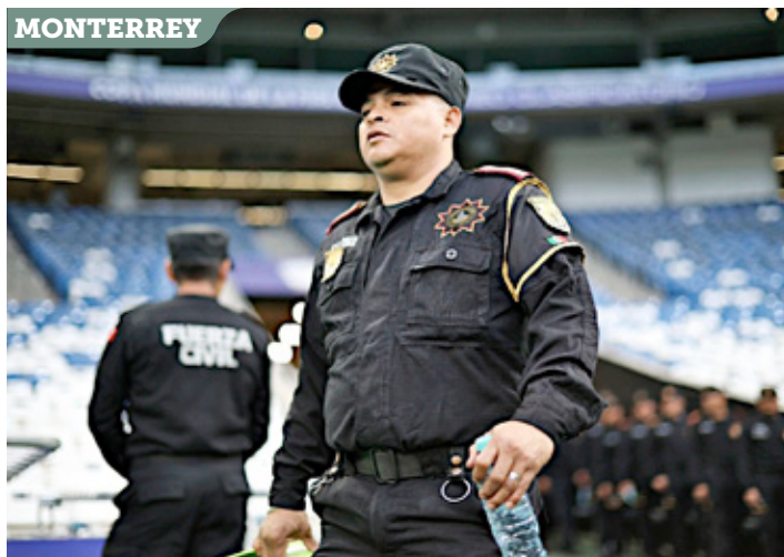
■ En el Estadio de Rayados jugarán Suecia, Japón, Túnez, Sudáfrica y Corea del Sur.

Las autoridades contemplan coordinación permanente con agencias estadounidenses para el intercambio de información relacionada con movilidad de aficionados, protección de delegaciones y monitoreo de posibles riesgos que pudieran afectar el desarrollo del torneo.