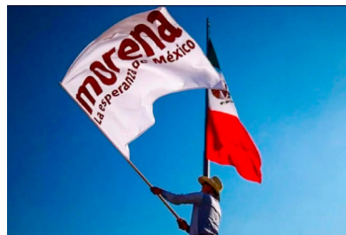
Para determinar condiciones que se podrá participar en procesos internos hacia las elecciones de 2027.

"En el año de 1996 ingresé a laborar al Poder Judicial del estado, donde hice carrera por más de 25 años, y del que llegué a ser su magistrado presidente por más de 10".