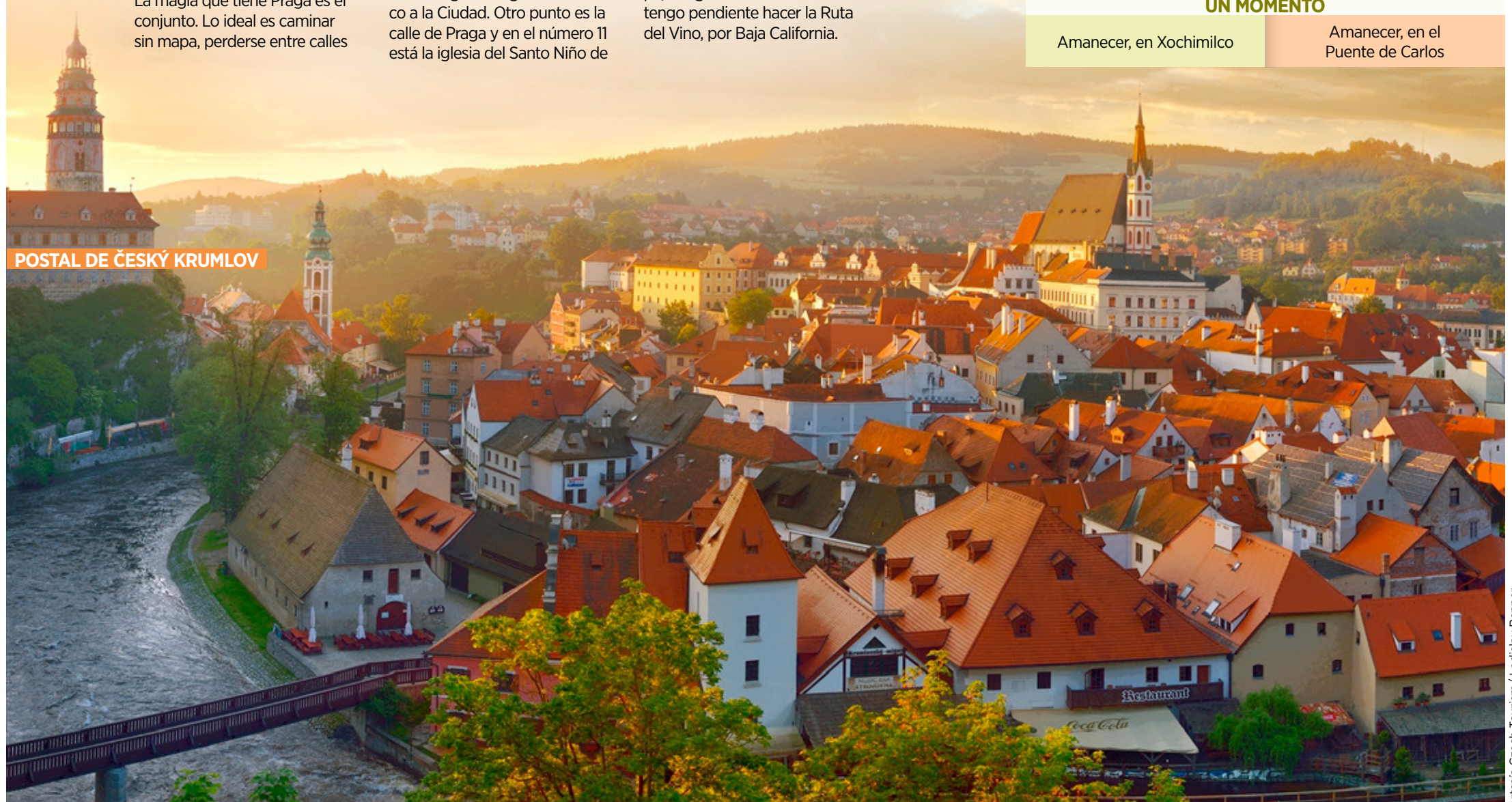
POSTAL DE ČESKÝ KRUMLOV