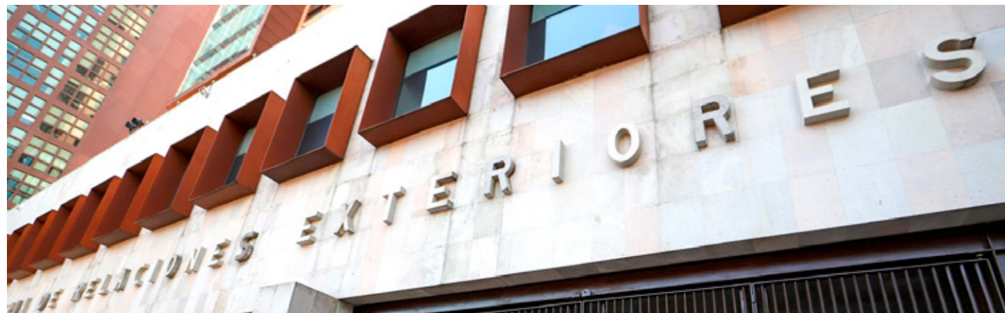
La presidenta Claudia Sheinbaum pidió al canciller Roberto Velasco revisar la actuación de los diplomáticos.

También pedirán licencia el diputado de Morena, Raymundo Vázquez Concha, quien va por la candidatura para la gubernatura de Tlaxcala; la senadora Lorenia Iveth Valles, quien va por Sonora, y el senador Raúl Morón, quien de nuevo buscará la candidatura por Michoacán.