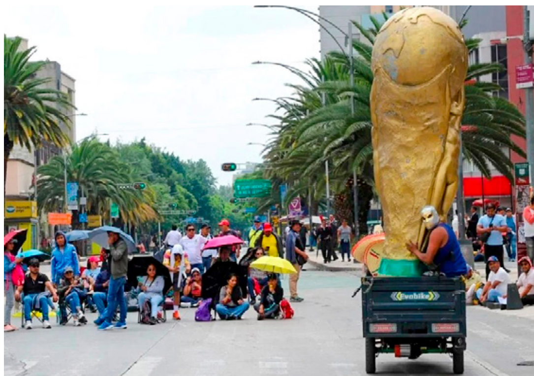
La ocupación hotelera a la baja de expectativas: CDMX, 78.7%; Monterrey, 65%, y Guadalajara, 67.12%.

Falta mejoría en ventas en 9 de cada 10 negocios