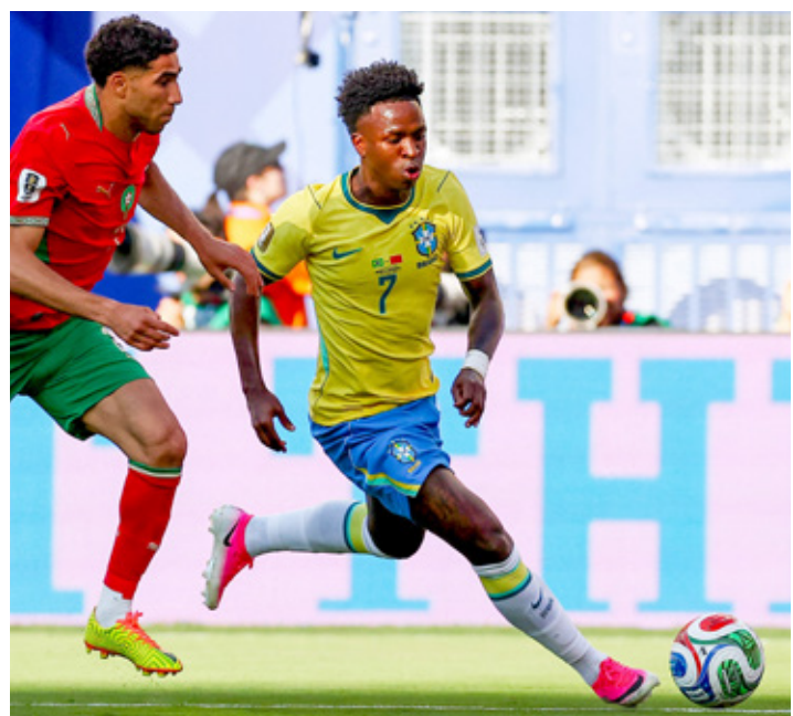
Los brasileños están invictos contra selecciones de Concafc en la Copa del Mundo.

Sudáfrica y Chequia empataron 1-1 en Atlanta y se juegan su pase a la siguiente ronda en la última jornada, contra Corea del Sur y México en el Grupo A, respectivamente.