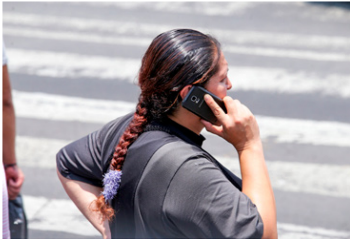
Se presentará un balance detallado sobre el avance del proceso, el jueves próximo.

La mandataria sostuvo que México es uno de los pocos países donde las líneas celulares no estaban plenamente vinculadas a la identidad de sus usuarios.