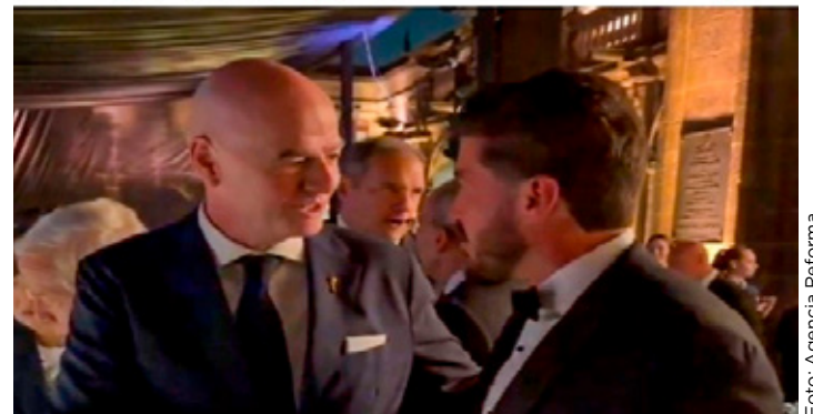
El inmueble histórico fue utilizado para la cena de gala previa al Mundial de fútbol.