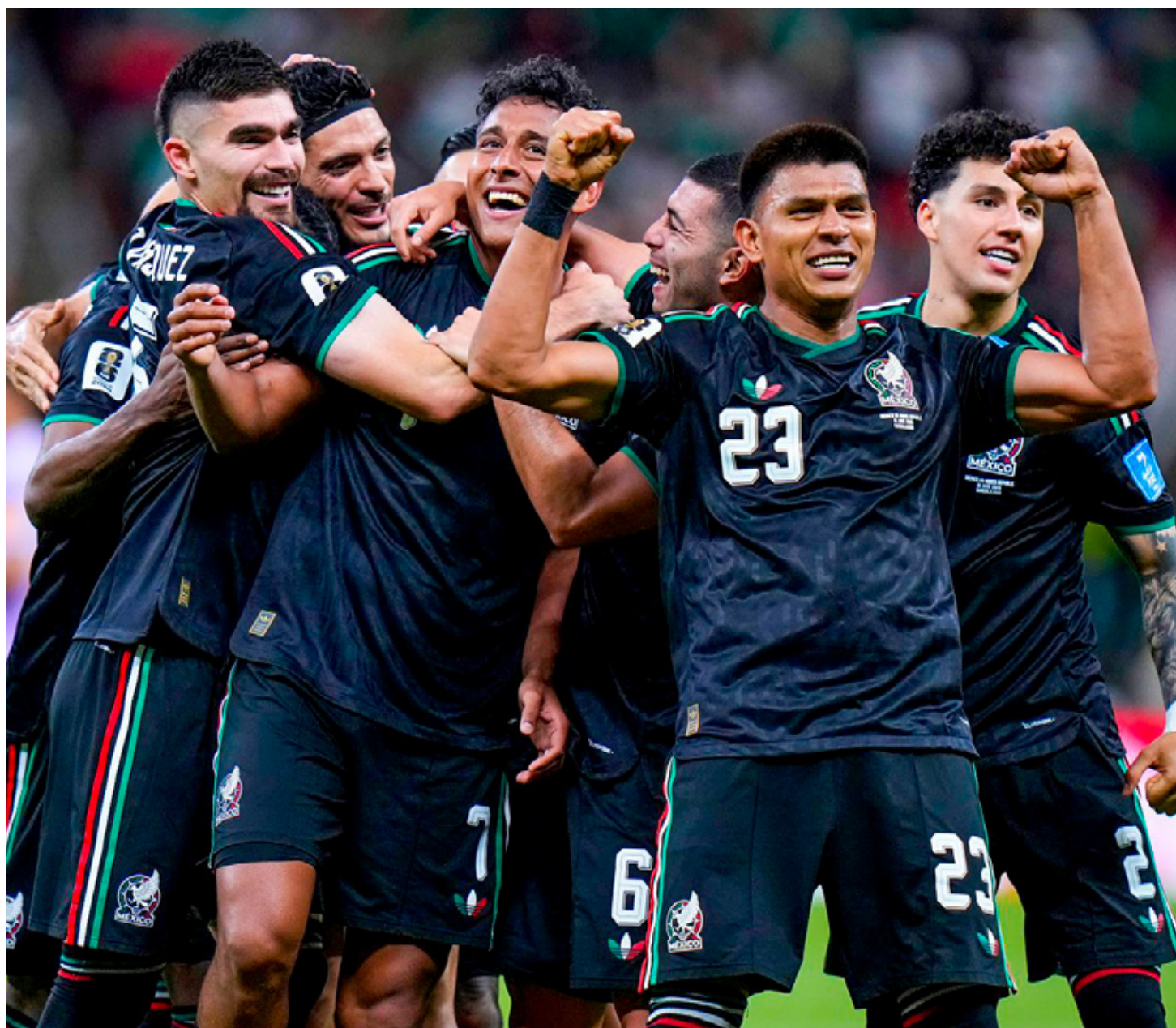
Esta es la sexta vez que México gana dos partidos de fase de grupos en un Mundial.

Luis Romo hizo el único gol del juego en Guadalajara