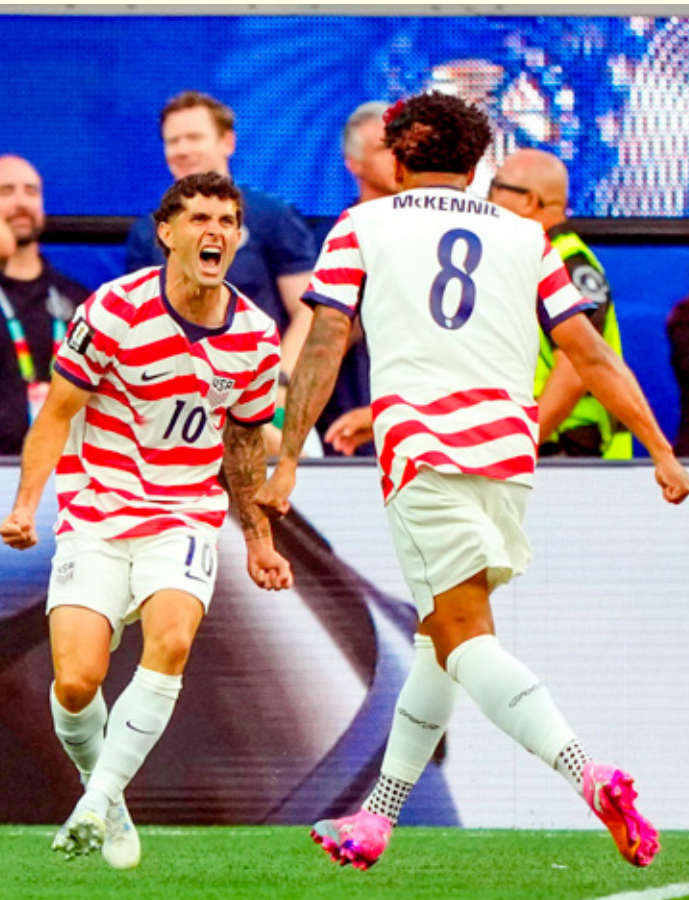
Estados Unidos no gana dos partidos en un mismo Mundial desde 2002.

Mientras que a las 22:00 horas, en San Francisco, Turquía y Paraguay se juegan su permanencia en el torneo. En otro partido que será inédito en la Copa del Mundo. La última victoria de los guaraníes en el torneo fue en la Jornada 2 de la fase de grupos en 2010, cuando vencieron 2-0 a Eslovaquia.