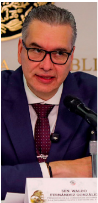
Un aspirante a gobernar Michoacán es el senador Raúl Morón.