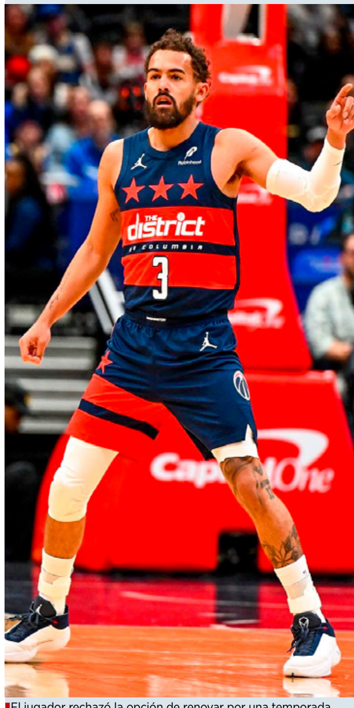
El jugador rechazó la opción de renovar por una temporada, para elegir la mejor opción de su contrato.