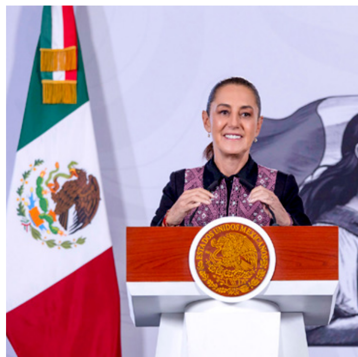
Los colectivos son atendidos en la Secretaría de Gobernación.

"Y justamente, además de que ya habíamos platicado con ella a través de otros compañeros. Alguien más quería registrar al pato como una marca, imagínense. O sea, qué abuso.