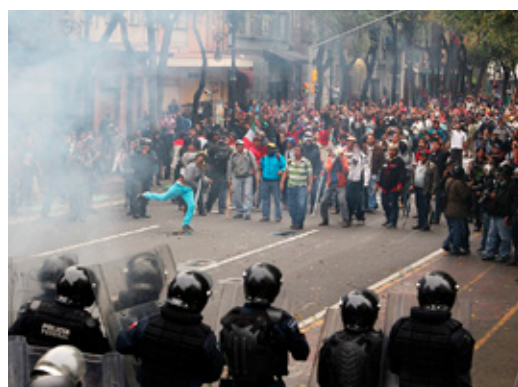
En 2013, se manifestaron contra la reforma educativa de Peña.

La crisis obligó al Gobierno federal a intervenir y convirtió a Oaxaca en el principal foco de conflictividad política del País. ■