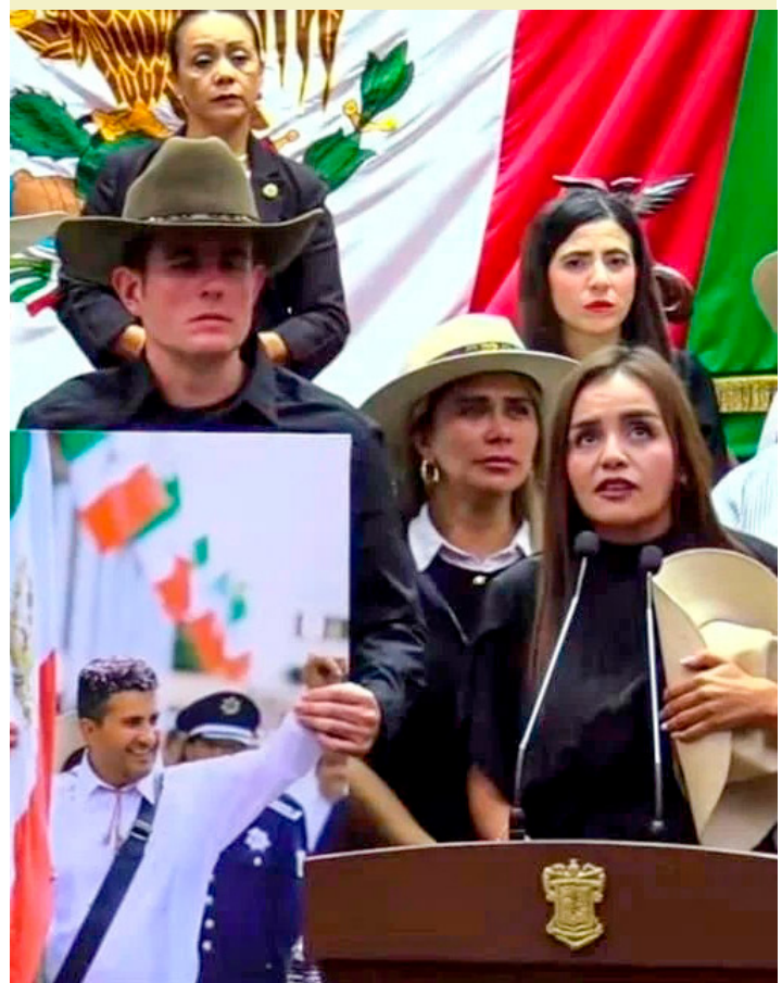
Claudia Sheinbaum rechazó que la reforma electoral aprobada en Michoacán busque cerrar el paso a las elecciones de 2027.