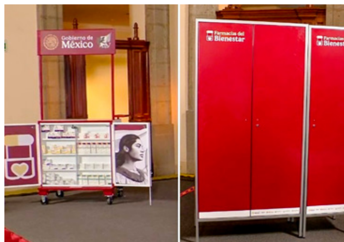
Ante un eventual desabasto en centros de salud, tiendas 'Alimentación para el Bienestar' o máquinas dispensadoras.

"Y si no, ya si de plano no encuentran en un lugar, pero tienen que haber pasado necesariamente por esos lugares, podrán incluso ir a una farmacia de una red de farmacias que estamos viendo para poder adquirir su medicamento y que no tengan