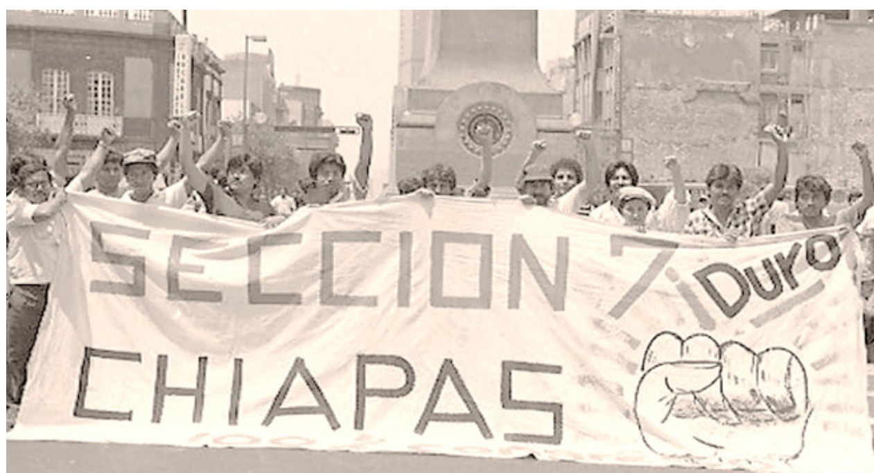
Maestros de Chiapas iniciaron el movimiento de la CNTE a finales de los 70.

Sheinbaum anunció que su Gobierno dialogará con los maestros en las aulas, por lo que rompió con una tradición de casi medio siglo.