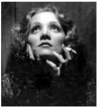
La cineasta Agnieszka Holland narrará la vida de Marlene Dietrich, diva alemana de la actuación.