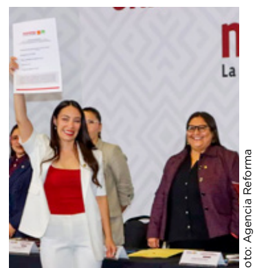
En Morena se aclaró que no están contemplados los contendientes aliados del PT y del PVEM.

"Que esta sea otra jornada más donde siga avanzando este proceso rumbo al fortalecimiento de la unidad y de nuestras tareas territoriales", afirmó al arrancar el registro del tercero de cinco días.