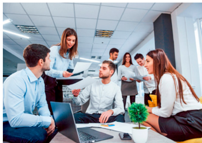
La PEA es de 62.1 millones de 15 años y más en el país, según Inegi.

En mayo de 2026, la tasa de participación económica (porcentaje de la población con trabajo, o que no tuvo, pero estaba