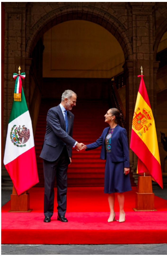
La presidenta Claudia Sheinbaum recibió al Rey Felipe VI de España.