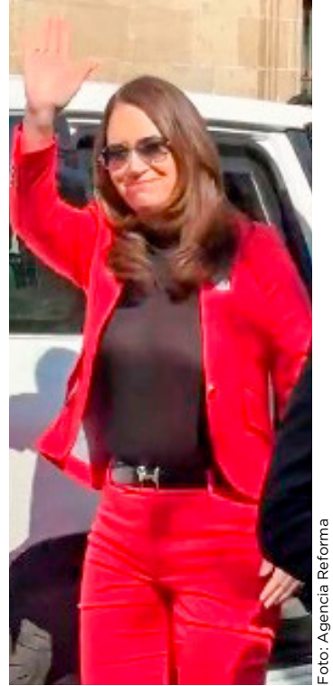
Estarán en la apertura de la planta de moscas estériles contra el gusano barrenador en Chiapas.

Como ejemplo mencionó la muerte de mexicanos en centros de detención del Servicio de Inmigración y Control de Aduanas (ICE), tema que su gobierno