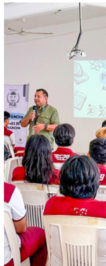
La Fiscalía General destacó los avances del Programa de Prevención a través de la Educación.

La funcionaria entrante aseguró que la estructura del ayuntamiento se mantiene firme, descartando la ejecución de relevos o movimientos en el gabinete local y garantizando una transición