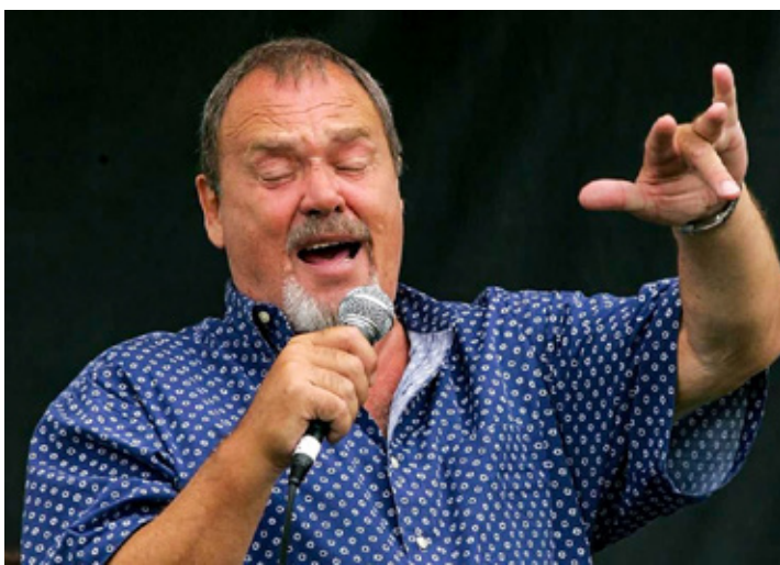
Falleció David Clayton-Thomas, cantante principal de Blood, Sweat & Tears.