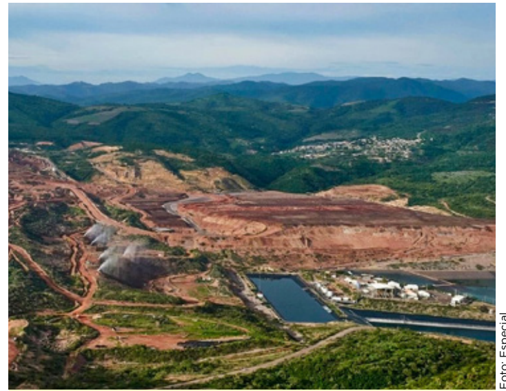
Tras casi un año en pausa, la mina Los Filos reactivará sus actividades.