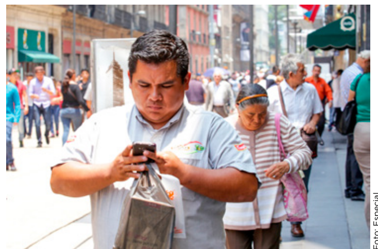
Los usuarios podrán hacer uso dependiendo del último dígito de su número.

para el registro de líneas celulares en México difícilmente resolverá el principal obstáculo del proceso: la resistencia de millones de usuarios a vincular sus números, consideró el director de The Competitive Intelligence Unit (The CIU), Ernesto Piedras.