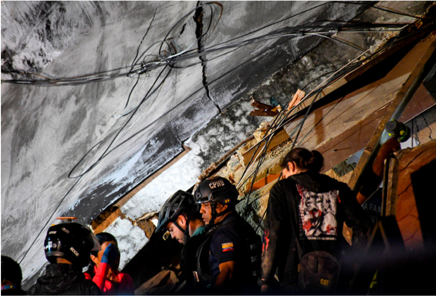
La presidenta Sheinbaum se solidarizó con el pueblo venezolano y adelantó la posibilidad de enviar más apoyo.

También personal de sanidad de la Defensa