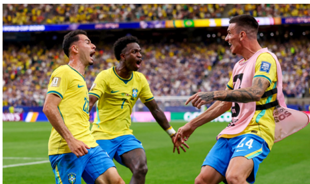
Los brasileños enfrentarán al ganador de la llave entre Costa de Marfil y Noruega.

Manchester City presentó al italiano Enzo Maresca como su nuevo director técnico, tras la salida de Josep Guardiola. El entrenador firmó por tres temporadas.