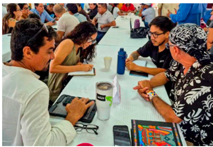
■ Habitantes de Mahahual y autoridades locales y federales analizan el desarrollo de la comunidad.

urgencia de reordenar el comercio ambulante en el malecón, transparentar las próximas obras públicas y asegurar que la derrama económica beneficie de manera directa a la población local.