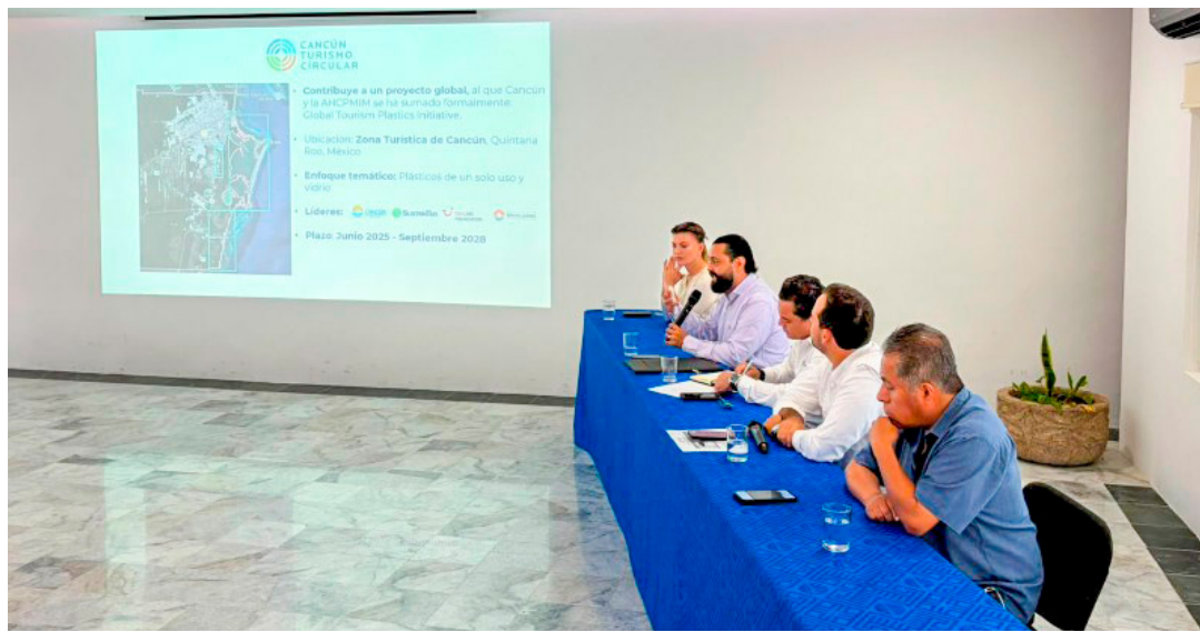
■ La Asociación de Hoteles de Cancún, Puerto Morelos e Isla Mujeres admitió la baja ocupación.

Los impulsores del proyecto señalaron que esta colaboración permitirá generar soluciones de largo plazo y fortalecer el cumplimiento de los compromisos ambientales asumidos por el municipio de Benito Juárez y por la industria turística del Caribe Mexicano.