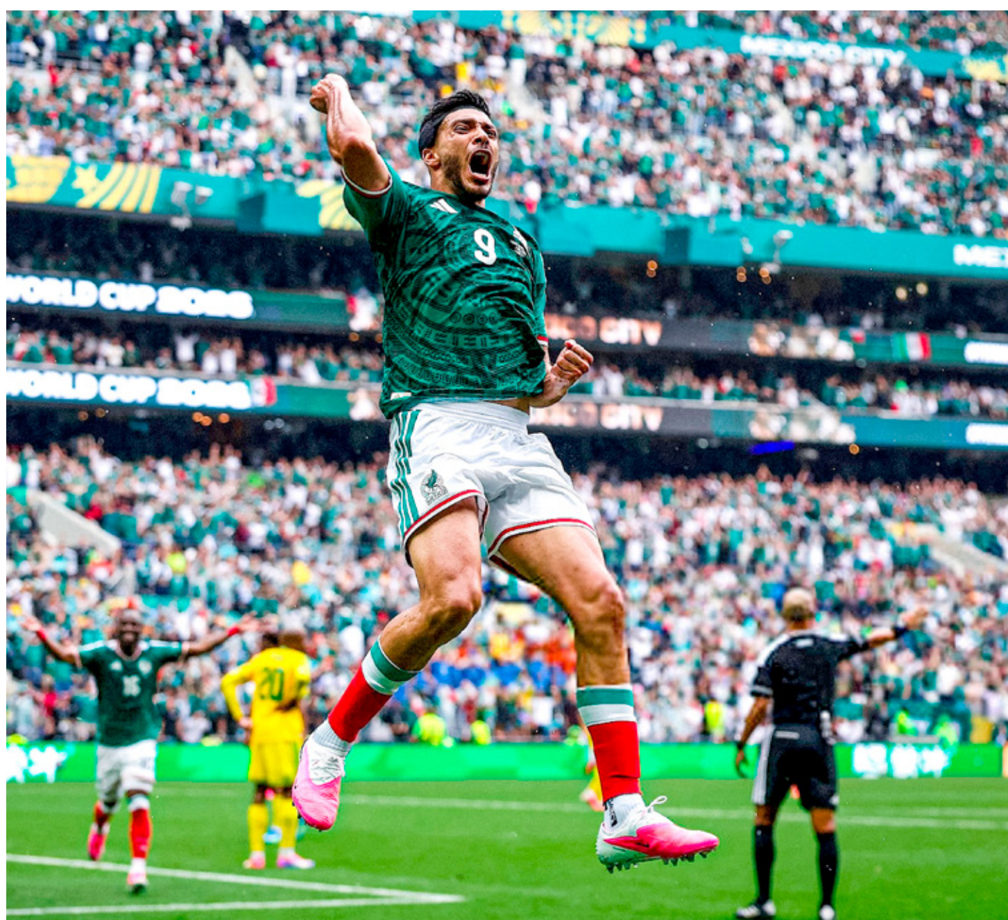
La Selección Mexicana va por su primera victoria en una ronda de eliminación directa en 40 años.

Va por la victoria en los dieciseisavos de final