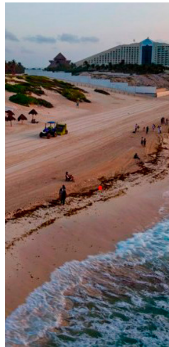
■ El Ayuntamiento de Benito Juárez fortalece la estrategia integral de atención al sargazo.

La próxima reunión quedará programada para mediados de julio, fecha en la que Semarnat presentará las alternativas y proyectos de desarrollo sustentable para la región.