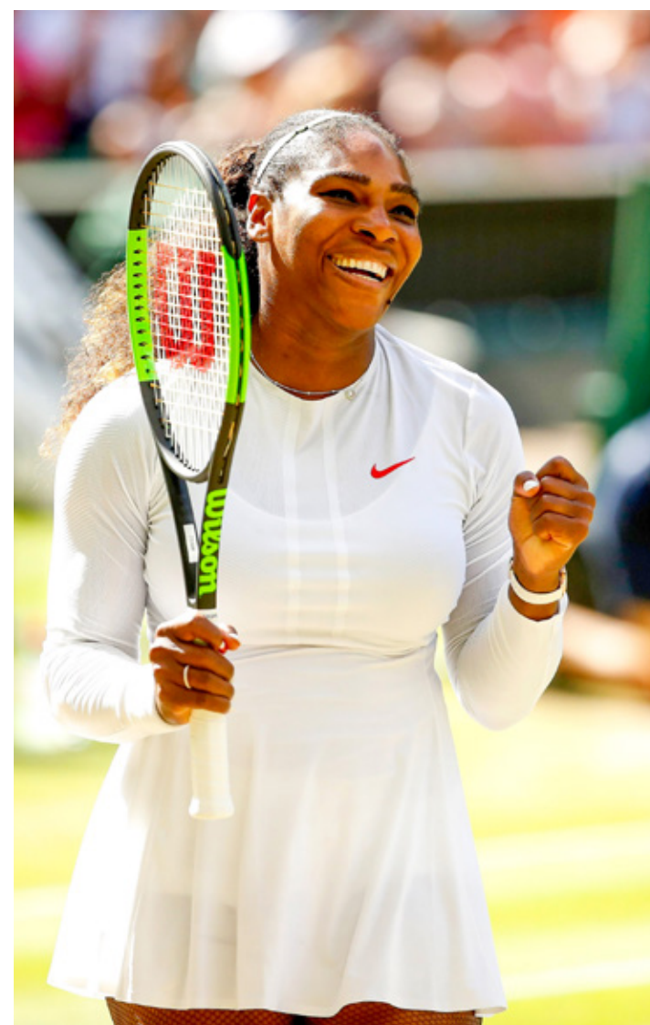
La tenista jugará en la modalidad de singles por primera vez en cuatro años.