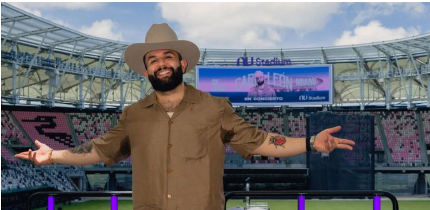
El cantante Carín León se presentó en el Nu Stadium, la nueva casa del equipo de fútbol Inter Miami.