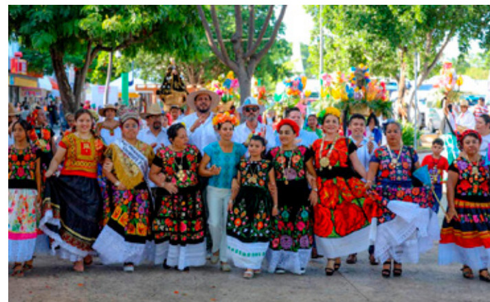
■ El ayuntamiento avanza en la logística de la edición 2026 de la Guelaguetza en Cancún.

El esquema operativo preliminar contempla que el tradicional desfile de La Calenda, así como