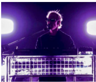
Rufus Du Sol ofreció el concierto frente a 66 mil 900 personas en el Estadio GNP.