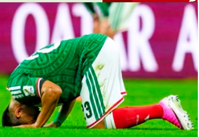
De nuevo la tristeza y frustración de la Selección Mexicana por quedar fuera del Mundial en Octavos de Final.