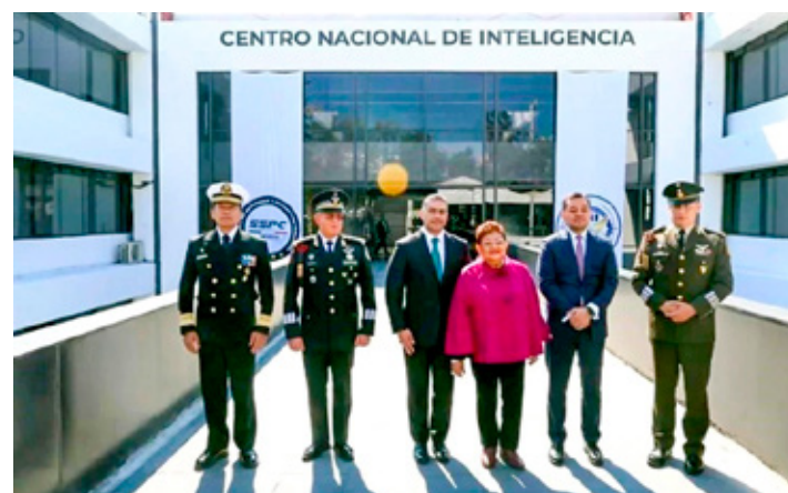
Ceremonia solemne en el marco del 107 Aniversario de los Servicios de Inteligencia en México.

El tribunal constitucional analizará si las acciones de inteligencia y contraespionaje militar requieren autorización judicial.