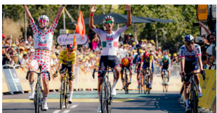
■ Esta es la primera victoria de un mexicano en el Tour de France en 37 años.

La FIFA levantó la suspensión sobre el delantero de Estados Unidos Folarin Balogun y podrá jugar contra Bélgica este lunes. Balogun fue expulsado en la ronda previa.