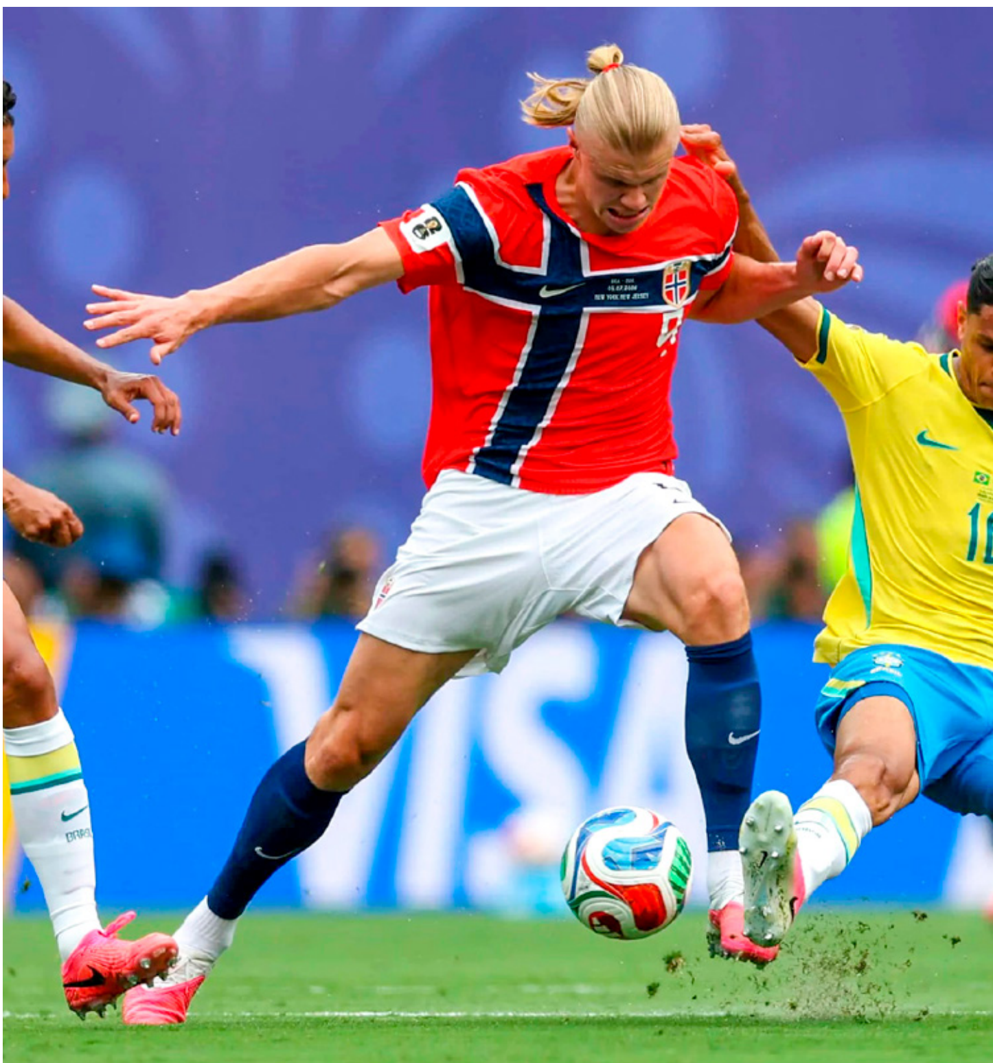
■ Noruega mejoró su récord contra Brasil a dos victorias y un empate en toda la historia.

Los 'vikings' están invictos contra la 'verdeamarela'