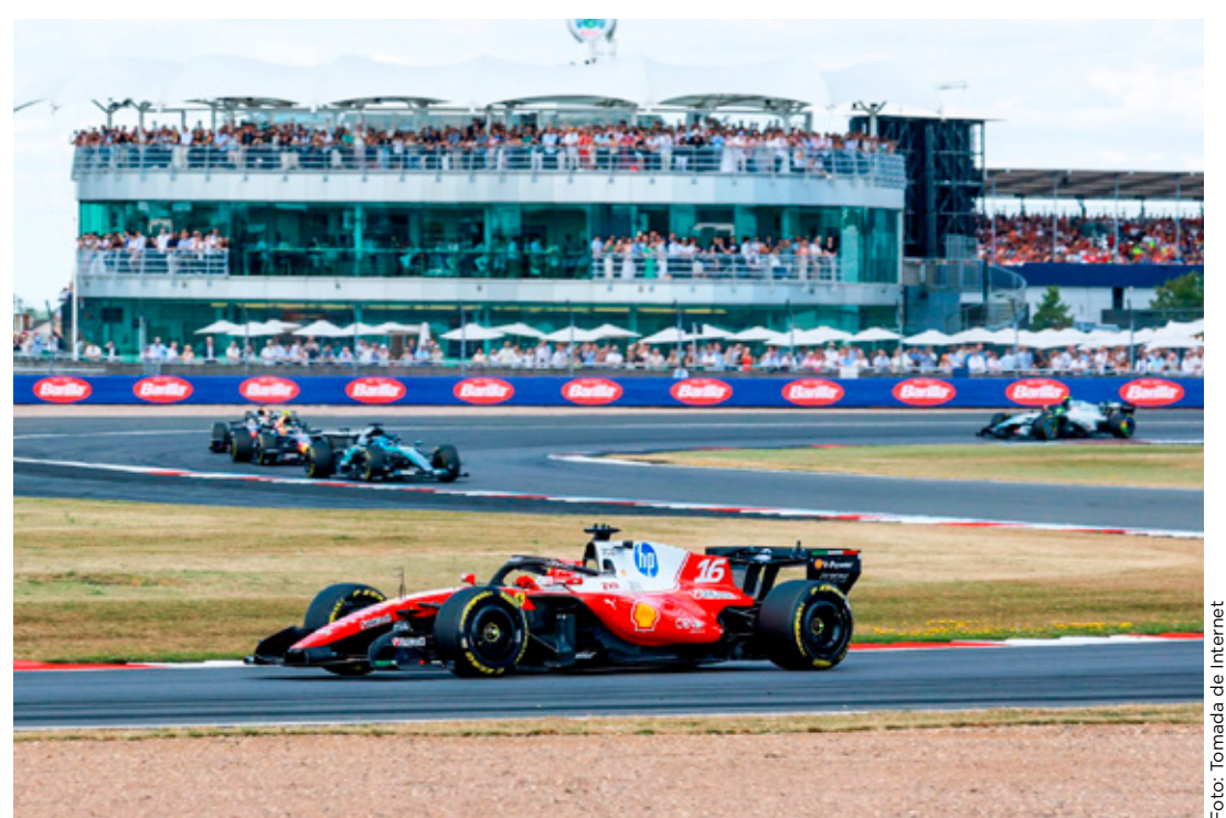
■ Charles Leclerc ganó su primera carrera del 2026 y la segunda de Ferrari en la temporada.

La próxima parada de la F1 será el Gran Premio de Bélgica el próximo 19 de julio, en el circuito de Spa-Francorchamps.