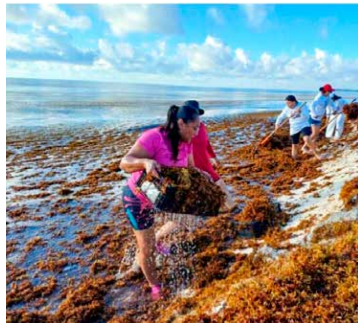
Frente al incremento de sargazo en las costas, especialistas consideran replantear estrategias de control.

"Mientras no la tengamos, cuando llega ya a la costa rebasa la capacidad de recolecta; si es