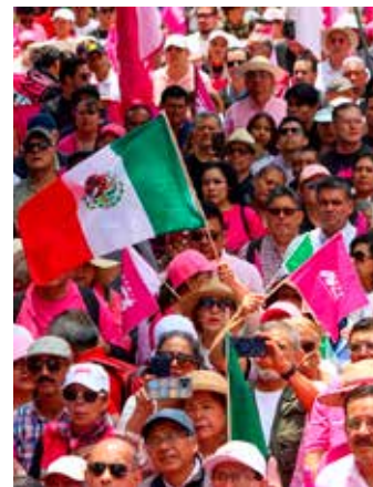
Quintana Roo dispondrá de 10 opciones políticas en las boletas electorales para el 2027.