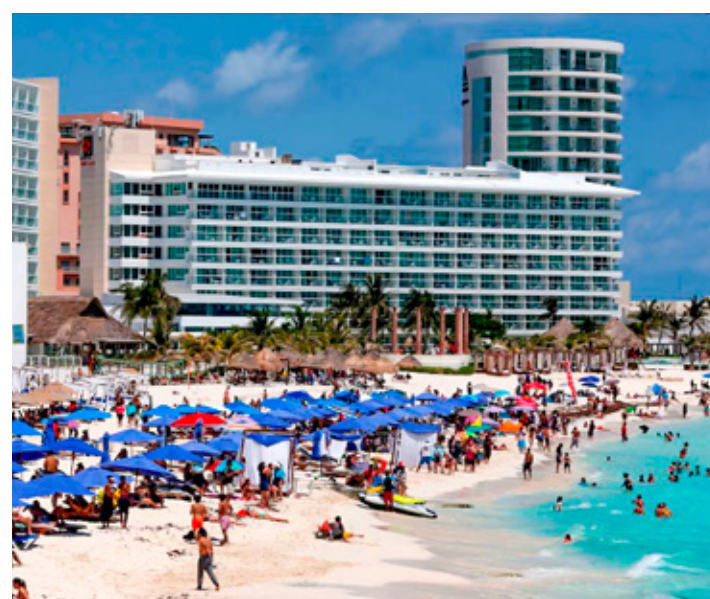
En el Caribe Mexicano prevalece una creciente competencia internacional y desafíos del mercado turístico.