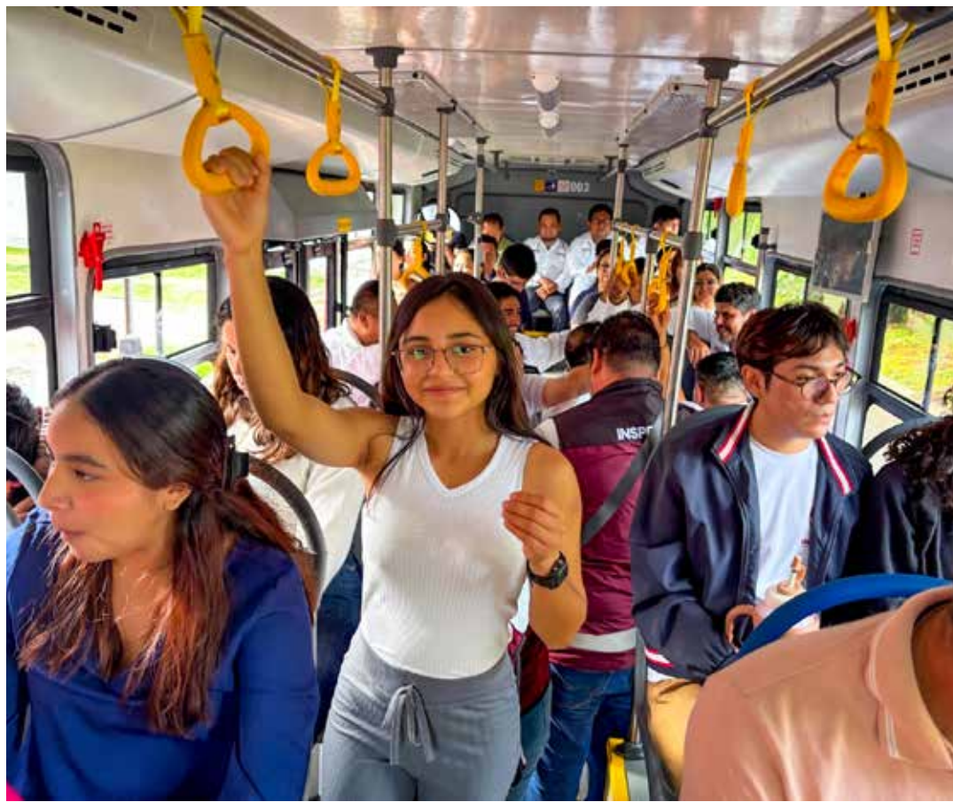
Estudiantes, adultos mayores y personas con discapacidad podrán acceder a descuentos o viajes gratuitos.

Aunque la demanda de auxilio se extiende a comunidades más alejadas como Nicolás Bravo, San Pedro Peralta y La Unión, la falta de combustible impide el traslado constante de las unidades hacia esos puntos.